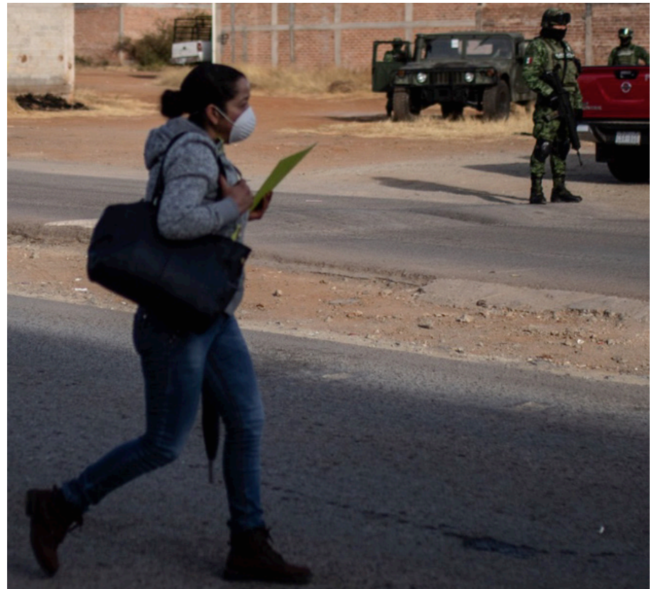
▲ Ante la situación que vivimos, las mujeres deben cuidarse a sí mismas, recomienda la SEPRAC

La respuesta de la funcionaria se da luego de que se han encontrado a mujeres -en su mayoría provenientes del Estado de México- quienes han referido que fueron abordadas por hombres que las drogan y, posteriormente aparecen en otras entidades.