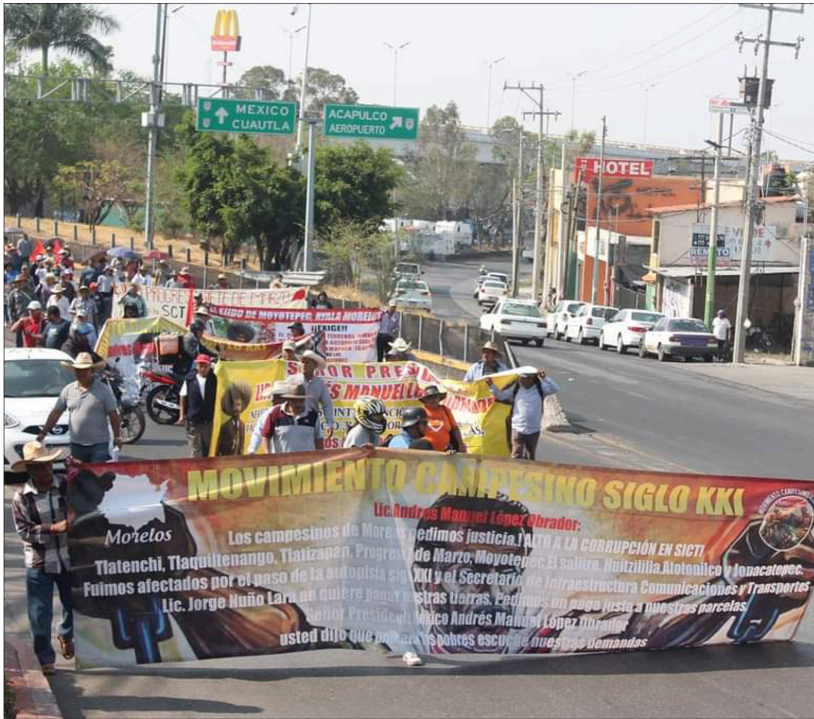
● Integrantes del Movimiento Campesino Siglo XXI, realizan una caravana hacia el Palacio Nacional en la Ciudad de México para exigir el pago íntegro de sus tierras afectadas por la construcción de la autopista.