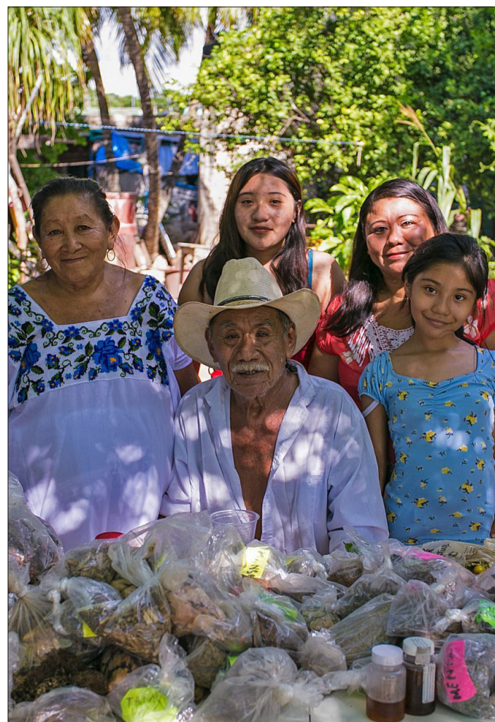
▲ Más que cooperativas necesitamos cooperativistas, personas que reconocen los principios de solidaridad y cooperación.

* Profesora-Investigadora de Tiempo Completo Titular A del Centro de Investigación Transdisciplinar en Psicología CITPsi de la Universidad Autónoma del Estado de Morelos UAEM. imke.hindrichs@uaem.mx