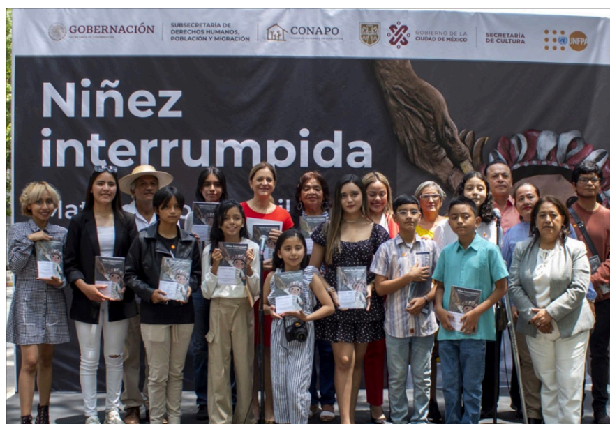
► Arte y reflexión social en la propuesta de las creadoras morelenses.

Las obras de ambas jóvenes se exhibirán en la Galería Abierta de la Secretaría de Cultura de la Ciudad de México hasta el próximo 30 de junio.