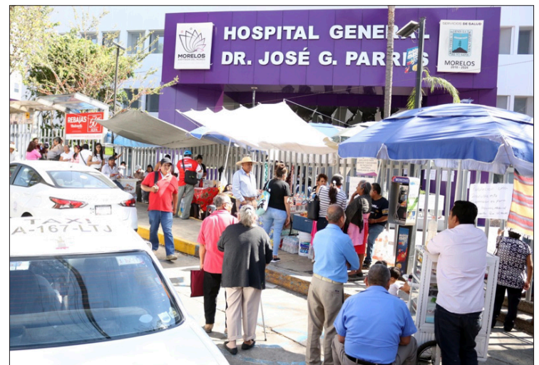
▲ La condición de un paciente empeora sin que los médicos del Hospital General se decidan a atenderlo.