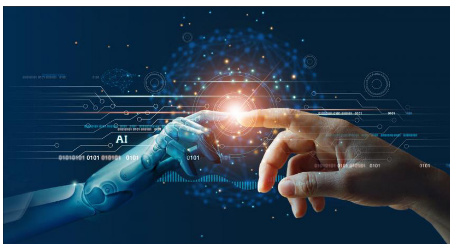
▲ Imagen: Getty Images

*Especialista en salud pública. Invitada por Eduardo C. Lazcano Ponce.