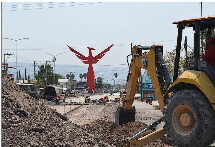
▲ A punto de concluir las obras para la inauguración del Fénix, el próximo 15 de mayo.

"No había ni qué comer, todo se había caído, el mercado cerrado, fue una noche muy difícil, al otro día iniciamos los trabajos de ayuda a las 6:30 de la mañana, convoqué a personajes políticos e hicimos tandas de comida, todos los sectores ayudaron, los empresarios mandaban verduras, gente humilde preparaba comida con lo que tenía y salían a repartir a los voluntarios, nosotros éramos ciudadanos, no estábamos en el tema político en ese momento, o sea, recibimos de todo, y la ventaja que tuvimos fue la unión y que todo se le daba a la gente".