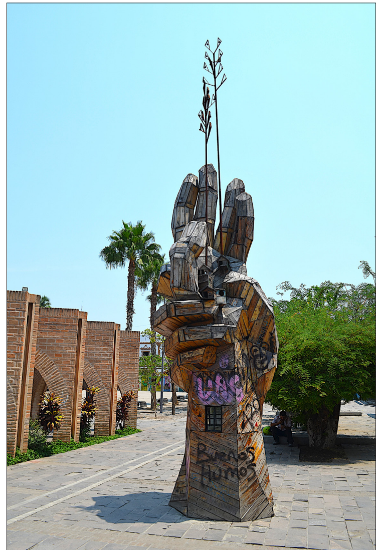
▲ Monumento interactivo, la gente lo puede intervenir libremente.

“Yo soy creyente y al final creo que Dios pone y Dios quita, si va a ser para ti, va a ser, por supuesto que llevo una trayectoria política de toda mi vida y por supuesto que me gustaría ser gobernador de este Estado y esa es una aspiración legítima. Por el momento sigo haciendo mi trabajo para tener posibilidad, sobre todo porque estoy demostrando que sí se pueden hacer las cosas, y lo digo muy serio porque con nuestro