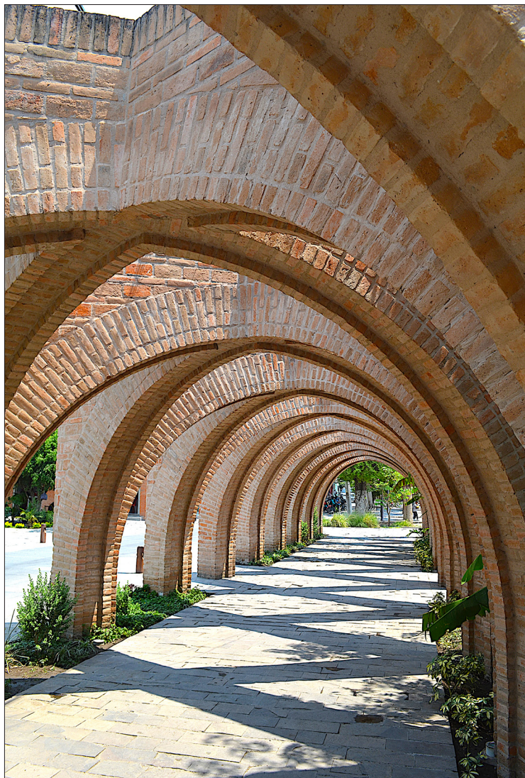
▲ Las arcadas del centro de Jojutla, en poco tiempo se convirtieron en un emblema del municipio.

“El Ave Fénix renacía de sus cenizas, entonces se convertía, en un ave todavía más hermosa. Así fue en Jojutla: el Sismo del 2017 nos destruyó y hoy nadie me puede negar que estamos mejor que antes del sismo”.