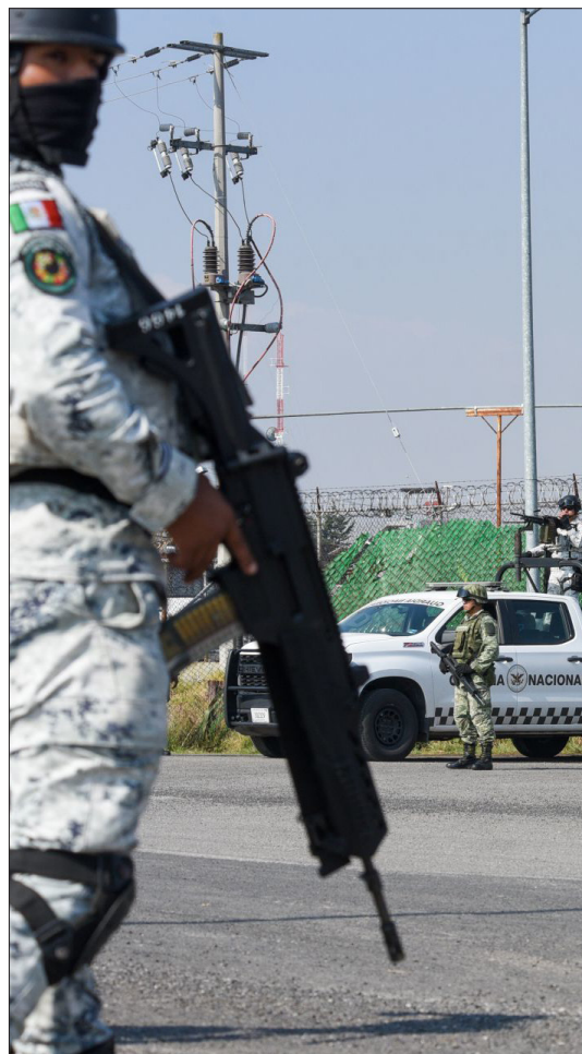
▲ Pareciera que la sociedad ha instaurado una pedagogía de la violencia.