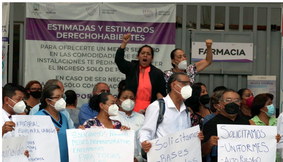
▲ Personal Administrativo del sector salud de Morelos protesta por falta de pago del bono COVID, uniformes y material para realizar su trabajo.

Martha es madre de dos hijos y está actualmente asignada al área de pediatría. Refiere que ha acumulado mucha experiencia en su trabajo y que "sin duda, volvería a elegir siempre ser enfermera. No hay labor ni profesión en la que cada día se permita demostrar un amor incondicional a cualquier persona como en la enfermería. No importa a qué comunidad nos manden, el rechazo de algunas personas, la falta de apoyo de la familia, las carencias... Aquí trabajamos para todos; de nosotros también dependen muchas vidas", concluyó.