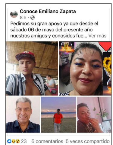
▲ Imagen: Captura de Pantalla

La comisionada de búsqueda en Morelos lanzó un exhorto a la población que pueda aportar algún dato. "El llamado que se hace a la población de aquella zona es que nos ayudan principalmente a la difusión de las fichas de búsqueda y