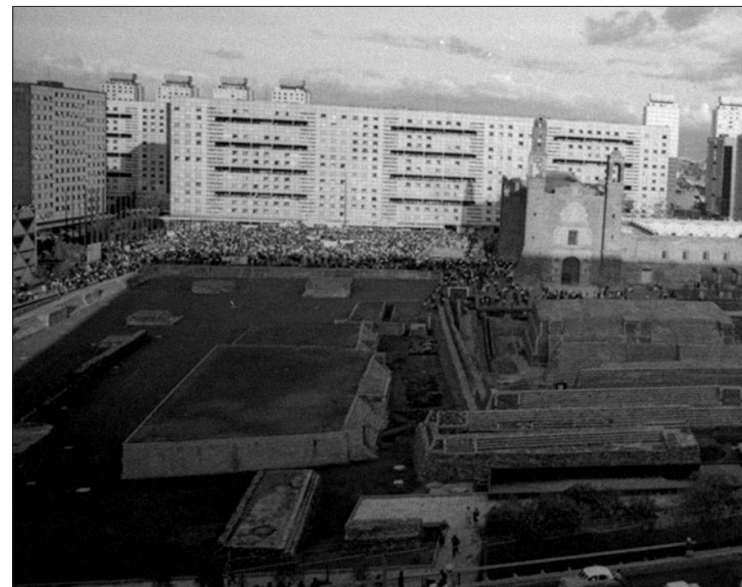
◀ Plaza de las Tres Culturas, 2 de octubre de 1968.

"Yo les dije a los muchachos: mañana 3 de octubre empieza en México la revolución, el pueblo no va a soportar esto, es inaudito , pero el 3 de octubre en la mañana el lechero fue a entregar su leche, el taxista salió a trabajar y el panadero abrió la panadería y todo fue normal, porque nadie se informó, no se sabía, el noticiero que todo el mundo veía, 24 horas con Jacobo Zabludowsky, dijo que el ejército había sido provocado y que eran alrededor de veintitantos los muertos". (CONCLUIRA).