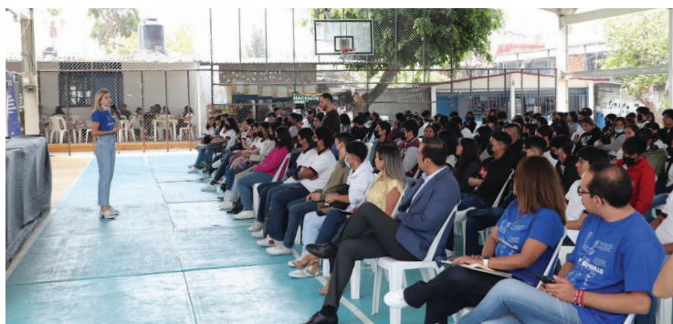
▲ Bajo el slogan #TuHacesElAmbiente alumnos de bachillerato efectuaron actividades relacionadas con la separación de residuos, el uso de composta y reciclaje.