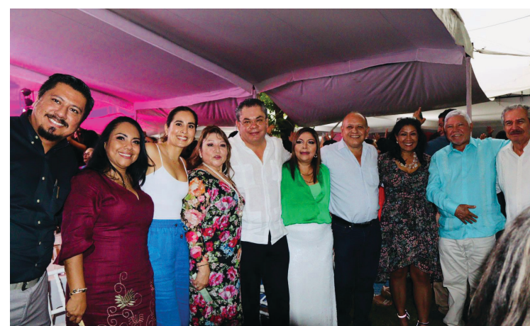
▲ Celebra Gobierno de Jiutepec a más de tres mil docentes.