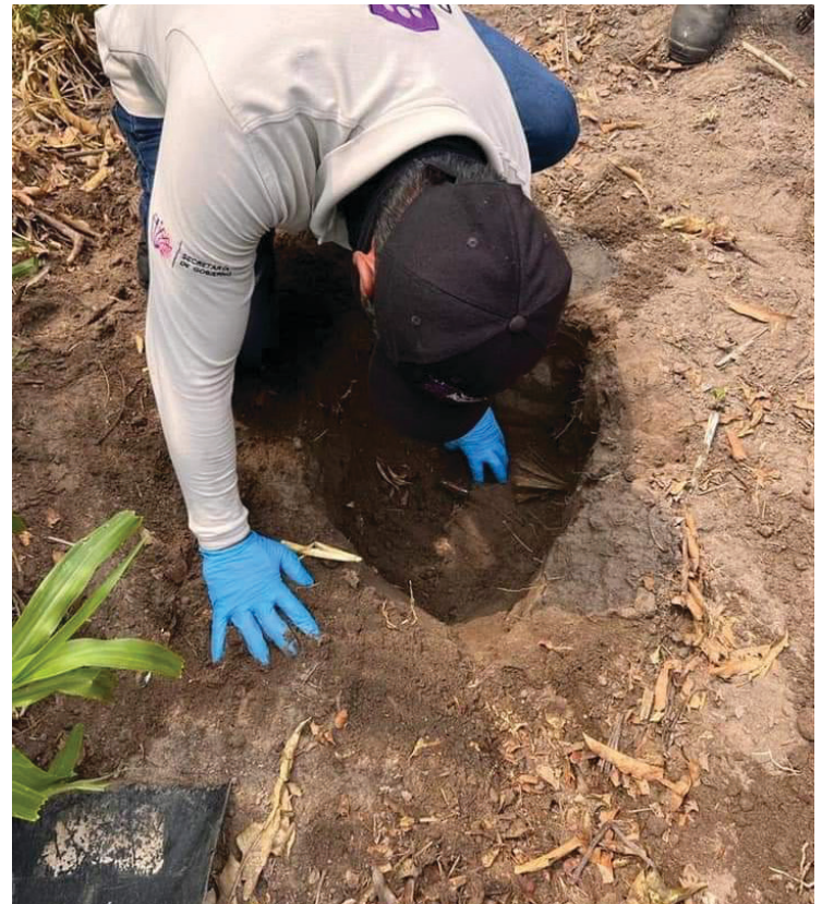
▲ En la ribera del río Tembembe, en Puente de Ixtla, se localizó el entierro clandestino.

Por último, las autoridades estatales estarán en espera de que se concluyan las labores de exhumación para que se pueda determinar el número de individuos e identificación de las personas exhumadas.