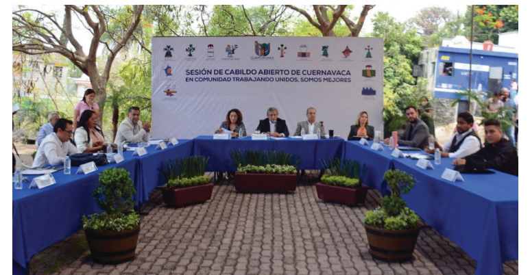
▲ El presidente municipal de Cuernavaca, José Luis Urióstegui puntualizó que éste es un ejercicio democrático de escuchar y tomar decisiones.