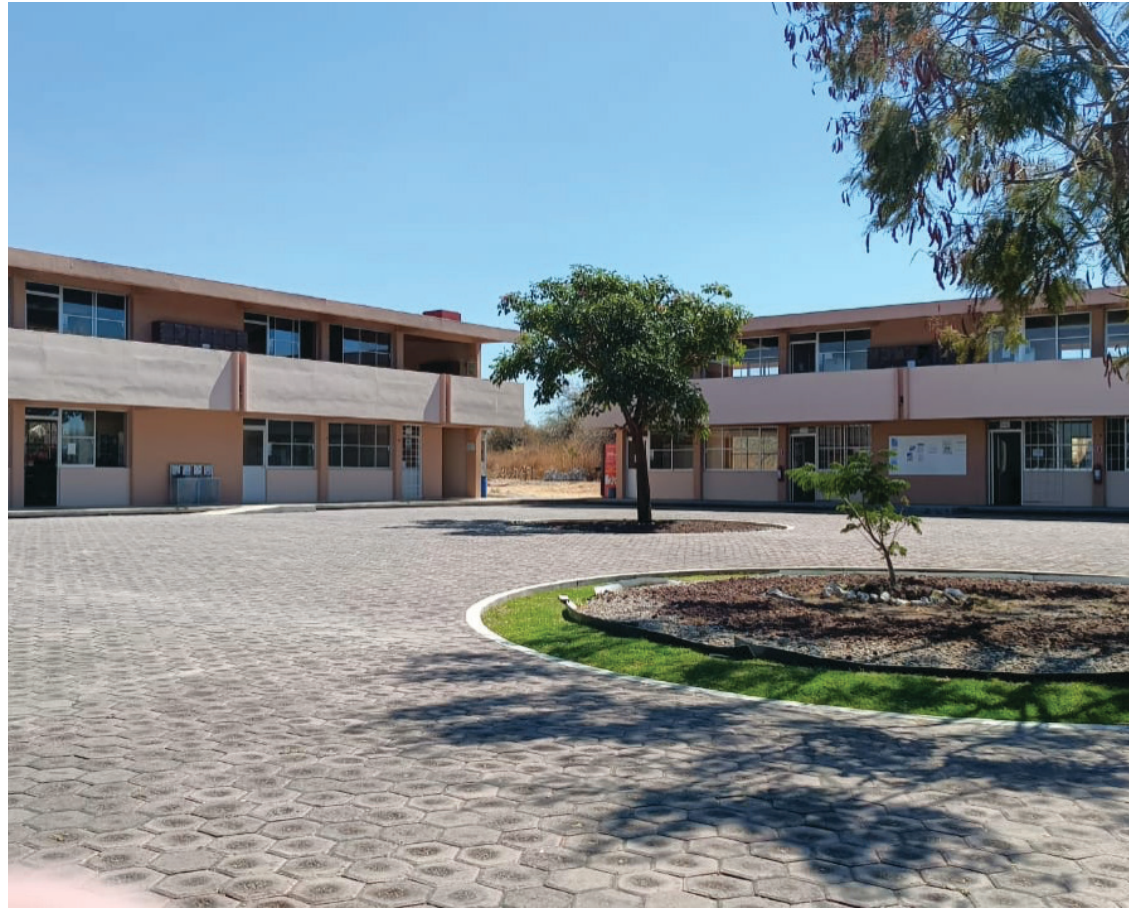
▲ Los campus que suspendieron las clases presenciales, podrían regresar a ellas en cuanto no existan riesgos para la comunidad universitaria, dijo el rector. / UAEM campus Yecapixtla.

González Mejía consideró necesario que la máxima casa de estudios pueda generar la reactivación de los "Venabuses" para que todos aquellos estudiantes que tengan caminar a las paradas no corran el riesgo de algún asalto o robo.