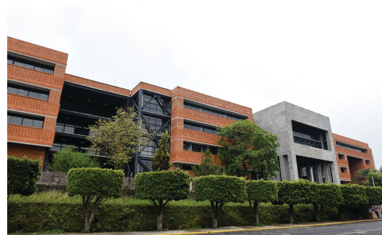
▲ Persiste la inseguridad en la periferia de la Universidad, denuncia la Federación de Estudiantes.