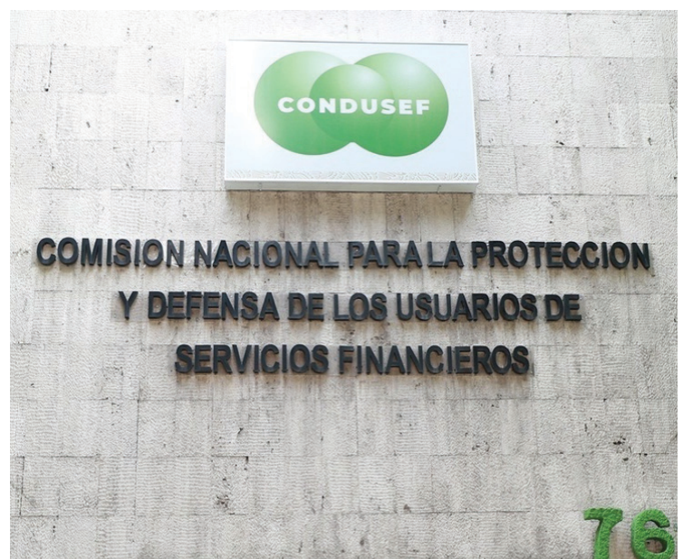
▲ Los defraudadores abusan de la confianza de algunos adultos mayores para saquearles sus tarjetas, advierte la Condusef.