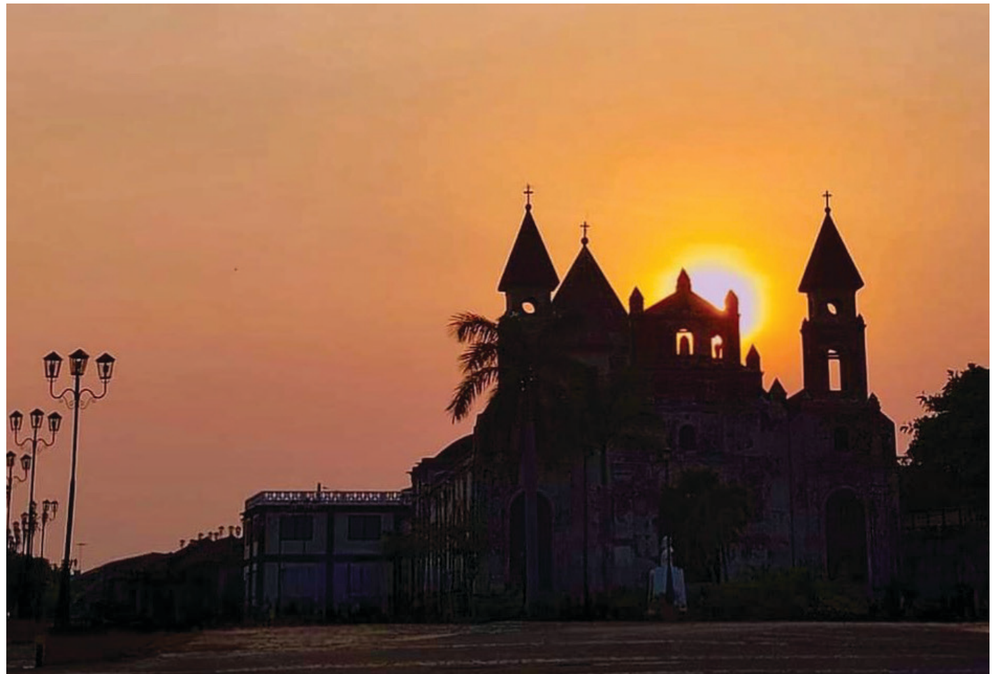
▲ Templo de Guadalupe en Granada.

ros de adobe y bajareque y cubiertas a dos aguas con teja de barro. Una gran plaza en la zona baja de la ciudad conforma parte de la retícula de su traza ortogonal, que corre a lo largo de una ladera, privilegiando las edificaciones de la zona alta por la brisa fresca que corre desde el lago. Las calles son empedradas y se escuchan las pisadas ocasionales de caballos tirando de carretas para llevarte a recorrer la ciudad, recreando la atmósfera de los tiempos antiguos.