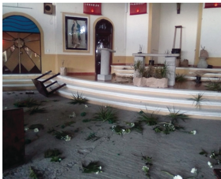
◀ Los templos no están exentos de la inseguridad y constantemente experimentan robos atribuibles a bandas delincuenciales, comenta el vicario de la Diócesis de Cuernavaca, Tomás Toral.

La novena caminata por La Paz partirá de la iglesia de Nuestra Señora de la Natividad, ubicada en Tlaltenango para concluir en el atrio de la Catedral de Cuernavaca.