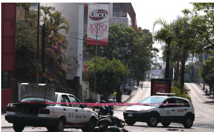
▲ Con auxilio de videos la Seprac planea concientizar a los trabajadores del volante en la importancia de respetar las normas viales y a cuidarse de ser víctimas de delitos.

Por último, en la campaña de concientización, tratarán de regular que las motocicletas eviten circular con permisos de circulación, pues en los operativos de seguridad han incautado un mayor número de este tipo de vehículos con reporte de robo.