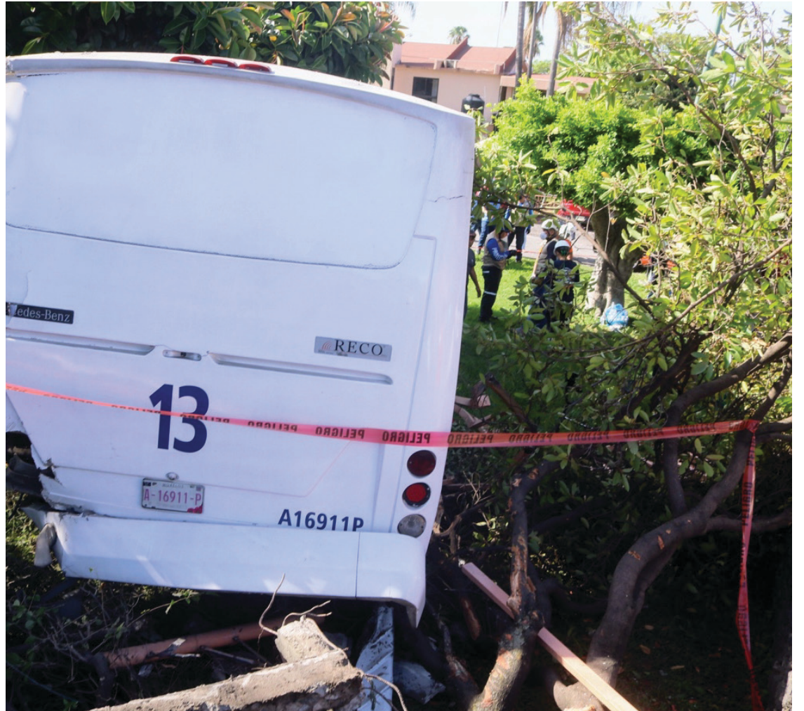
▲ Mientras se deslindan responsabilidades, el conductor de la unidad permanecerá detenido, dijeron las autoridades.

El funcionario recordó que, en lo que va del año, ya se han verificado 4 casos como estos, y exhortó a los conductores del transporte público a que tengan más precaución.