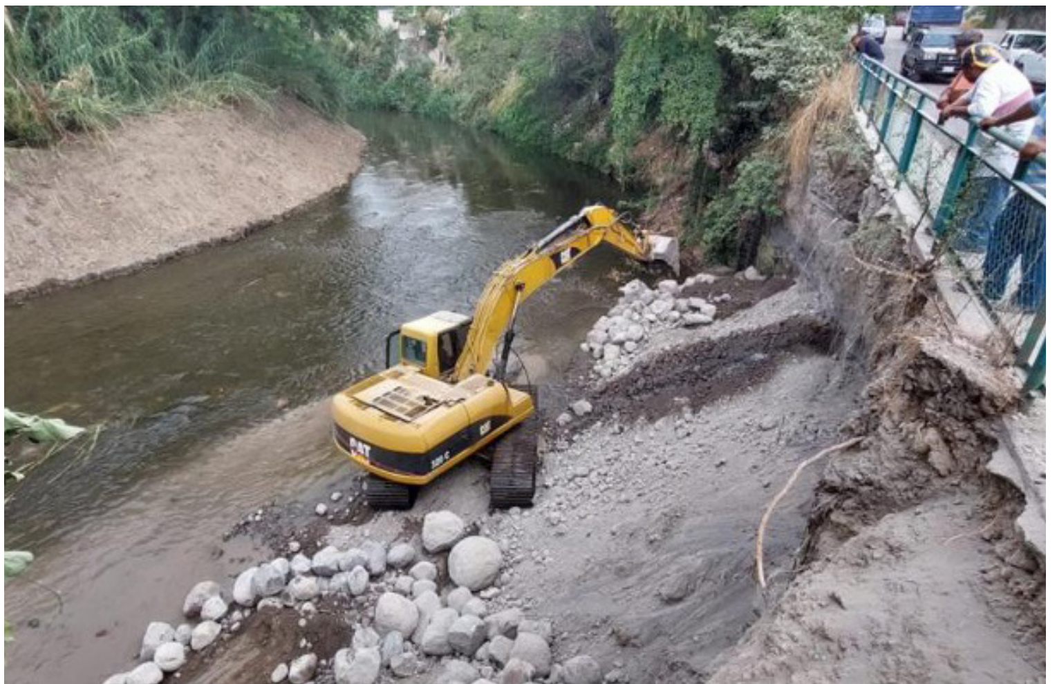
▲ Con un dique se espera desviar el cauce del río para evitar que siga erosionando la base de la carretera