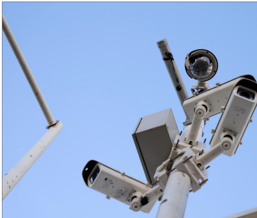
▲ El Consejo Ciudadano de Seguridad Pública y Procuración de Justicia considera positiva la instalación de cámara de vigilancia, "pero hay que instalarlas en los lugares adecuados", advierte.

Rueda Moncalián expresó que la ciudadanía en general está de acuerdo en que se coloquen los dispositivos que sean necesarias para resguardar a la ciudadanía, identificar y detener a los delincuentes.