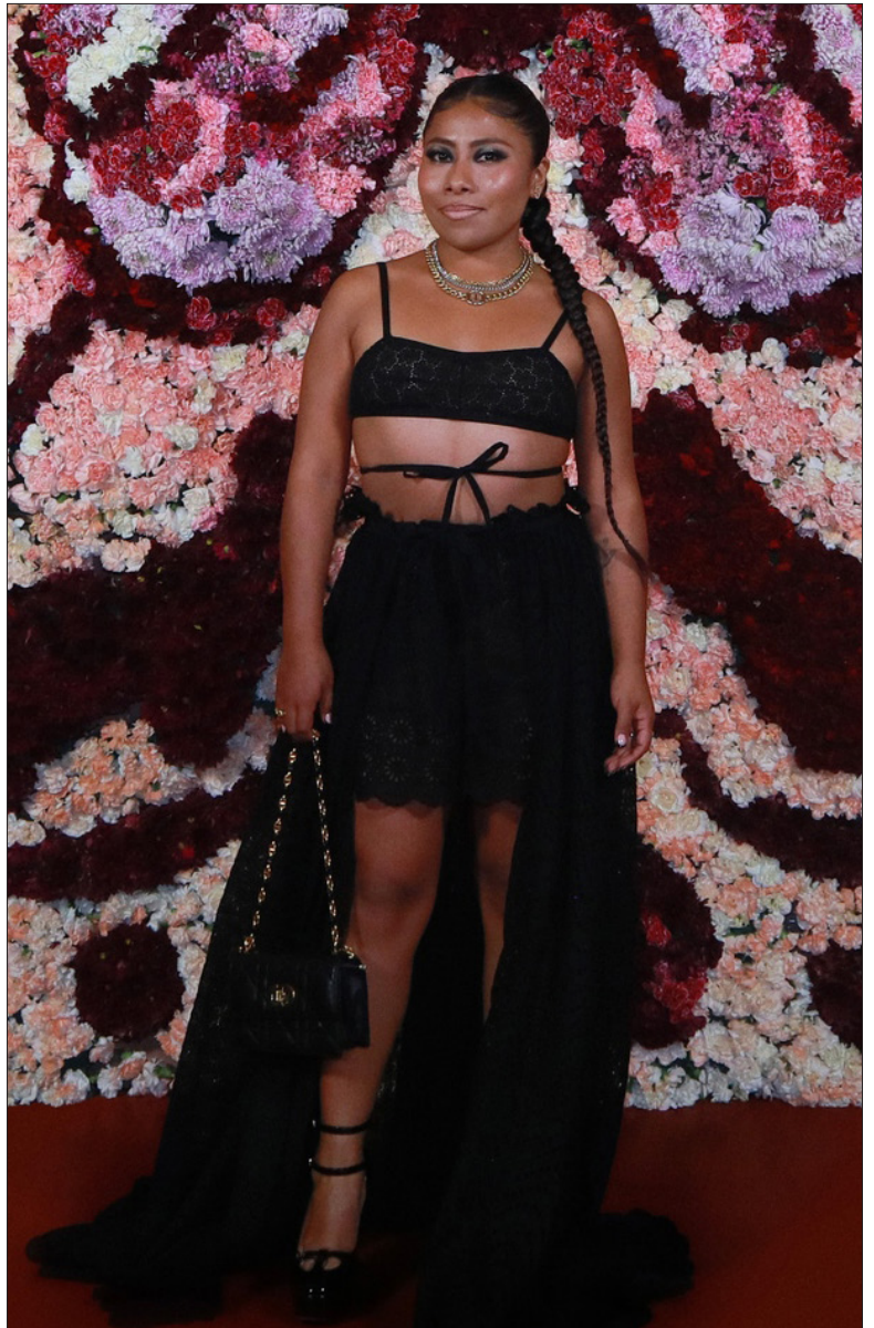
▲ La imagen de la discordia

*Licenciada en Administración de Empresas, ex atleta de elite, y mi verdadera pasión es contar historias (lo que se conoce vulgarmente como «echar chal») Instagram @curvyzilla