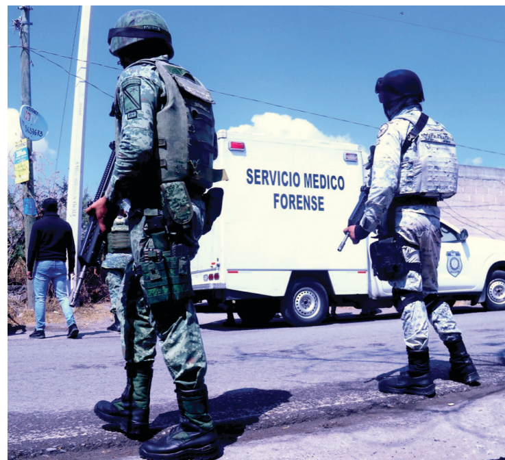
▲ Los ciudadanos consideran que no se ve el impacto de las tareas del ejército ni de la Guardia Nacional en Morelos. No se ha logrado disminuir la criminalidad.