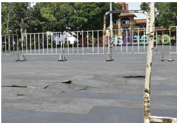
▲ Hasta no esclarecer las causas del levantamiento de losas, se prohibirá el acceso al público a la Plaza de Armas.

El 15 de septiembre del 2016, el entonces gobernador, Graco Ramírez, inauguró la rehabilitación de este espacio público, cuyo costo ascendió a 49 millones de pesos y formó parte del proyecto integral del rescate del Centro Histórico de Cuernavaca, también conocido como la Ecozona.