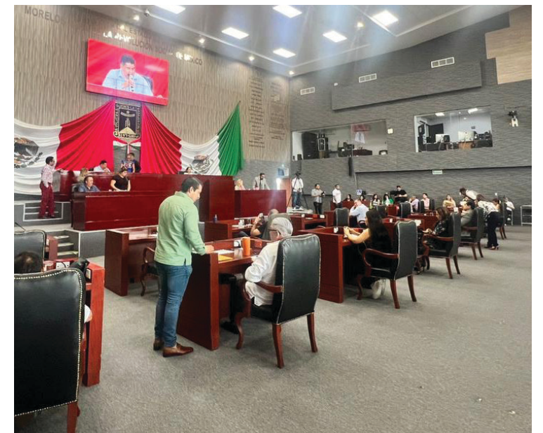
▲ Devolvió el Legislativo los dictámenes correspondientes para su publicación en el Periódico Oficial “Tierra y Libertad”.