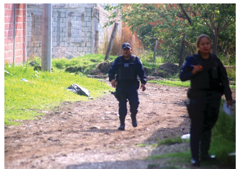
▲ Con prestaciones y premios se busca incentivar a los policías municipales en Cuernavaca.

"En Cuernavaca estamos generando una serie de premios a los elementos policiacos a través de incentivos principalmente en productividad y puntualidad, esto es un trabajo loable pero también bueno para nuestras fuerzas policiacas".