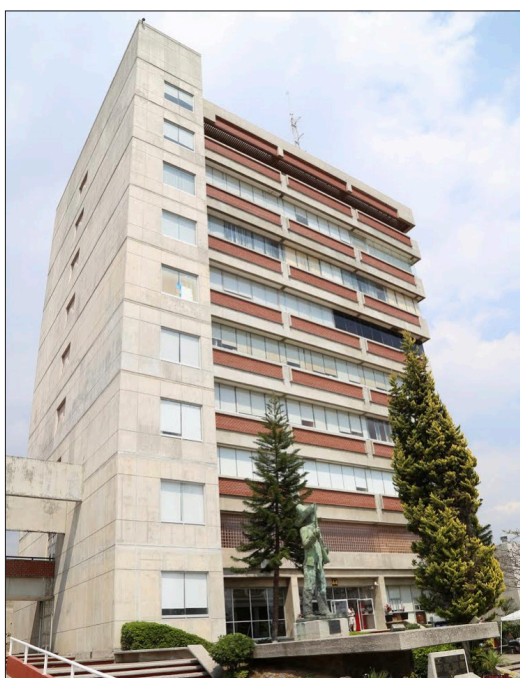
▲ La construcción del nuevo comedor universitario concluiría en agosto.

Por último recomendó a los campesinos que aprovechen el apoyo que se realiza con dinero en efectivo para que compren sus productos que necesitan, “hacemos un paquete en base a lo que ellos quieren y piden”, señaló.