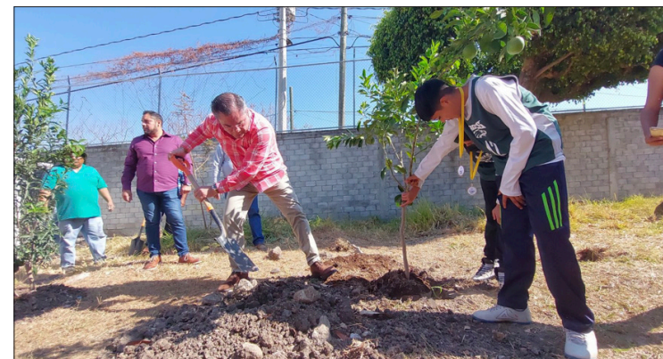
▲ Entre las acciones de preservación que lleva a cabo la administración municipal de Jiutepec destaca el programa de reforestación de árboles frutales en planteles educativos públicos.