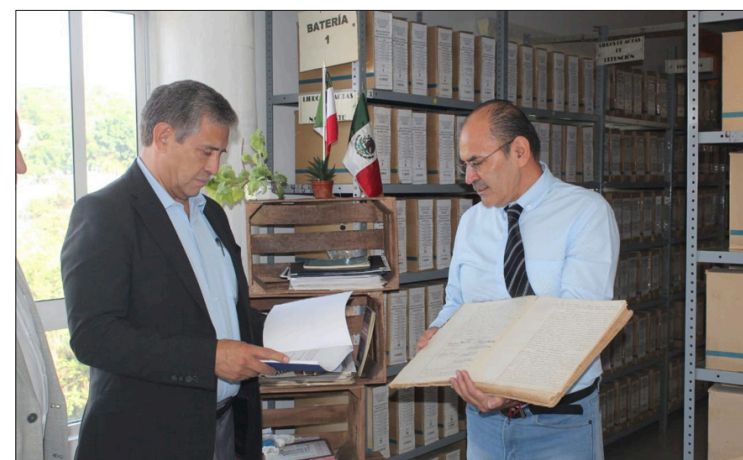
▲ El presidente municipal de Cuernavaca, José Luis Urióstegui, autorizó la disposición final del archivo muerto del Ayuntamiento que ya cumplió con su término de ley.