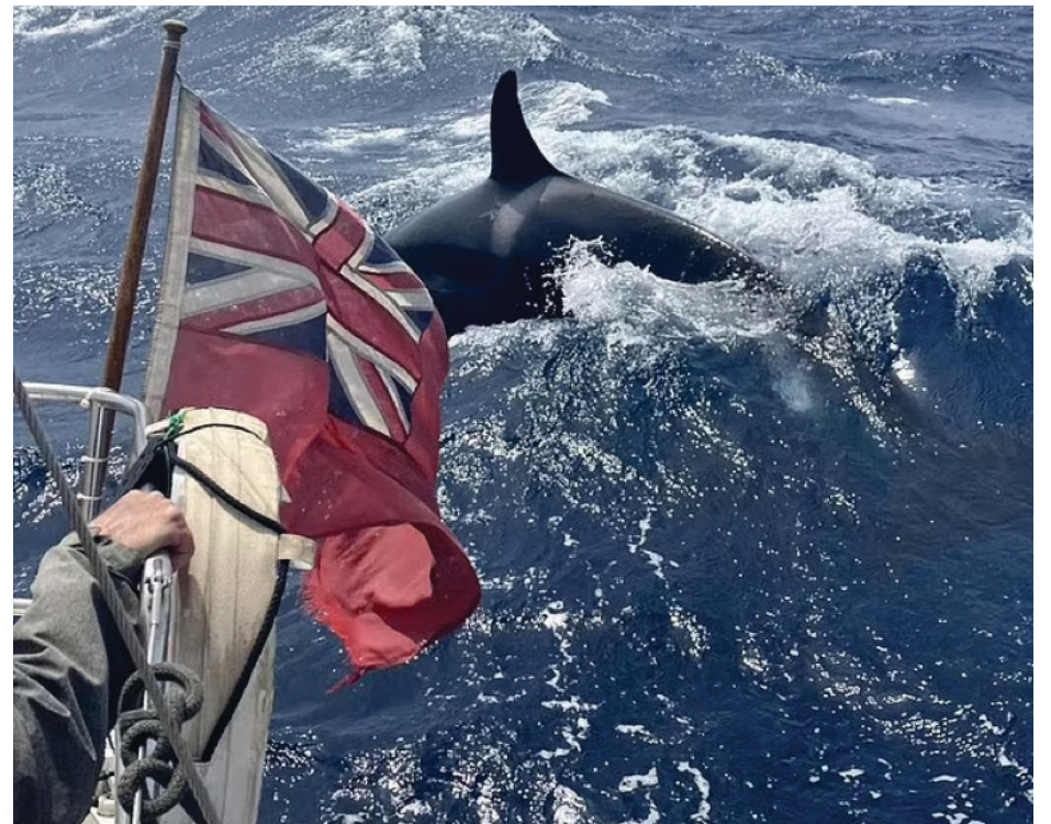
▲ Una de las Gladis rodeando un barco en el estrecho de Gibraltar

*Coordinador de la Unidad de Divulgación del Centro de Ciencias Genómicas de la UNAM y miembro de la Red Mexicana de Periodistas de Ciencia.