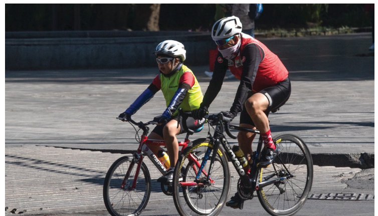
▲ Buscan los ciclistas reivindicar su derecho al tránsito libre y seguro de manera cotidiana; haca falta cultura cívica, lamentan.

Por último, anunció que continuaran con una Jornada de información para que la ciudadanía cobre conciencia de que los ciclistas tienen el derecho a transitar libre y seguros cuando usen su vehículo.