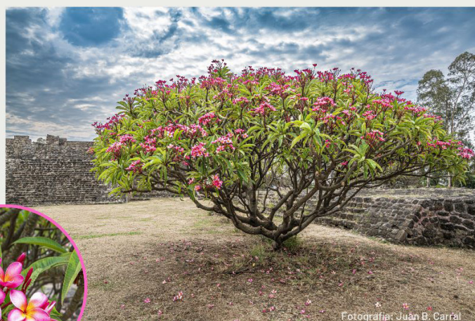
Flor de Mayo o Cacaloxóchitl ( Plumeria rubra )

Árboles de talla mediana y hojas gruesas. Sus flores poseen colores brillantes: rosa, amarillo, carmín y blanco, son muy aromáticas y tienen usos medicinales. Son originarios de México y Centroamérica, pero se les encuentra en áreas tropicales y subtropicales de varias regiones del mundo, además de que se han adaptado muy bien a las zonas urbanas. En nuestro país, se les puede observar en el Estado de Morelos y la ciudad de Cuernavaca.