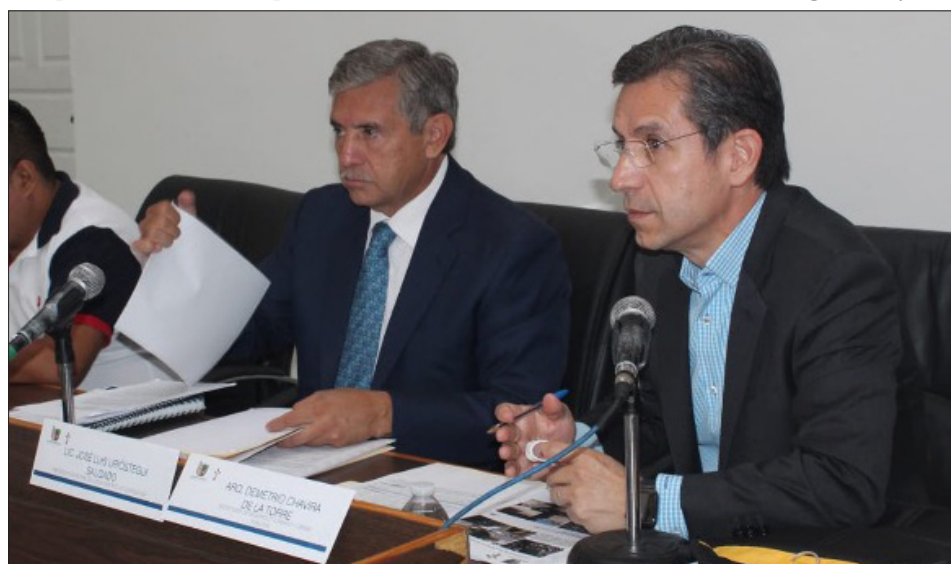
▲ El Comité de Obras Públicas de Cuernavaca autorizó la integración de 16 obras para atender las peticiones ciudadanas hechas en el Cabildo Abierto

En tanto con recursos propios incorporaron nueva obras, como la construcción de un muro de contención en calle Laurel de la colonia Club de Golf, dos estudios en la colonia Los Pilares, la rehabilitación del drenaje pluvial en calle El Caballito del poblado de Buena Vista del Monte, la rehabilitación de la rejilla pluvial en calle Boulevard Juárez de la colonia Miguel Hidalgo, la rehabilitación de estructura del puente vehicular- peatonal en calle de la Mina en la colonia Lagunilla y la