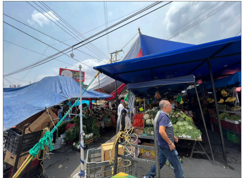
▲ Las ventas han bajado en los espacios que los locatarios han tenido que improvisar para continuar con sus actividades.

Actualmente, en las bardas y paredes, aun se observa el daño causado por las llamas que consumieron el "mercado nuevo" -como también era conocido. En sus alrededores, en las calles Ignacio Maya, No Reelección, Francisco I. Madero los comerciantes instalan sus puestos, pero las ventas no son las