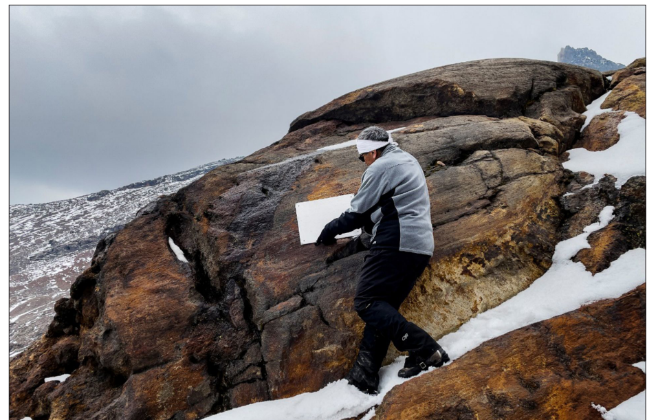
▲ Con una placa de acero colocada en lo que fue uno de los cuerpos de hielo permanentes de México, se declaró la extinción del glaciar Ayoloco, ubicado en la cumbre del volcán Iztaccíhuatl, cuya ausencia impacta en la disponibilidad de agua y regulación del clima.

Urge entender y atender esta amenaza que no está a la vuelta de la esquina, está ya presente. Urge que todos los países del mundo y en particular los que emiten más cantidad de gases con efecto invernadero, generen políticas y acciones para revertir este calentamiento. Es impostergable el actuar global, colectivo e individual. De no hacerlo el destino nos alcanzará y ese destino es el que heredaremos a las siguientes generaciones.