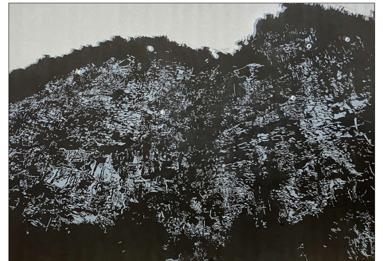
▲ 53 artistas contemporáneos donarán el 50 por ciento de la venta de sus piezas de arte, para que FUNBA implemente dos proyectos vitales para la conservación del Bosque de Agua.

El boleto se puede comprar en la página de www.funba.org , así como a la entrada del evento el viernes 23 de junio.