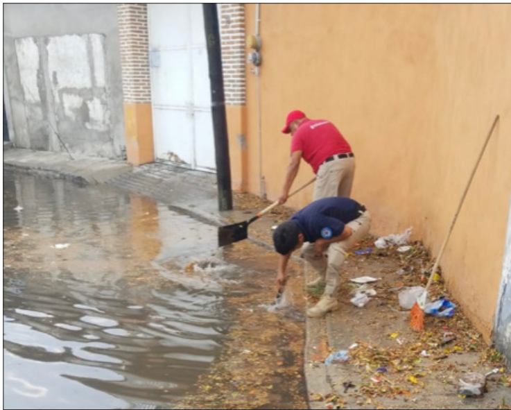
▲ La lluvia ya causó las primeras inundaciones y encharcamientos de consideración en el sur del estado.