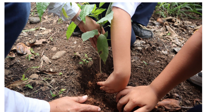
▲ Por lo menos 400 árboles serán sembrados en diversos campos de la comunidad de Tilzapotla, municipio de Puente de Ixtla, para contrarrestar la erosión, informaron autoridades municipales

Se van a plantar en diferentes campos, como: “Loma del Carro”, “Huajes”, “Bonetes”, “Pericón” y diversas especies que son “plantas adaptables para cualquier parte de la región sur de Morelos”.