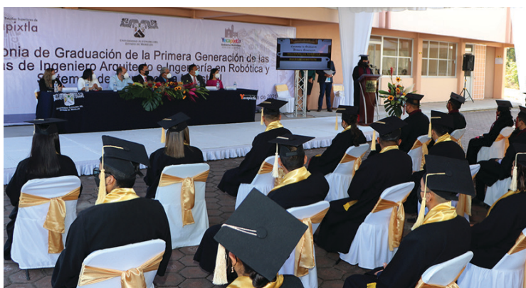
▲ Desperdiciar el agua, consumir bebidas embriagantes y usar pirotecnia está prohibido en las celebraciones de fin de cursos y graduaciones que se realizan en las instalaciones de la UAEM.

Informó que este tipo de eventos de graduación se han permitido después de la pandemia por COVID-19 con la finalidad de reintegrar a los estudiantes a sus actividades normales.