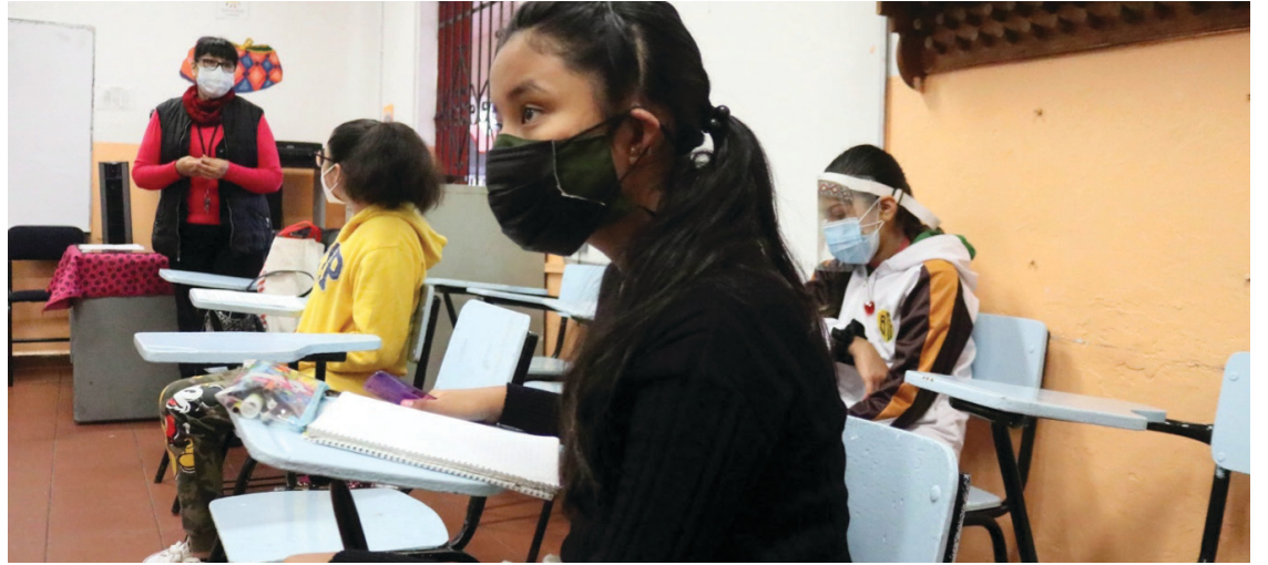
▲ Ninguna escuela podrá condicionar la entrega de la documentación de los alumnos por falta de pago de cuotas, que siempre se deben considerar voluntarias como apoyo de los padres de familia para el mantenimiento de los planteles en los que estudian sus hijos, explicó el IEBEM.

Señaló que la legislación de Morelos establece que es obligación de quienes ejerzan la patria potestad o tutela de los niños o niñas coadyuvar en la medida de sus posibilidades con las autoridades educativas en la construcción, mantenimiento y mejoramiento de los planteles educativos, pero de forma voluntaria y sin establecer cuotas escolares obligatorias.