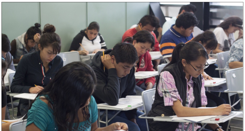
▲ La UAEM recibirá a 3 mil 700 de los más de 4 mil 500 aspirantes al nivel medio superior y a la Escuela de Técnicos Laboratoristas

Todos los resultados se darán a conocer este próximo nueve de abril en la página oficial de la Universidad Autónoma del Estado de Morelos. www.uaem.mx