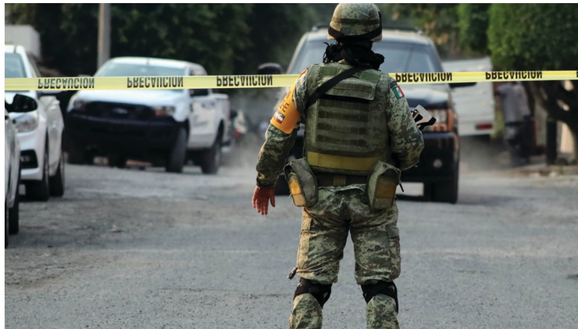
▲ La Comisión de Derechos Humanos de Morelos señala que, aunque la criminalidad no comenzó en este sexenio, se ha hecho muy poco por atacarla. La estrategia de seguridad, afirma, es un fracaso.