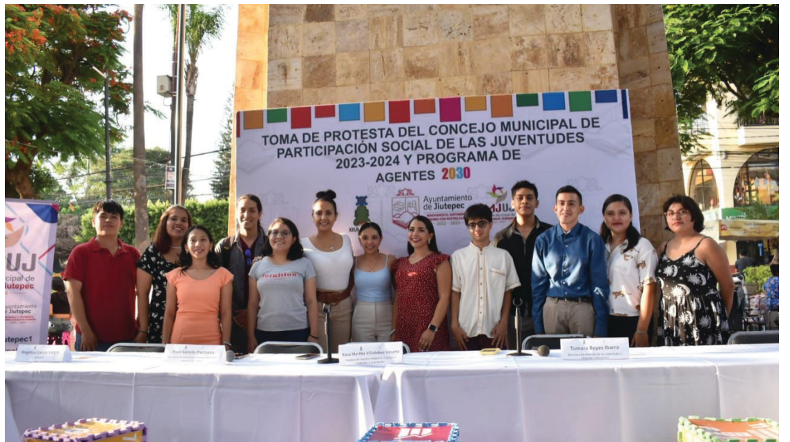
▲ El nuevo Concejo Municipal de Participación Social de las Juventudes de Jiutepec, apoyará al Instituto de las Juventudes del municipio con la formulación de proyectos y asesoría.