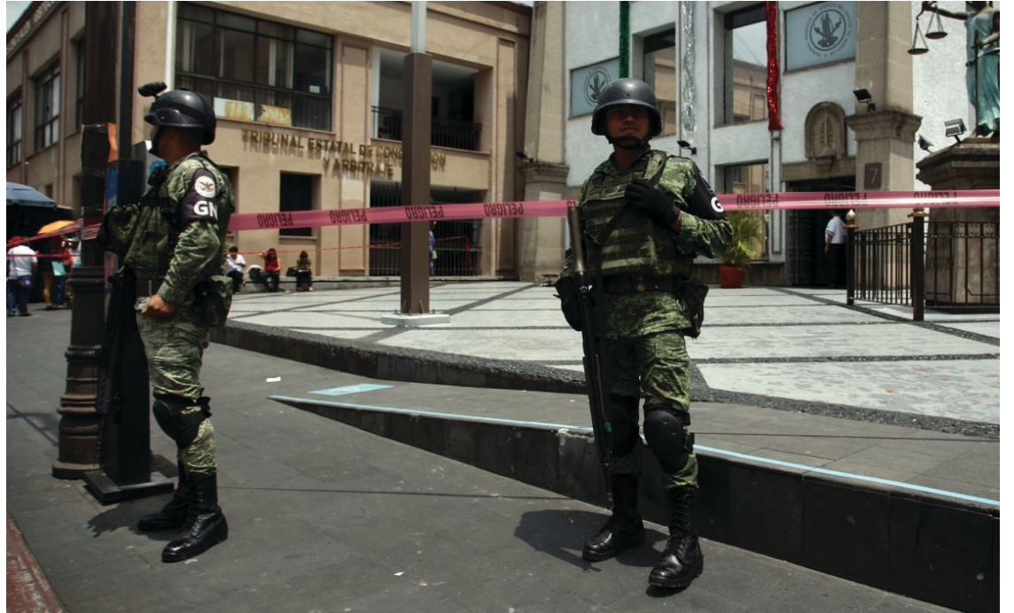
▲ Las falsas alarmas no solo distraen a los cuerpos de seguridad, también ponen en riesgo a la comunidad que evacúa los inmuebles, advierte Protección Civil.

Ante esta situación, exhortó a la ciudadanía abstenerse de hacer llamadas falsas al 911 para evitar la movilización de las unidades de emergencia.