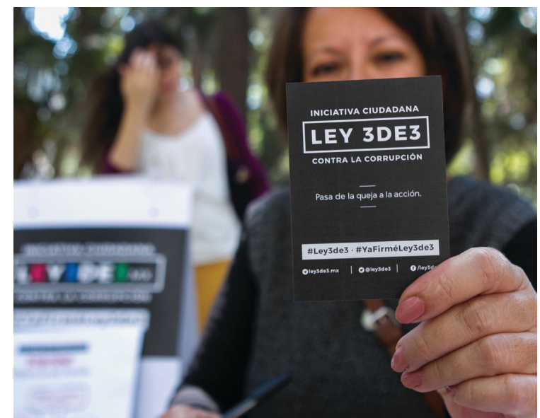
▲ El colectivo Las Constituyentes advirtió que el IMPEPAC debería establecer mecanismos para garantizar el cumplimiento de la nueva ley 3 de 3.

La Ley 3 de 3, por primera vez será aplicada en el proceso electoral del 2024, y su objetivo primordial es evitar que agresores lleguen a los cargos de poder, incurriendo en omisiones, obligaciones e incluso seguir generando violencia en contra de las mujeres.