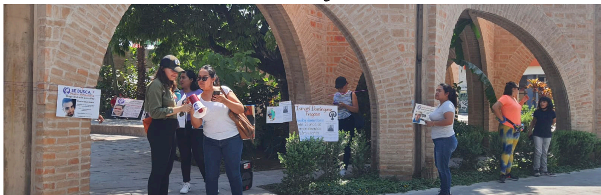
▲ En Jojutla protestaron contra los deudores alimentarios; las asistentes señalan que si los deudores quieren celebrar el Día del Padre, antes deberían pagar las pensiones que les corresponden.