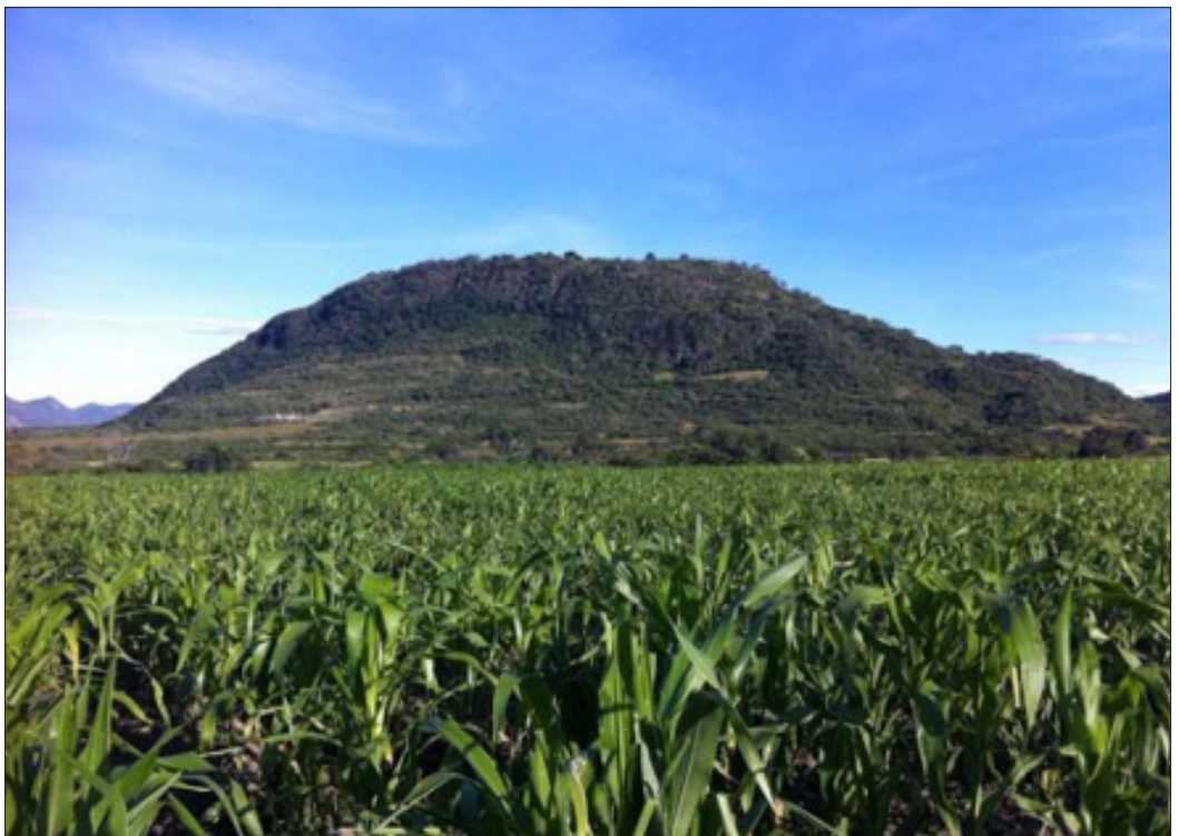
▲ El municipio cañero pretende regularizar el nuevo asentamiento como parte de su jurisdicción, independientemente del origen de sus habitantes.

"Ya se hizo una invitación al municipio de Xoxocotla, sin embargo, no acudieron a la reunión que ya estaba agendada. Entonces, ya estamos reprogramando otra donde participarían las comisiones de límites territoriales de ambos municipios y estaría presente el Registro Agrario Nacional", concluyó.