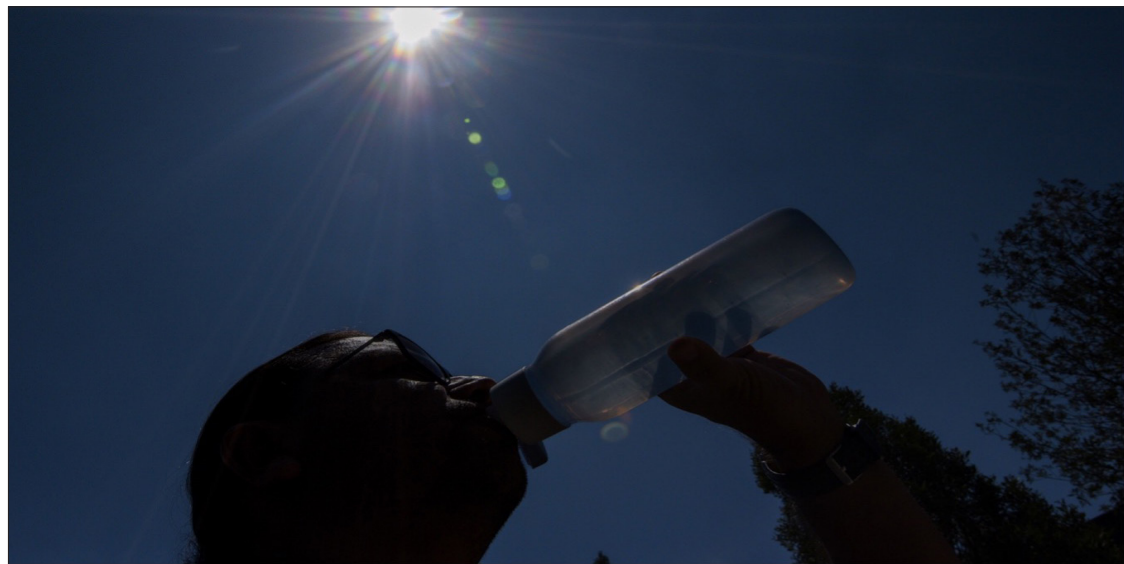
▲ Ya van 25 universitarios que han tenido que ser atendidos por golpes de calor, sobre todo después de hacer deporte bajo el rayo del sol.