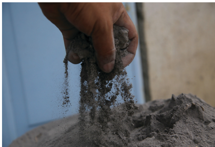
▲ Las autoridades advierten que mientras más pequeñas sean las partículas de ceniza, más lejos viajan y podrían afectar la calidad del aire, por lo que recomiendan usar cubrebocas y evitar ejercitarse al aire libre en tanto los vientos traigan a Morelos la ceniza del Popo.

Por lo anterior, Mercado Salcedo descartó por ahora la suspensión de clases por la caída de ceniza, sin embargo, aseguró se les recomendó a los planteles educativos evitar actividades al aire libre para garantizar la seguridad de las niñas, niños y adolescentes.