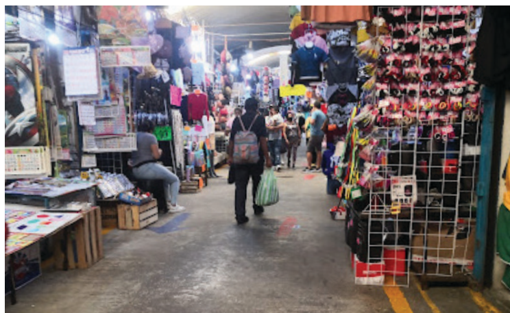
▲ Aunque Protección Civil considera que el “Puente del Dragón” debería permanecer cerrado hasta que solucionen sus problemas de infraestructura, la última palabra la tendrá la administración del mercado, por lo pronto “es un riesgo para los comerciantes y para los clientes”.