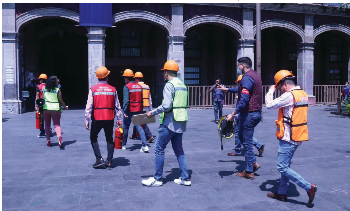
▲ Continúan los estudios en la Plaza de Armas de Cuernavaca, pero se prevé que ésta permanecerá cerrada por varias semanas más; la ceremonia del aniversario de la independencia, en septiembre, podría tener que efectuarse en otro lugar.

Agregó que “a simple vista se ve un desprendimiento, pero no queremos reparar sólo esa zona; de acuerdo con lo que revelen los dictámenes, hablaríamos de una remodelación total, porque no podemos solo reparar el espacio afectado y dejar que otros desprendimientos ocurran”, concluyó.