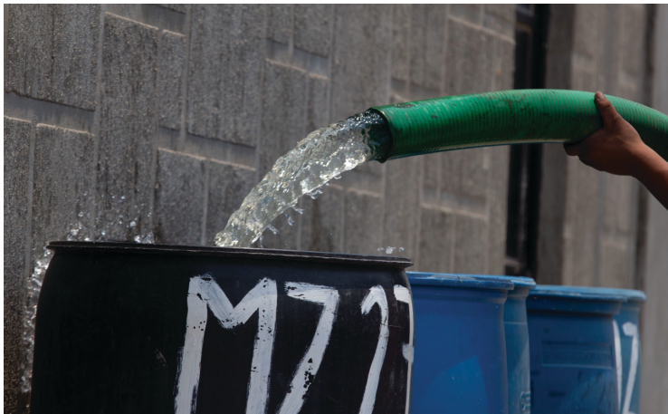
▲ La CONAGUA invitó a los municipios de Morelos a operar las medidas preventivas de sequía, por lo que los tandeos se reducirán; el SAPAC sugiere almacenar agua y hacer un uso responsable de esta.