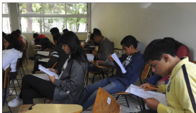
▲ 89 jóvenes que habían adquirido su ficha no asistieron al examen de ingreso del medio superior, aunque esto podría deberse a que ya hicieron un trámite en otras escuelas, comentaron las autoridades universitarias.

Los resultados se darán a conocer el día 9 de julio en la página oficial de la Universidad Autónoma del Estado de Morelos www.uaem.mx