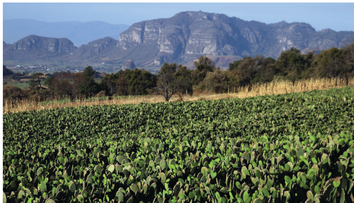
▲ El crecimiento de las unidades productivas en el agro morelense se debe principalmente a la modificación del tipo de siembra.