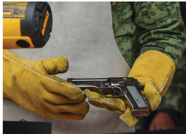
▲ El programa de canje de armas en Cuernavaca ya logró rescatar, tan solo en Santa María Ahuacatlán, cinco armas, nueve granadas y 100 cartuchos, entre otros artefactos. El programa continuará hasta el 23 de junio.

En esa demarcación, el pasado fin de semana, se reportó el hallazgo de bolsas negras, en cuyo interior se encontraban restos humanos a un costado de la carretera federal México-Cuernavaca; además de una cartulina verde con un mensaje.