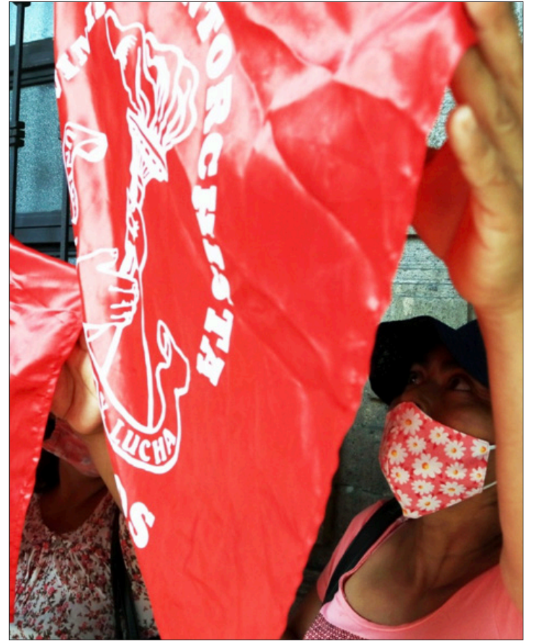
▲ Por múltiples demandas que no se han atendido por el gobierno del estado, como construcción de escuelas y apoyo a los agricultores de los altos de Morelos, los Antorchistas se manifestarán en Cuernavaca el próximo miércoles.

Para el sector agrario exigen al Ejecutivo que se beneficie a más de cuatro mil campesinos y pe-