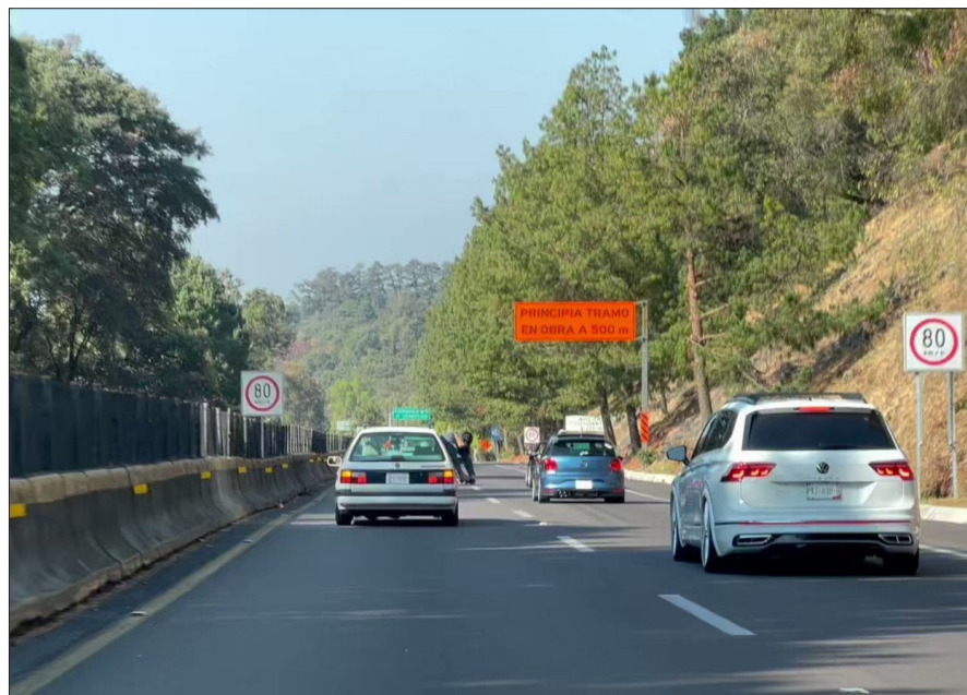
◀ Según la Cámara Nacional de la Industria de la Construcción, la autopista México-Cuernavaca presenta deterioro y las autoridades no dan señales de intentar darle mantenimiento.