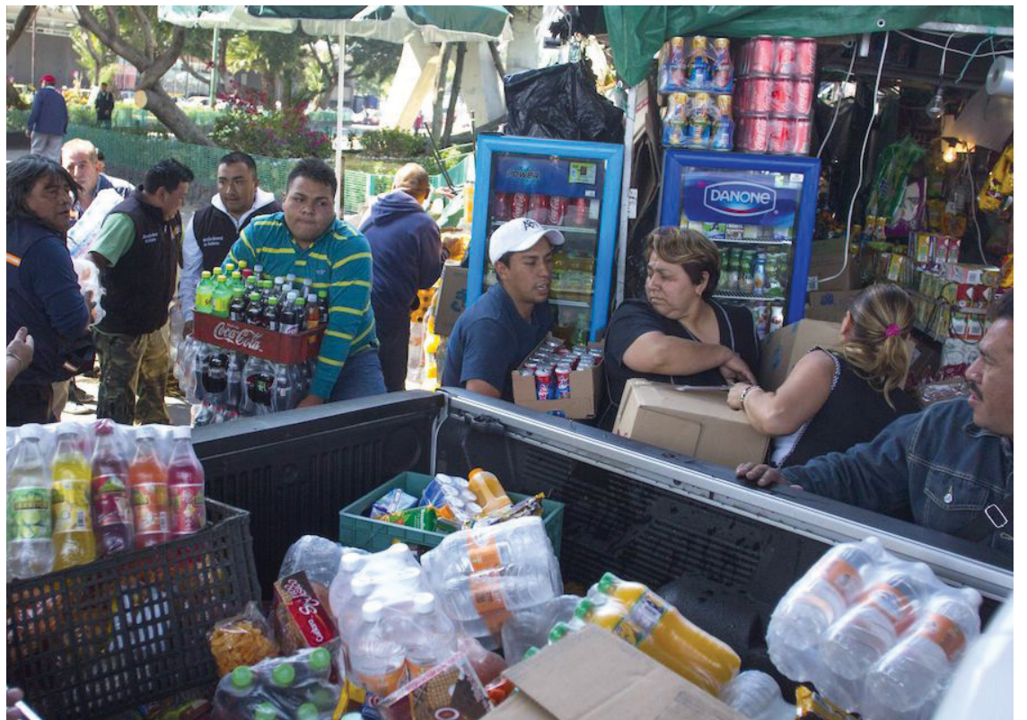
▲ El Cabildo de Cuernavaca autorizó otorgar una prórroga hasta el 15 de julio de 2023 para el pago a los comerciantes que hayan ingresado sus documentos en los tiempos establecidos.