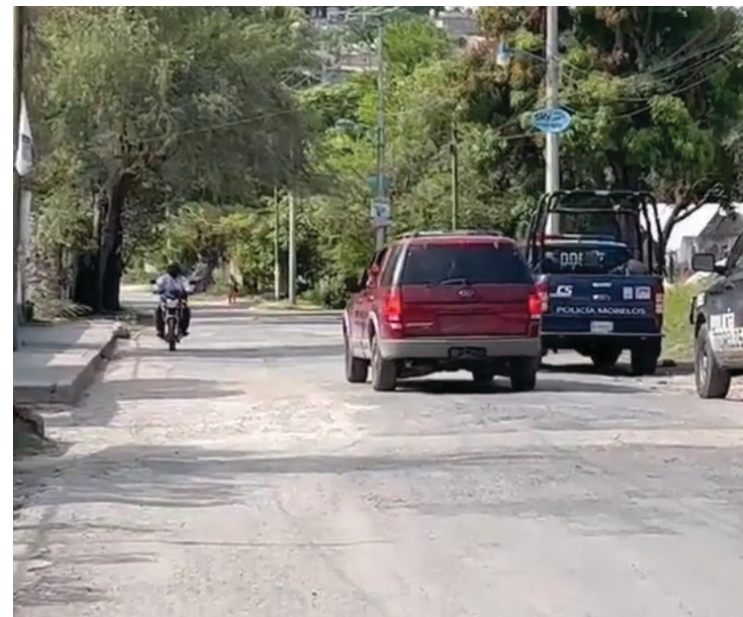
▲ En el municipio de Emiliano Zapata se ha incrementado el robo de vehículos, el más reciente, el de un profesor a quien secuestraron momentáneamente para robarle su camioneta.

“Hasta el momento tenemos un alza en los delitos de robo de automóvil y de motocicletas, sin embargo hemos tenido resultados pues, recientemente logramos la detención de dos personas que se dedicaban a robar vehículos”, explicó.