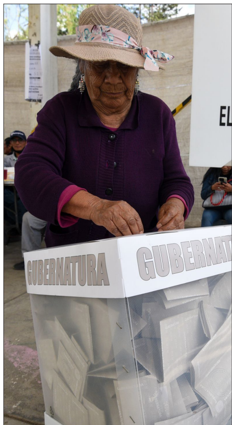
▲ Una democracia es el único sistema de gobierno que permite votar y elegir a sus representantes libremente.