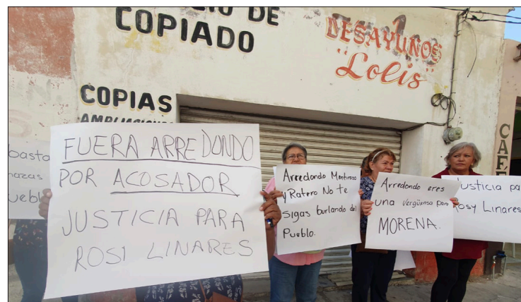
▲ Un grupo de extrabajadores del municipio de Cuautla acusaron al presidente municipal de despedir a los trabajadores sin justificación; decidieron recurrir a las instancias federales porque sus gestiones no avanzan en el estado.

“Nosotros ya tuvimos que recurrir a las instancias federales porque el TECA no da solución a nuestro favor, aunque hicimos todo lo que nos dijeron, pero nos dimos cuenta de que ellos recibían sólo órdenes. El gobernador lo protege y el presidente del TECA hace lo que ellos le dicen. Hay mucho abuso de poder y por eso lo vemos ahí tan campante intimidando porque a los compañeros que siguen trabajando los tienen amenazados para no apoyarnos”, concluyó.