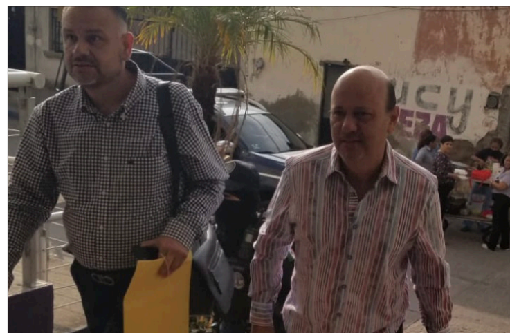
▲ Protegido por todo un aparato de seguridad, el Presidente Municipal de Cuautla arribó a la audiencia en la que se desahogan las acusaciones en su contra por actos intimidatorios y de hostigamiento, sin embargo, la Fiscalía Anticorrupción se desistió de la imputación “para fortalecer el caso”.