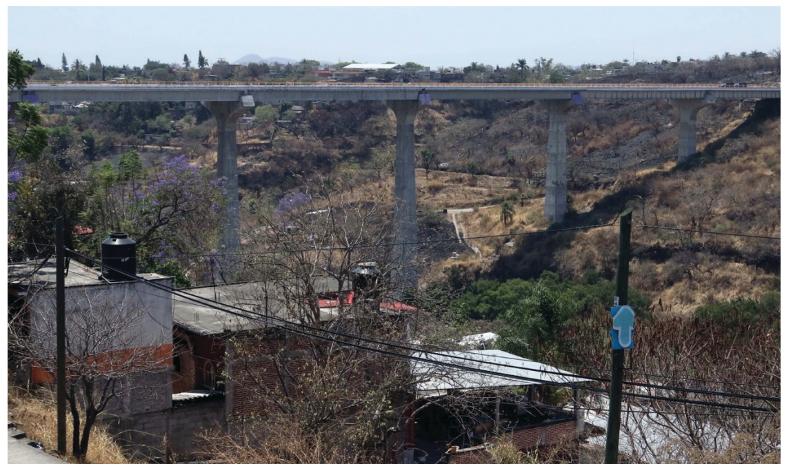
▲ En atención a la oferta presidencial de continuar los trabajos del complejo habitacional en la zona del “puente sin fin”, Cuernavaca podría colaborar con la autorización del uso de suelo, pero no se ha formalizado ninguna solicitud, comentó el edil cuernavacense.

“Ese es el proyecto que se planteó hace como 15 años por Casas Geo que eran como 100 mil viviendas proyectadas y me parece que solo se construyeron alrededor de 20 mil en el municipio de Temixco y algunas más en Cuernavaca, pero toda esta obra quedó interrumpida por los propietarios y se detuvo el desarrollo inmobiliario”.