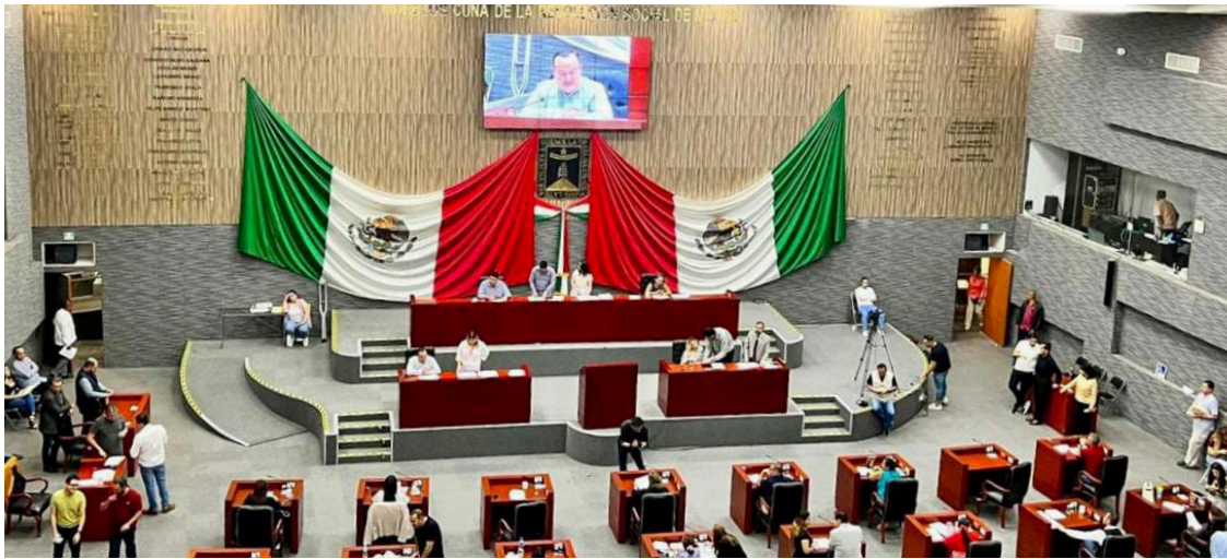
▲ Los legisladores aceptaron parcialmente las observaciones y aclaran diversos puntos que avalan la procedencia del decreto.