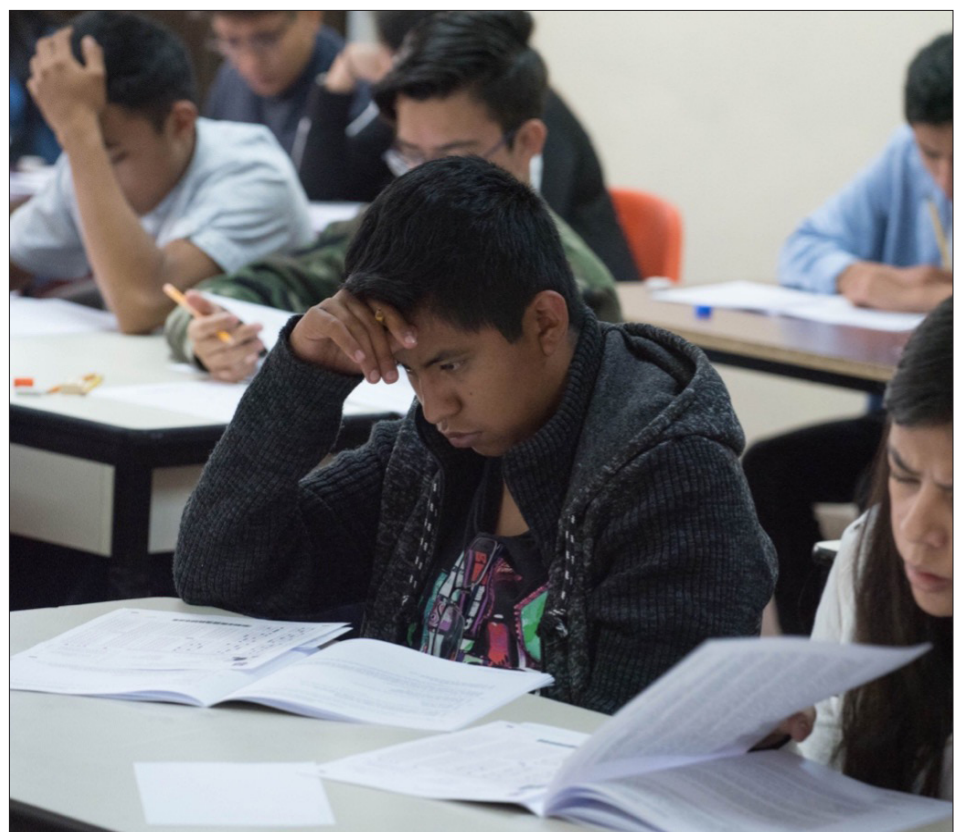
▲ Los aspirantes que no sean aceptados para ingresar al nivel licenciatura de la UAEM aún pueden optar por una carrera mediante el proceso de reasignación que iniciará el próximo martes.

Indicó que en las condiciones actuales, en caso de alguna emergencia, podrían tardar hasta cinco horas para salir, por lo que resulta necesario generar una nueva vía de comunicación con la que se tiene como objetivo brindar un mejor acceso a la Universidad desde la autopista México-Cuernavaca, que permitirá mayor fluidez del tránsito, en beneficio también de las colonias colindantes al campus universitario.