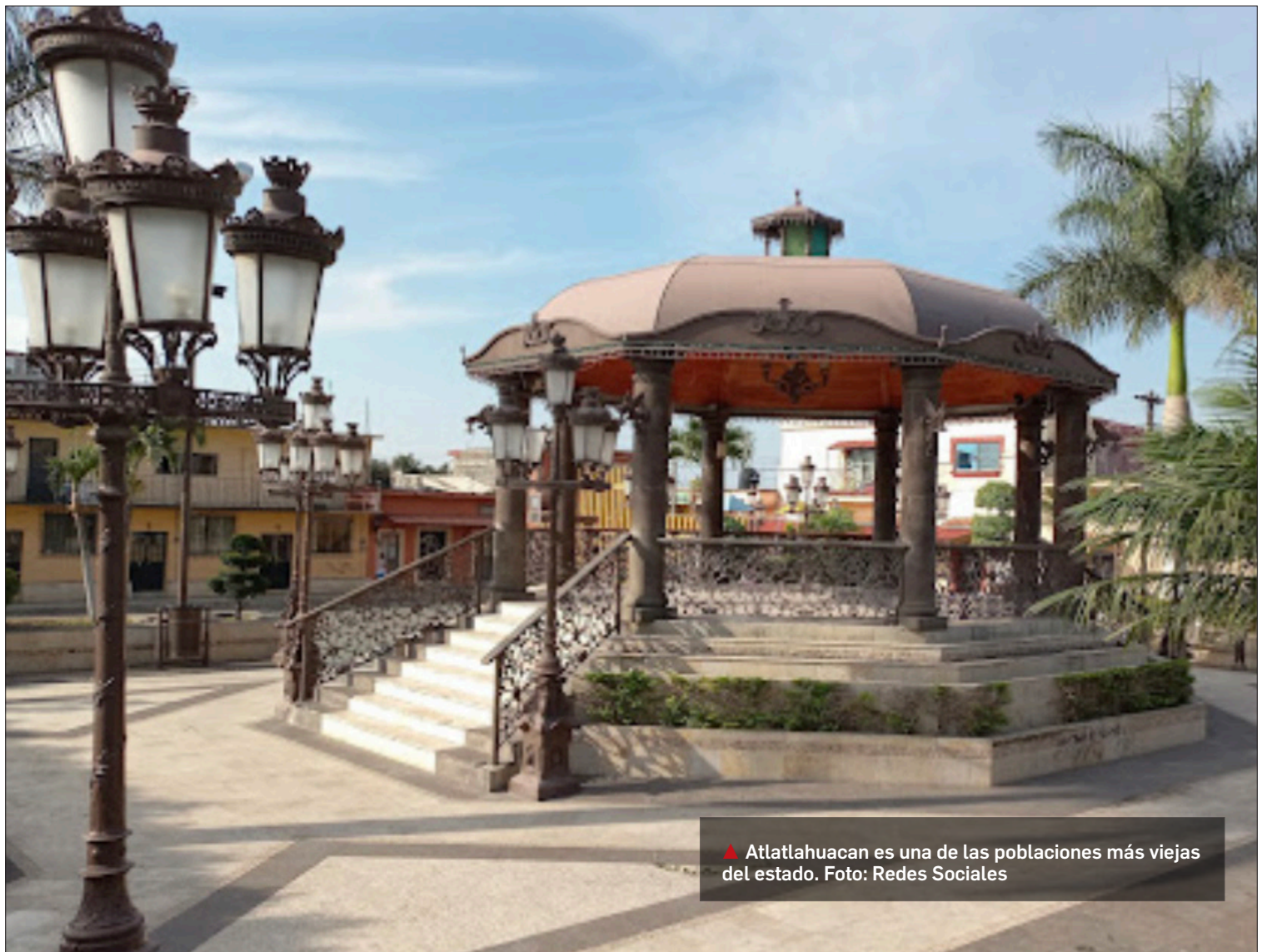
▲ Atlatlahucan es una de las poblaciones más viejas del estado.

"Nosotros como administración del Mercado hicimos una revisión con el personal con el que contamos, de primera mano, y ya Protección Civil hará los dictámenes que correspondan para tener zonas con toda seguridad; mientras tanto los comerciantes siguen trabajando", abundó.