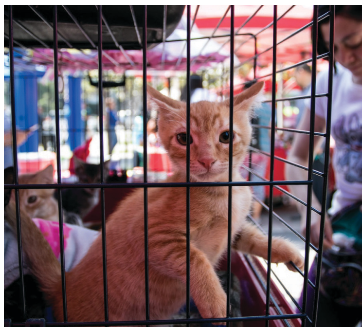
▲ El ayuntamiento de Cuernavaca mejorará las condiciones en las que se resguardan los animales de compañía rescatados pues el espacio en el que se ubican ha resultado afectado por las recientes lluvias.

Invitó a la ciudadanía a que acudan y verifiquen las condiciones de los caninos ya que tienen jaulas con concreto y el área de convivencia tiene una malla, espacio que señalaron los animalistas estaba en pésimas condiciones.