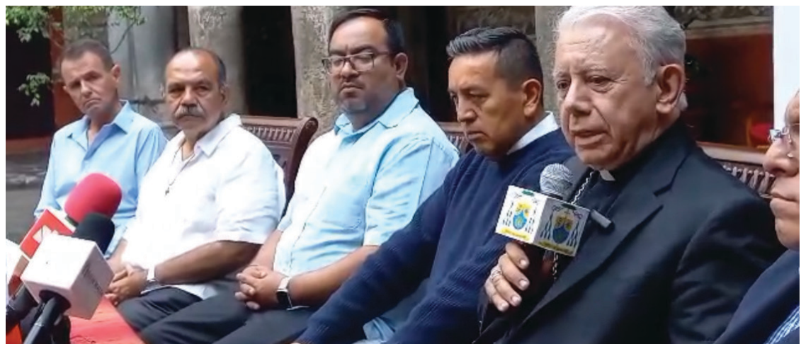
▲ El obispo de Cuernavaca anunció que al término de la novena Caminata por la Paz, el próximo 15 de julio, se presentará un programa de alternativas para construir la paz en Morelos y en todo México.