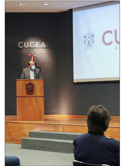
▲ Actividad del Instituto de Investigación en Rendición de Cuentas y Combate a la Corrupción.

Esta es una de las historias con la que nos encontramos frecuentemente en va-