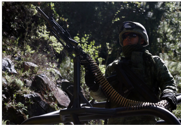
▲ En coordinación con la Federación, los gobiernos de la Ciudad de México y Morelos buscan combatir las actividades ilegales en Topilejo y Huitzilac.

"Hay algunos objetivos, no solamente por cuanto hace a la tala, sino otro tipo de actividades ilícitas. Se tienen por ahí algunos objetivos. Precisamente se van a realizar ciertas acciones. Creo que sería muy apresurado dar algunos datos en relación con lo que se va a realizar".