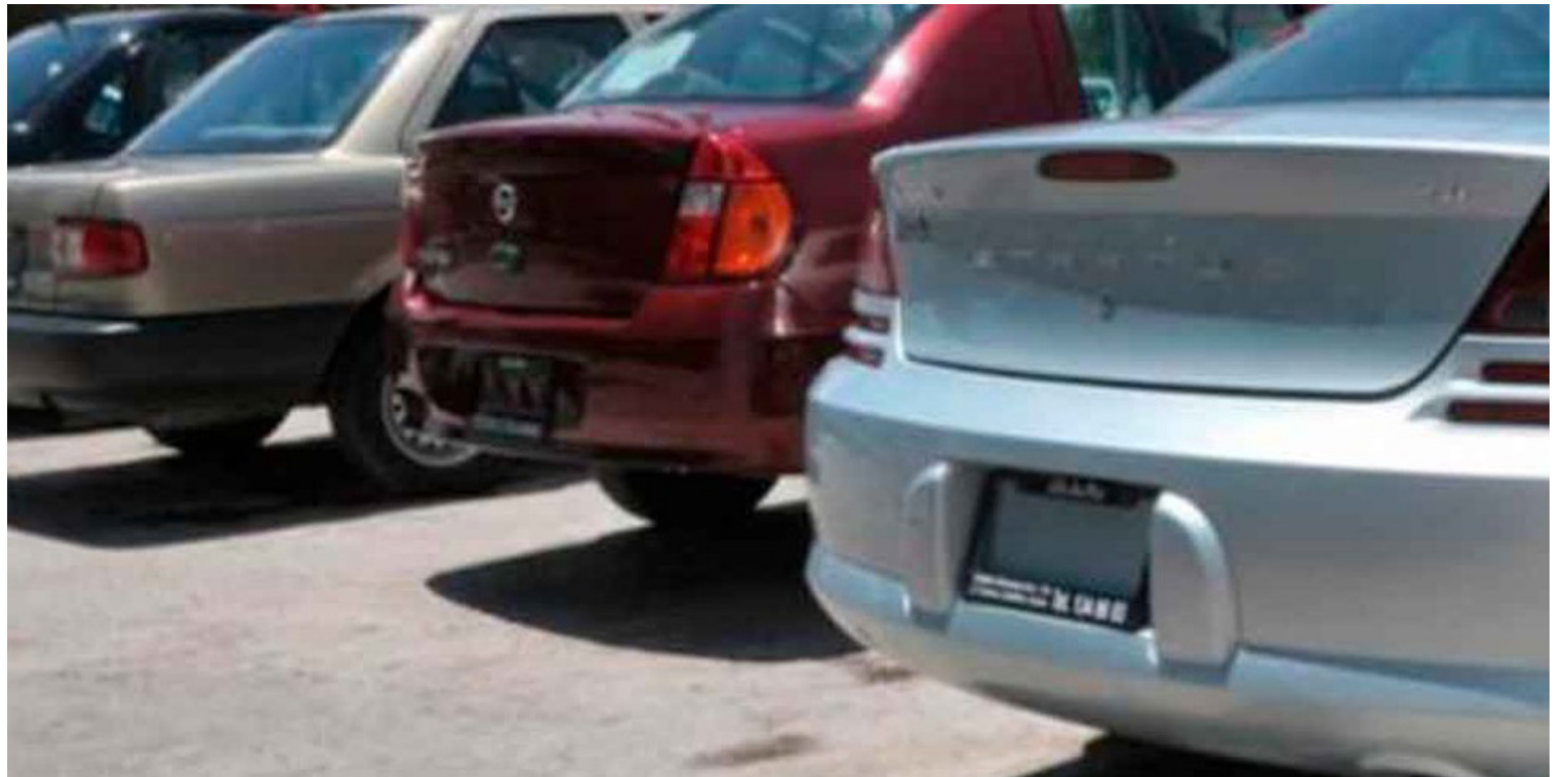
▲ La expedición de placas para autos nuevos y de tarjetas de circulación para cambios de propietario son los trámites que afectan a los miembros del CCE