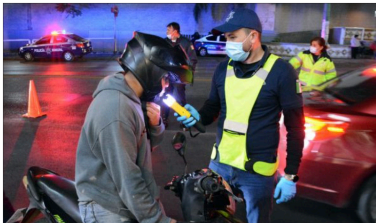
◀ Si la infracción está mal fundada o motivada, el ciudadano podría recibir incluso el dinero que ya haya pagado de multa, advierte el TJA.