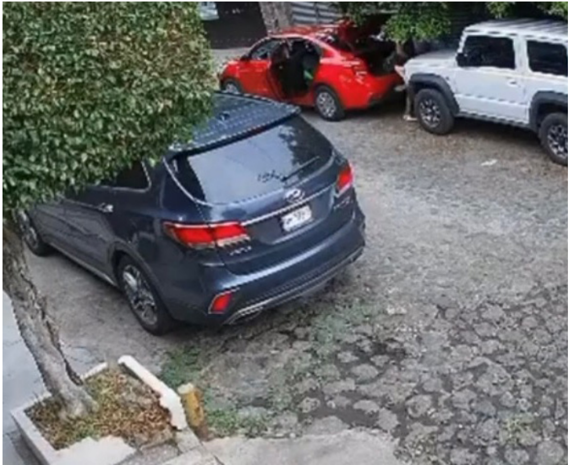
▲ La banda de ladrones de autopartes se detectó en Cuernavaca pero también se les ha ubicado en Acapantzingo.

Fue el jueves cuando a través de las redes sociales se difundió un video de cámaras de vigilancia que captaron a los delincuentes, se presume operan en colonias como Lomas del Mirador y Volcanes; incluso, fueron vistos durante el fin de semana en Acapantzingo.