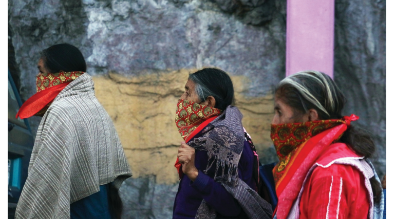
▲ Como no se cumplieron los plazos establecidos en la Constitución del estado, la iniciativa para respaldar la participación electoral de los pueblos originarios tendrá que esperar para poderse aplicar.

Por ahora solo resta seguir promoviendo e informar a los pueblos autóctonos de Morelos, cuáles son sus derechos electorales y seguir defendiendo el derecho de los pueblos y el reconocimiento propio de los candidatos de las comunidades originarias.