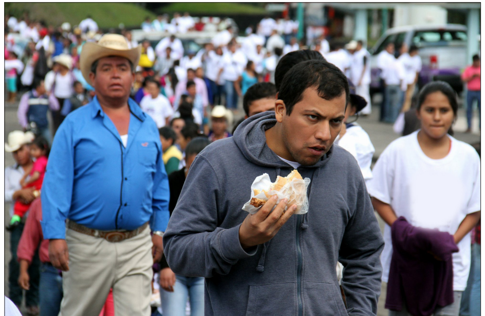
▲ La libertad y la democracia deben ser construidas “artesanalmente”.

Frente a esto, cómo construir un país a la medida de la gente, y no a la medida de