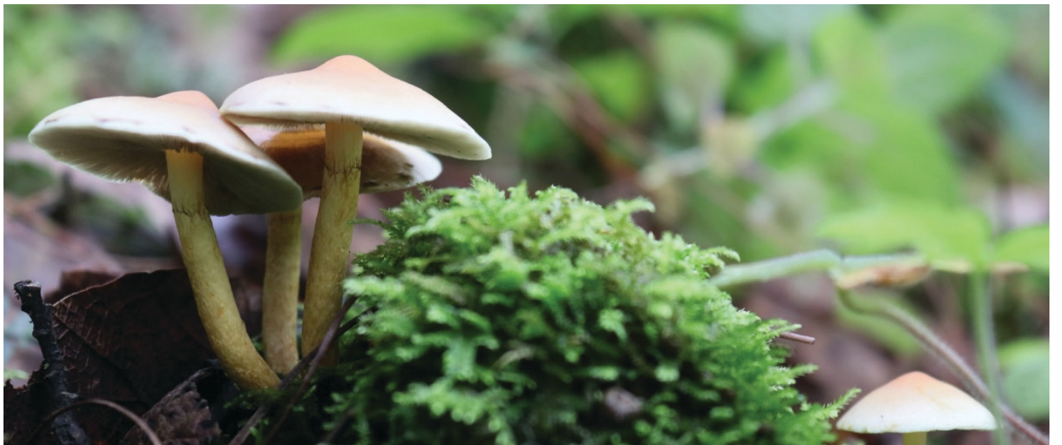
▲ La Primera Fiesta del Hongo Morelos 2023, se realizará el próximo 19 de agosto en San Juan Tlacotenco, Tepoztlán.

El objetivo de la fiesta es contribuir a la valoración del patrimonio biocultural de la comunidad, así como sentar las bases de un proyecto de etnomicoturismo, con la asesoría de expertos por lo que también se contará con la participación del Centro de Investigaciones Biológicas (CIB) de la Universidad Autónoma del Estado de Morelos (UAEM).