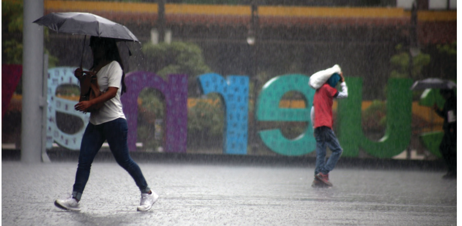
▲ Las recientes lluvias tiraron 21 árboles y cinco postes, las autoridades llaman a la población a evitar zonas de riesgo durante las precipitaciones.

"En este año hemos separado a tres elementos y se ha sancionado a unos 20 efectivos que no se presentan en tiempo y forma, sin el uniforme adecuado ni el chaleco antibalas. También hay muchas inconformidades a través de redes sociales y hasta quejas por abuso de autoridad" que serán investigadas en su totalidad, dijo.