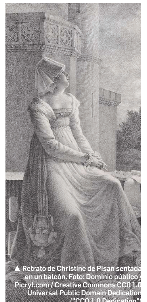
▲ Retrato de Christine de Pisan sentada en un balcón.