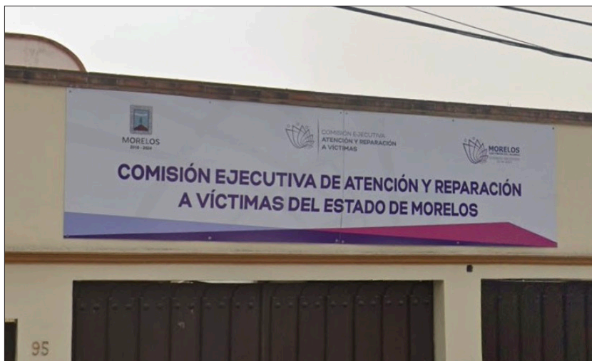
◀ La Comisión Estatal de Atención y Reparación del daño a Víctimas de la Violencia busca revertir el rezago que presenta en la atención de casos, mediante nuevas reglas de operación más cercanas a la realidad que viven los beneficiarios.

“Avanzamos a pasos agigantados, pero debemos reconocer que no hemos logrado atender ni a la mitad de los rezagados, pero buscamos dar una pronta solución”, concluyó.