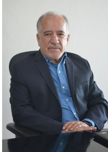
▲ El rector de la UAEM confía que el Congreso logre el consenso para autorizar la ampliación al presupuesto universitario.

“Yo veo muy buena disposición de los diputados y nada más es cuestión que se pongan de acuerdo entre ellos, tanto del bloque de los 15, como de los cinco restantes, pero hay buen consenso. Sus conflictos internos no creo que nos afecte porque la Universidad podría ser mediadora para que lleguemos a acuerdos”, concluyó.