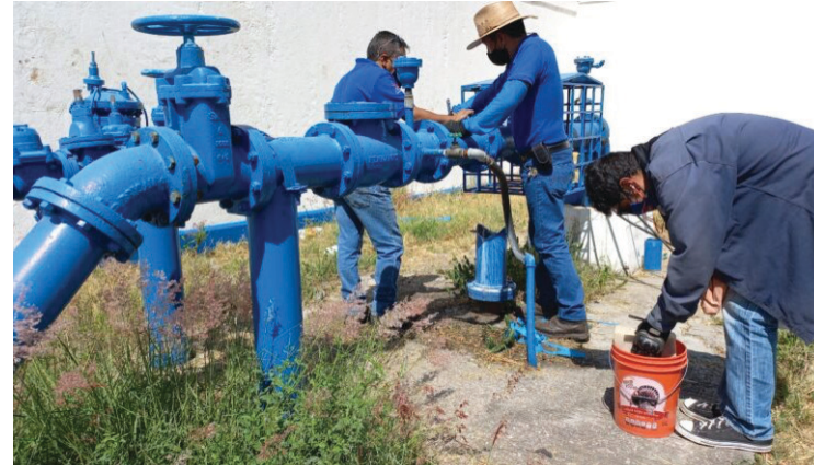
▲ Las acciones comenzarán el miércoles 12 de julio en las fuentes de abastecimiento Delicias Privada, Tres Cruces y Tetela de Monte, se estima una recuperación promedio del 25 por ciento del caudal en beneficio de cerca de 20 mil habitantes.

Finalmente, la Directora general del SAPAC, informó que, durante esta primera etapa, las colonias Delicias, Ampliación Los Ramos y el poblado de Tetela del Monte, son las colonias donde será interrumpido el abastecimiento de agua del 12 al 19 de julio.