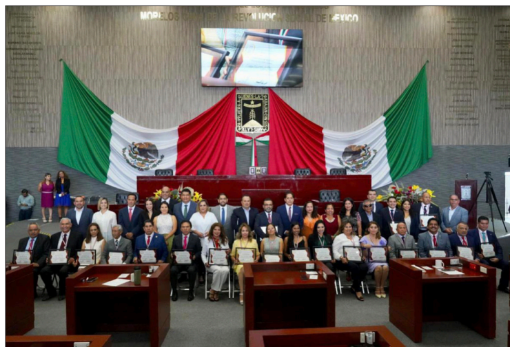
▲ El galardón fue entregado a quienes se destacan por su labor en el servicio público, la academia, la libre postulación y las causas sociales.

Finalmente, a nombre de los galardonados, el abogado Ricardo