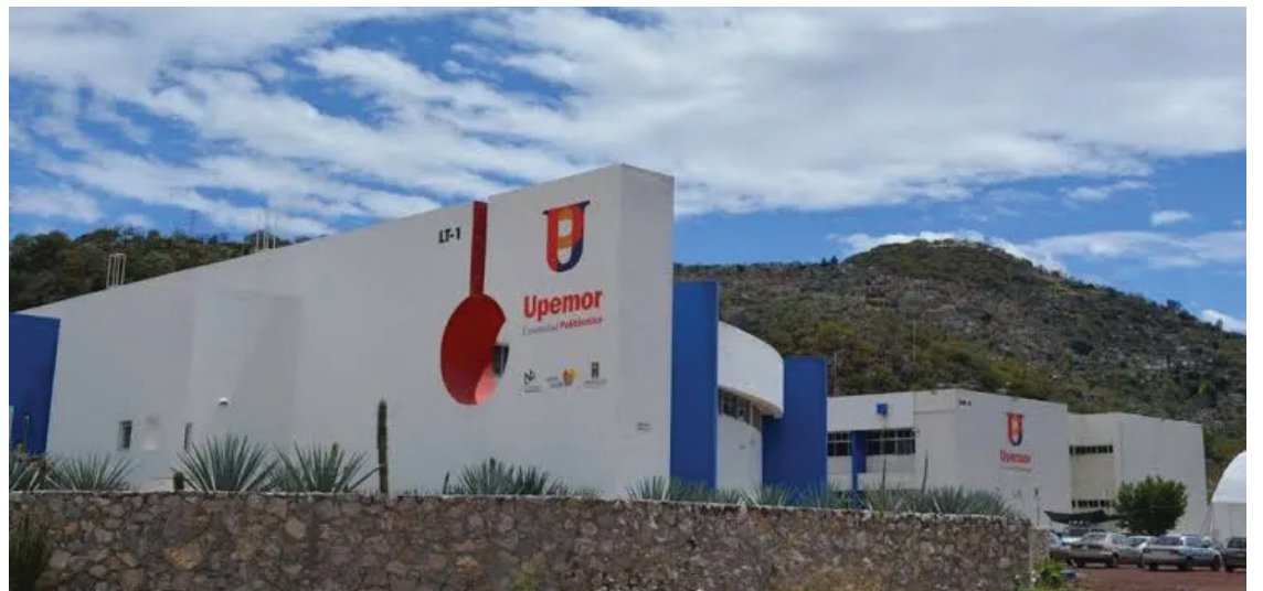
▲ La Universidad Politécnica del Estado de Morelos abrirá esta semana sus cursos propedéuticos para los aspirantes de nuevo ingreso.

Las inscripciones se llevarán a cabo el 25, 28, 29, 30 y 31 de agosto, según cada programa educativo, para iniciar el cuatrimestre en septiembre.