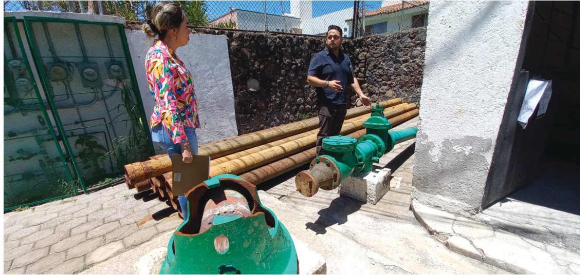
▲ Antes de iniciar los trabajos de rehabilitación, las dependencias del municipio, junto con las empresas a cargo de los proyectos, realizaron un reconocimiento en sitio de las obras que habrán de realizarse.