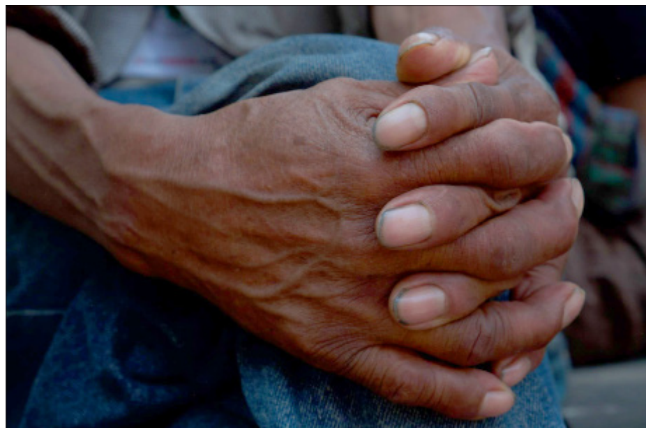
▲ La percepción de la discriminación a personas indígenas pasó del 25.3% en 2017 a 28% en 2022.

El flagelo de la discriminación como hemos señalado requiere que el Estado Constitucional Democrático se fortalezca, que los postulados de Constitución dejen de ser para muchos sectores de la población meros enunciados normativos, que se pase de la retórica discursiva de promesas al respeto y cumplimiento efectivo de los derechos humanos, que se entienda lo previsto en el artículo 3º constitucional, fracción II, inciso a) de que la democracia no solamente debe de ser vista como una estructura jurídica y un régimen político, sino como un sistema de vida fundado en el