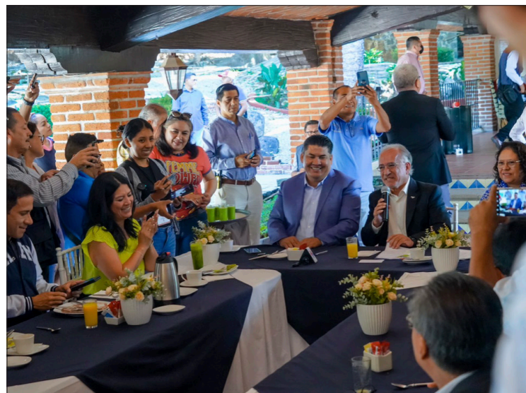
▲ El rector de UAEM consideró un hecho histórico para la Universidad el aumento presupuestal por el que se le otorgará 3.5 por ciento del presupuesto estatal a partir del próximo año.

"Los responsables de estas dependencias ya han comparecido ante el Congreso. Personalmente, tengo dudas acerca del incremento de cinco veces en los costos de las licencias y placas, pero el debate continúa entre mis colegas y estamos buscando una solución en beneficio de los ciudadanos de Morelos. Mi objetivo es garantizar una adecuada asignación de los recursos, ya que ese dinero no es mío ni del Ejecutivo, sino de los ciudadanos, y debemos velar por su correcta utilización", concluyó el diputado.