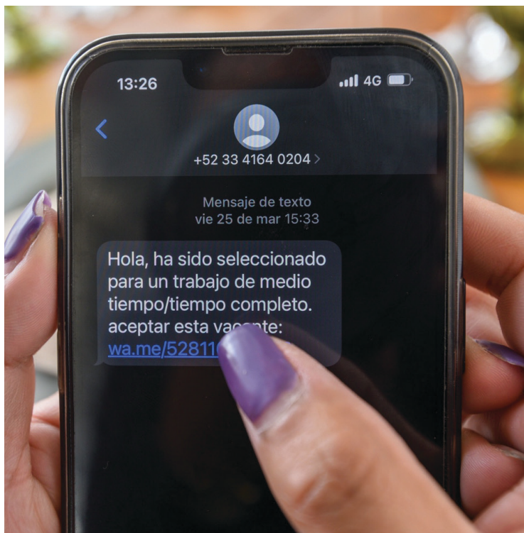
▲ Las autoridades advierten sobre el peligro de proporcionar datos personales y aceptar invitaciones a negocios o empleos que se reciben por redes sociales.