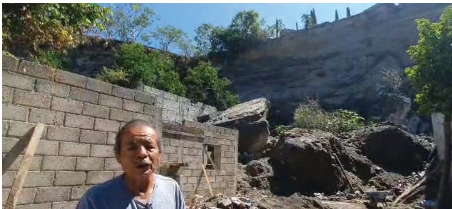
▲ El propietario del terreno en donde murieron dos personas en el 2022 tras el desprendimiento de una roca, reconstruye la casa pues, dice, es el único lugar que tiene para vivir.

"La Ayudantía de Chipitlán es un lugar público que sólo sirve para aerobics, ejercicios y talleres. Los baños son dos nada más, están en mal estado y uno no funciona. Las autoridades se han jactado en decir que se hizo una inversión de más de 100 millones para hacer trabajos en el panteón. Incluso en el campo deportivo jamás se adecuó nada como difundieron", dijo