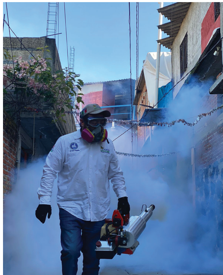
▲ El ayuntamiento de Cuernavaca anuncia que se incrementarán las jornadas de termonebulización y descacharrización ante el incremento de casos de dengue.