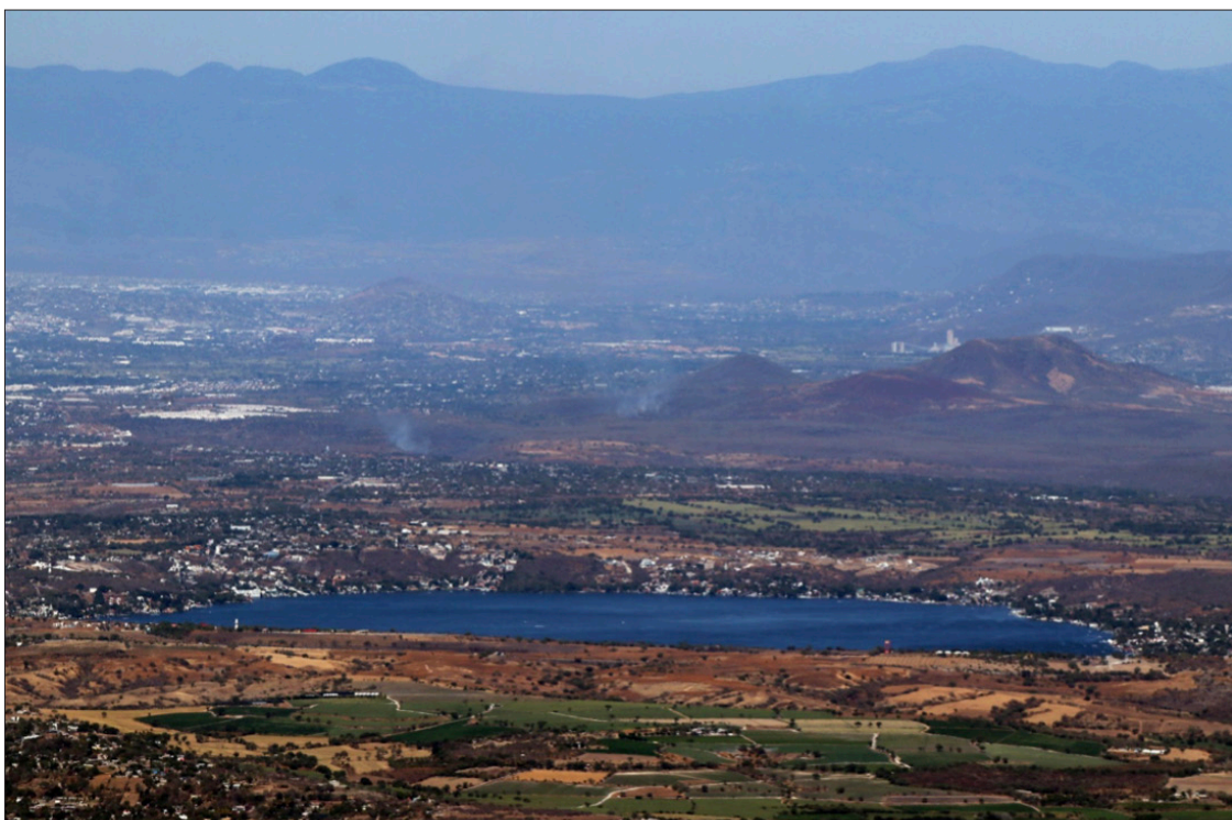
▲ Uno de los principales atractivos turísticos de Morelos, el Lago de Tequesquitengo, muestra disminución en su nivel de agua.

Señaló que, por ahora, no cuentan con estrategias definidas, sino que están esperando a regularizar las lluvias para recuperar el nivel adecuado de agua. No obstante, destacó la importancia de vigilar que las barrancas se desazolven y no estén obstruidas para permitir el flujo correcto de agua hacia el Lago de Tequesquitengo.