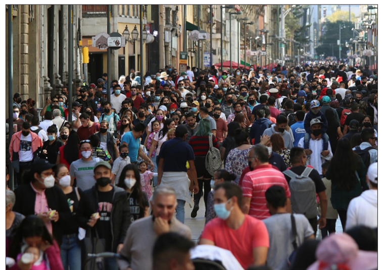
▲ En un mundo altamente cambiante, que no podemos entender, no podemos darnos el lujo de permanecer inmóviles.

La pluralidad es el vehículo para encontrar la solución a los contrastes sociales