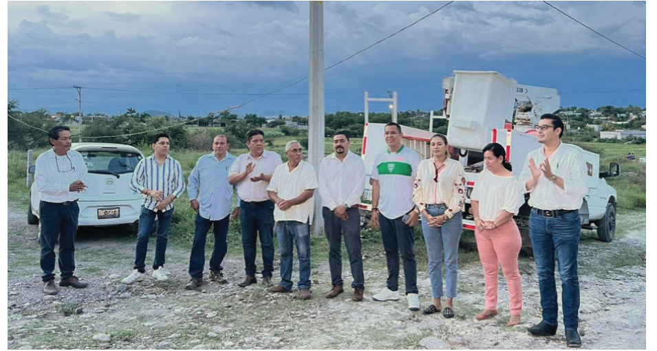
▲ La obra de instalación de infraestructura básica de electrificación contó con una meta de 454 metros lineales de longitud, beneficiando a 48 hogares y 150 ciudadanos.