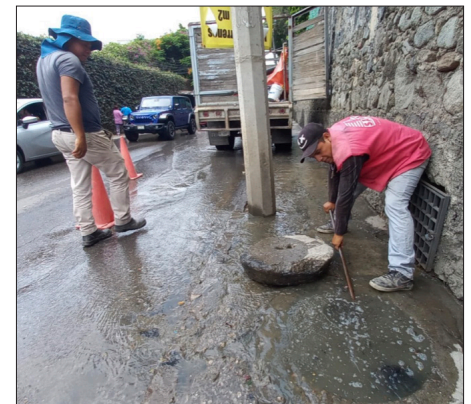
▲ En este trimestre fueron rehabilitados 144 metros lineales de tubería colapsada y 75 fugas de drenaje sanitario.