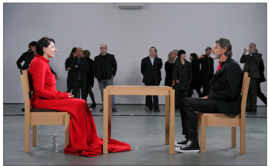
▲ Marina Abramović.

En el transcurso de casi tres meses, durante ocho horas al día, se encontró con la mirada de 1000 extraños y conocidos, muchos de los cuales se conmovieron hasta las lágrimas. La silla siempre estaba ocupada y había filas continuas de personas esperando para sentarse en ella. “Fue [una] completa