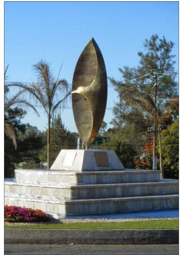
▲ Paloma de la Paz.

Nos dejó como legado varias obras que forman hoy en día parte importante de nuestro entorno cultural, entre ellas la estatua denominada: “La madre”, en el