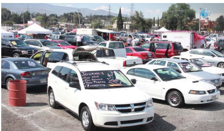
▲ Los fraudes en compraventa de automotores han aumentado un 35 por ciento en Morelos, al igual que el robo con violencia de automotores.

En cuanto a los vehículos más susceptibles a este tipo de fraudes, Nissan, Volkswagen y Chevrolet lideran la lista. Además, se ha identificado que bandas delictivas de otros estados son las principales responsables de estos delitos, ya que acuden a Morelos para cometerlos y luego regresan a sus lugares de origen para venderlos a precios más bajos.