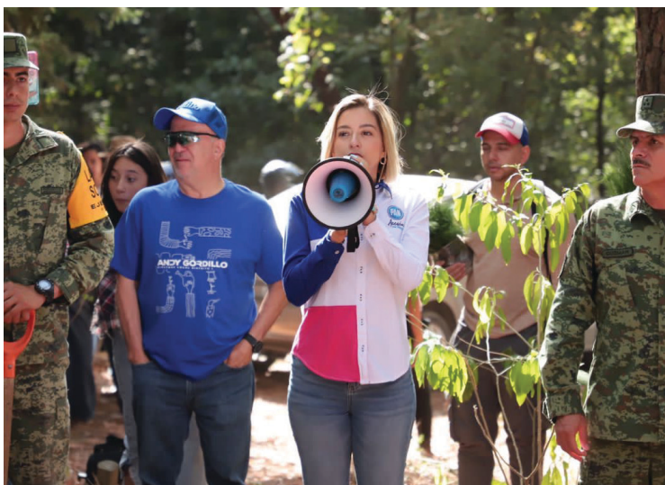
▲ Municipios como Cuernavaca, Hueyapan, Coajomulco, Tlayacapan, Puente de Ixtla y Tetecala fueron algunos de los beneficiados con esta campaña que busca proteger y recuperar la superficie vegetal.

“Los árboles proporcionan servicios tan importantes para el ser humano, son fuente inagotable de vida, por ello la urgencia de crear conciencia de mantener bosques sanos por la flora y fauna de Morelos, gracias a todos por que con esta acción que no une como sociedad esperamos mejorar las condiciones de vida de todas y todos, y continuaré presente y encabezando las causas sociales que están cambiando la vida pública”, concluyó.