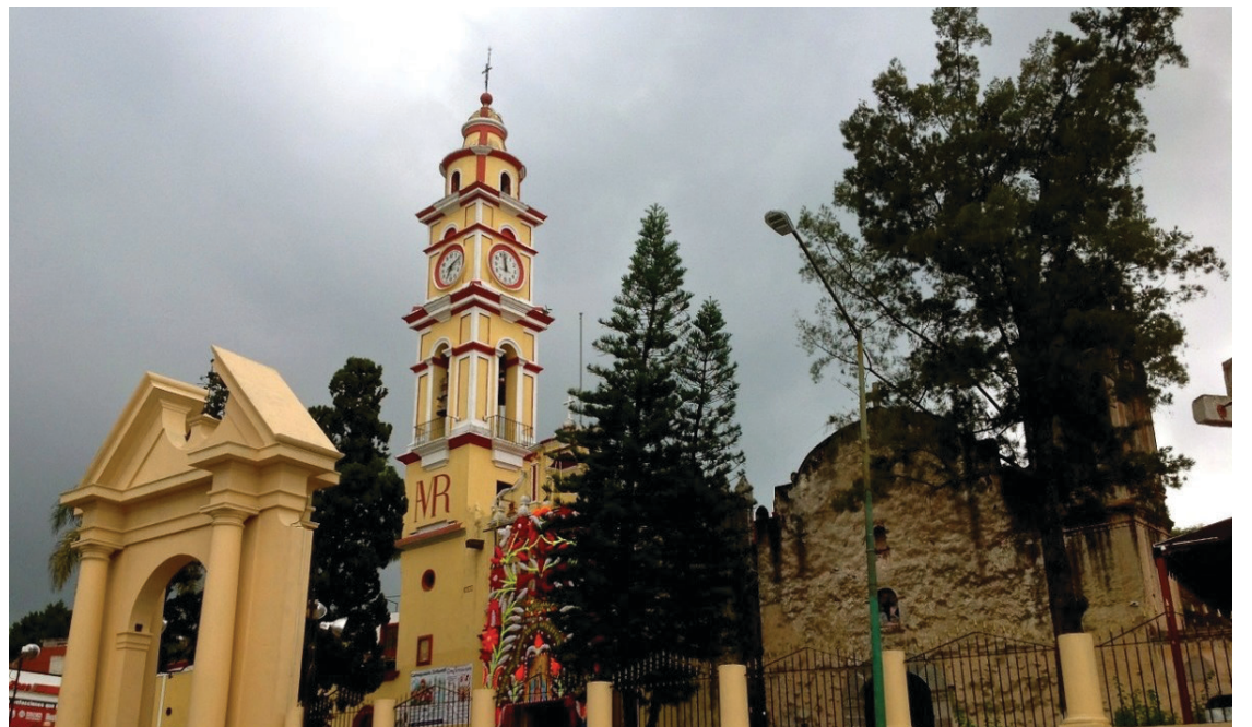
▲ Los vecinos de Tlaltenango repudian al comité organizador que, dicen, fue conformado a puertas cerradas, contraviniendo los usos y costumbres de la comunidad.

"El ayudante municipal solo nos ha atacado verbalmente y amenazado con denunciarnos, pero hasta ahora no hemos recibido ninguna denuncia formal", agregó.