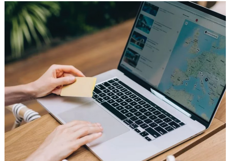
▲ Los fraudes en Internet aumentan en temporada vacacional, alerta el Consejo Ciudadano de Seguridad.

Además, para aquellos que lamentablemente han caído en este engaño, recomendó "reportar ante la Profeco", y acercarse a ellos para levantar su denuncia. Asimismo, subrayó la importancia de verificar la información de las agencias de viajes antes de realizar cualquier transacción.