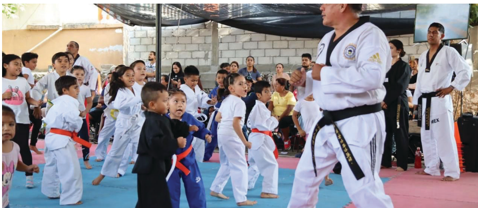
▲ El ayuntamiento de Jiutepec ofrece clases gratuitas de taekwondo en 16 espacios públicos del territorio.

Con el objetivo de contribuir a la salud física y mental de niñas, niños y jóvenes del municipio de Jiutepec, el Gobierno con Rostro Humano de Jiutepec encabezado por el alcalde Rafael Reyes ofrece clases gratuitas de taekwondo en 16 espacios públicos del territorio.