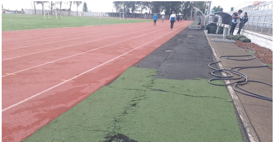
▲ En la unidad deportiva niegan acceso al baño a los adultos mayores atentando contra su salud, denuncian.

Por su parte, algunos usuarios han intentado solicitar al personal de la unidad que abran los baños, pero afirman que, a pesar de las promesas, esto no se ha llevado a cabo. "Simplemente nos dicen que sí, pero nunca cumplen o nos dicen que solo obedecen órdenes", agregó otro de los afectados.