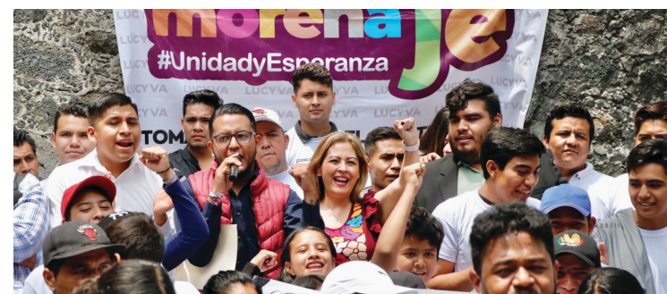
▲ La senadora con licencia llamó a los jóvenes al relevo generacional.