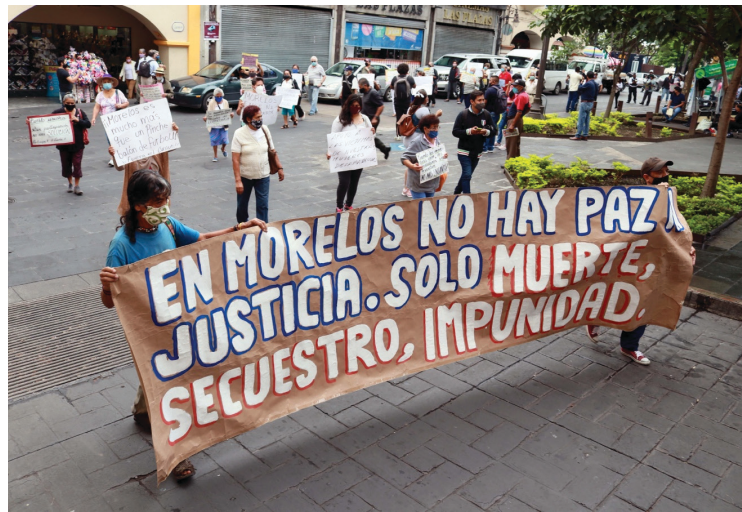
▲ Si no se combate la criminalidad en el estado, los empresarios "no podemos continuar en el esfuerzo de la generación de empleos y de riqueza desde el sector privado", sostiene la Canacintra.