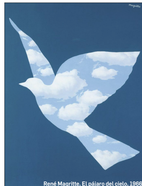
René Magritte. El pájaro del cielo, 1966.

a todos aquellos que tuvimos la fortuna de conocerte.