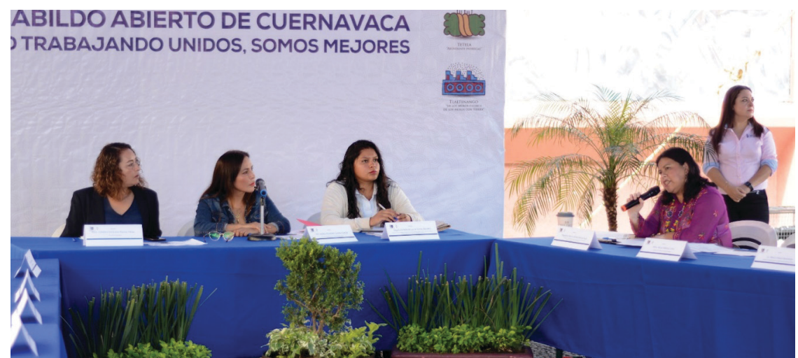
▲ A petición del Instituto de la Mujer de Cuernavaca, el Comité Municipal para Atender, Sancionar y Erradicar la Violencia contra las Mujeres (PASEMUN) presentó diversos informes de los trabajos encomendados a las instancias municipales que lo integran.