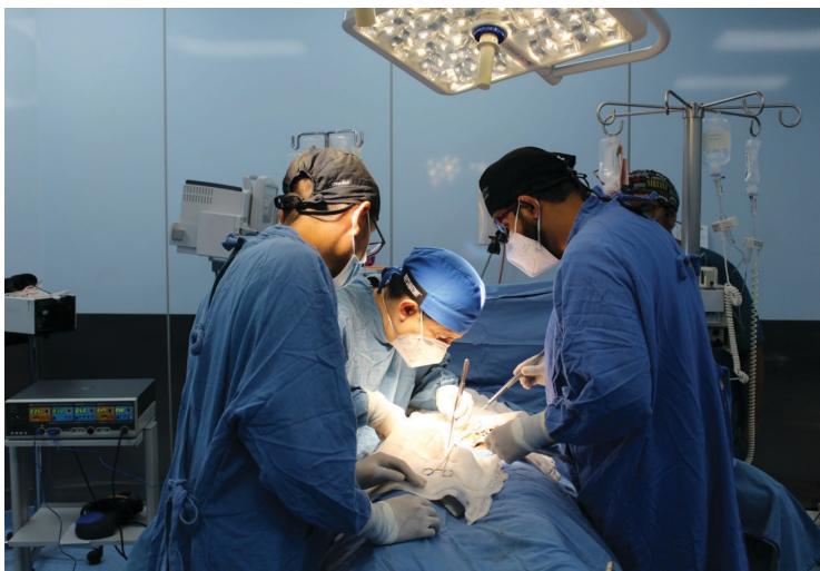
▲ Este tipo de intervenciones mejoran drásticamente la calidad de vida de pacientes que, de otra forma, tendrían que recurrir a la diálisis.