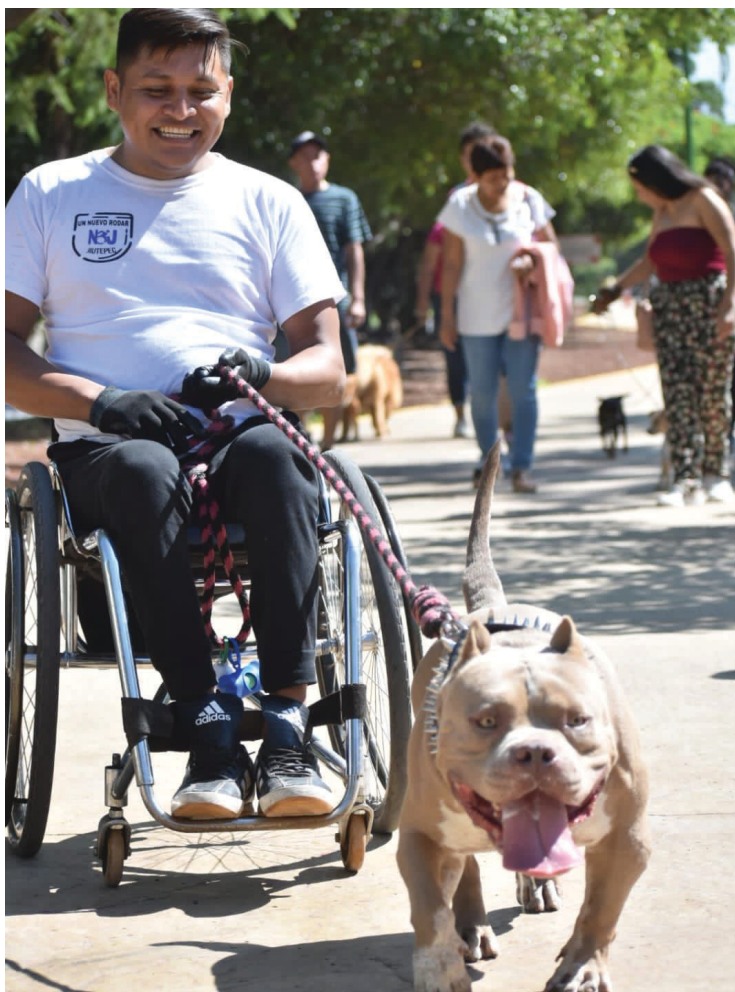
▲ La presidencia municipal de Jiutepec hizo un llamado a la comunidad para cuidar a los animales de compañía.

En el evento se ofreció vacunación antirrábica gratuita, asimismo se impartieron pláticas sobre la importancia de crear a las mascotas, sobre la esterilización, cómo prevenir el maltrato animal y el problema de la garrapata.