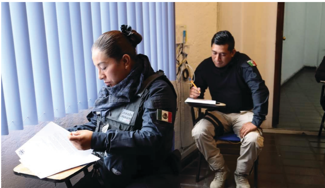
▲ Los primeros resultados del examen para la carrera policial serán publicados el 2 de agosto.

La evaluación se llevó a cabo en las instalaciones de la Seprac con el objetivo de asegurar la certeza y legalidad en el reclutamiento de estos nuevos elementos policiales.