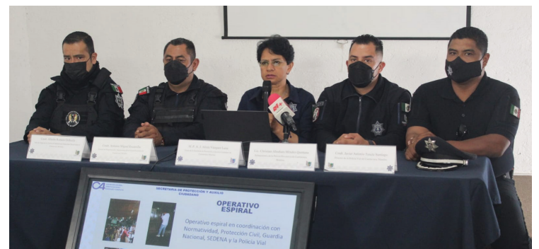
▲ El 19 de julio, elementos de SEPRAC, con apoyo de la ciudadanía, lograron la detención de dos presuntas bandas de robo de vehículos con violencia y autopartes.