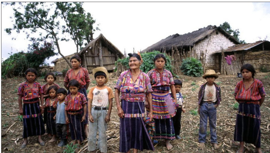
▲ Familia guatemalteca.