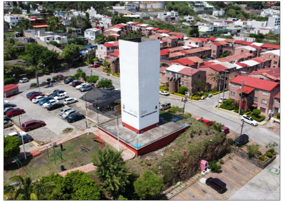
◀ La rehabilitación del tanque elevado representó una inversión de 300 mil pesos, financiada por el Sistema de Conservación, Agua Potable y Saneamiento de Agua de Jiutepec (SCAPSJ).