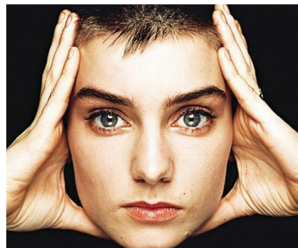
▲ Sinead O'Connor.

“[...] Su sello la abandonó después de vender 7 millones de álbumes para ellos. Se volvió loca, sí, pero poco interesante, nunca. Ella no había hecho nada malo. Tenía una orgullosa vulnerabilidad... y hay cierta industria musical que odia a los cantantes que no ‘encajan’ y nunca son elogiados hasta la muerte, cuando, finalmente, no pueden responder. El cruel corralito de la fama rebosa de elogios para Sinead hoy... con las habituales etiquetas tontas de ‘ícono’ y ‘leyenda’. La alabas ahora SÓLO porque es demasiado tarde. No tuviste las agallas para apoyarla cuando estaba viva y te estaba buscando. La prensa etiquetará a los artistas [...] y llamarán a Sinead triste, gorda, chocante, loca... ¡ay, pero hoy no! Los directores ejecutivos de la música que pusieron su sonrisa más encantadora cuando la rechazaron, están haciendo fila para llamarla un ‘ícono feminista’, [...] cuando fuiste TÚ quien convenció a Sinead para que se rindiera... porque ella se negó a ser etiquetada, y fue degradada, como siempre son degradados los pocos que mueven el mundo. [...] ¿A dónde vas cuando la muerte puede ser el mejor resultado? [...] Ella era un desafío, y no podía ser encerrada, y tuvo el coraje de hablar cuando todos los demás permanecieron en silencio. Fue acosada simplemente por ser ella misma. Sus ojos finalmente se cerraron en busca de un alma que pudiera llamar propia”.