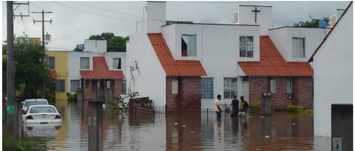
▲ Con la coordinación intermunicipal, la capacitación recibida y la colaboración de la ciudadanía al no tirar basura, en Jojutla dicen estar preparados para que no haya inundaciones de gravedad en el municipio.

charcamientos; el simple acto de retirar la basura de las alcantarillas permite que el agua fluya. Por ello, agradezco mucho a las personas que no arrojan basura a la calle. Aunque todavía hay personas sin ética que lo hacen, la cantidad ha disminuido; ojalá podamos seguir fomentando esta conciencia".