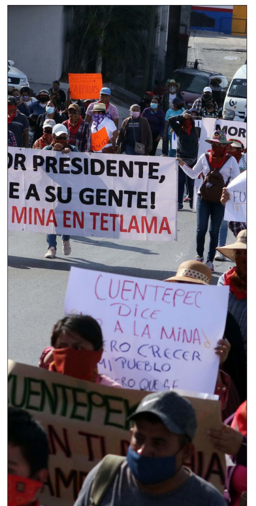
▲ No han cesado las protestas contra la minera.

Además de Cuentepec, la mina tendría un impacto directo en los cerros del Jumil, Calaza, el paraje Jolotepec y la comunidad de San Agustín Tetlama. También afectaría a la Unidad Morelos, Temixco y a las colonias Benito Juárez, Aeropuerto, Las Rosas, Francisco Villa, Xochitepec centro, Tezoyuca, Miacatlán, Xochicalco y Coatetelco.