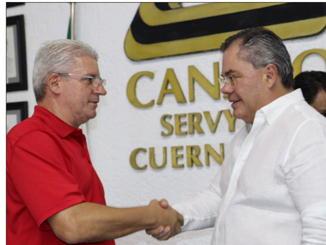
◀ El presidente municipal reiteró el compromiso de la administración 2022-2024 de trabajar de la mano con los empresarios.