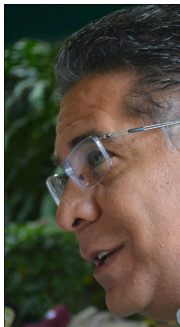
▲ El Coordinador General de Política y Gobierno de la Presidencia de la República lamentó que la administración estatal actual haya relegado y minusvalorado el talento y la experiencia de los morelenses.