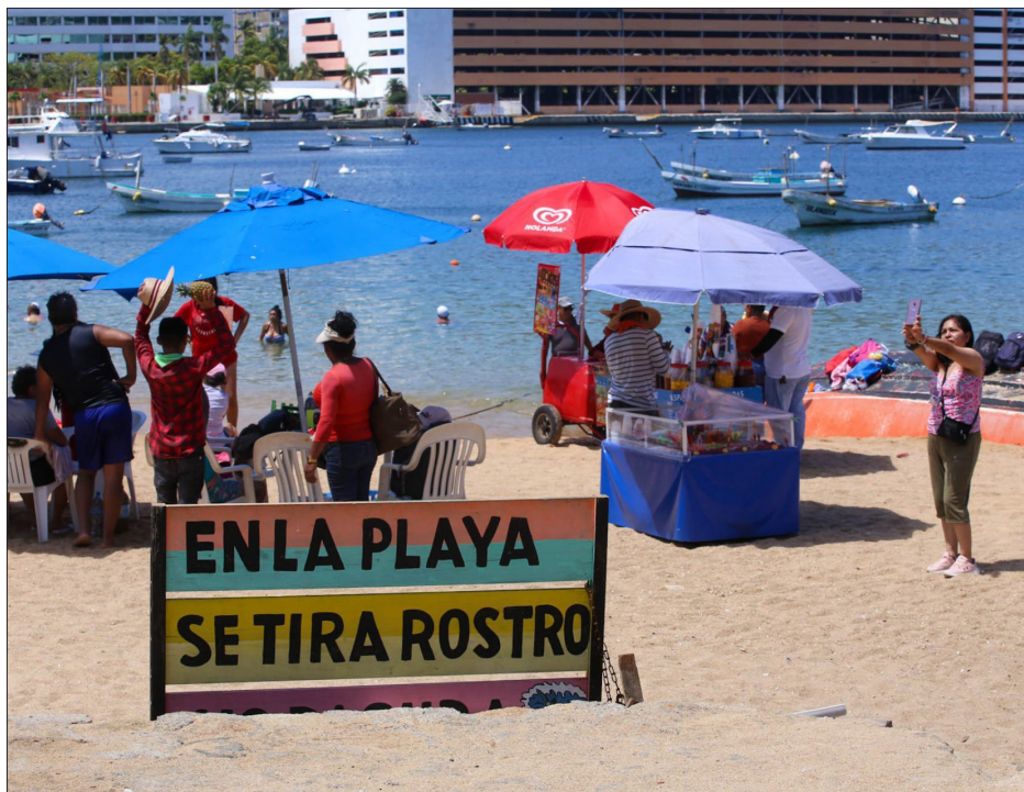
▲ "Su negocio provee de líquidos a las personas que durante el día recorren la playa vendiendo lo mismo que se ofrece en cualquier costa: sombreros, cocadas, tatuajes, collares...".

*Profesora de la Universidad Autónoma de la Ciudad de México