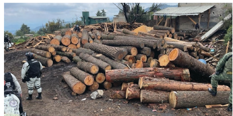
▲ Las autoridades informaron que ya hay 500 elementos en Huitzilac y que se incorporarán 250 más para reforzar el operativo contra la tala clandestina.

Cabe señalar que esta mañana durante la sesión de la Mesa de Coordinación para la Construcción de la Paz, las y los integrantes reiteraron el compromiso de no bajar la guardia y seguir con las acciones conjuntas que sean necesarias para hacer frente a la tala clandestina y otros delitos, ya que mencionaron, no existen registros de un combate a este delito semejantes en la entidad.