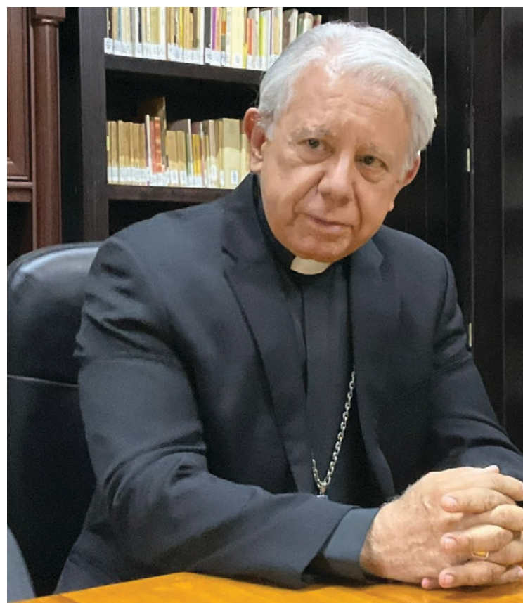
▲ Los escándalos al interior del TSJ, en el que se han visto involucrados algunos magistrados, causan "una preocupación muy seria y resalta el nivel de corrupción al que estamos enfrentando", sostiene el Obispo de Cuernavaca.

"Honestamente, les respeto su opinión, pero después de las cuatro de la tarde, no circulo por esa zona. Cualquiera que haya afirmado eso probablemente cuenta con escoltas, de otra manera, no lo veo factible", concluyó.