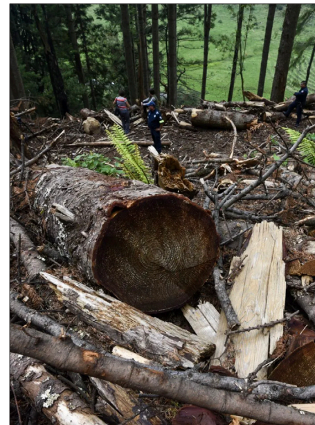
▲ Tala clandestina.

Estando aquí me enteré de lo que ocurrió el 2 y 3 de agosto en un operativo de la Guardia Nacional, el ejército, algunas autoridades federales, fiscalía de Morelos, Profepa y policía de Morelos para incautar madera de varios aserraderos de “talamontes” de una colonia de Huitzilac. Según la crónica de varios diarios, “habitantes de Huitzilac se enfrentaron con