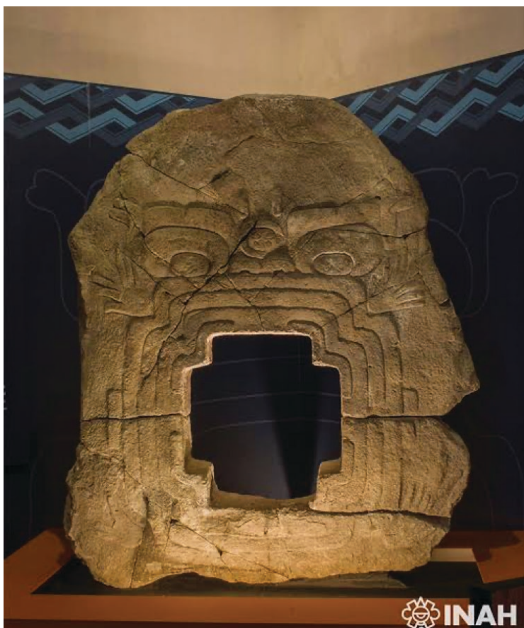
▲ La afluencia al MRPM se ha duplicado en estos días de asueto. El recientemente recuperado "Monstruo de la Tierra" o Monumento 9 de Chalcatzingo, también ha despertado mucho interés en el público.

"No podemos olvidarnos que de manera muy especial hemos recibido muy recientemente el Monumento 9 de Chalcatzingo o Portal de Mictlán que ha disparado las visitas porque ha causado mucha curiosidad e interés de quienes nos visitan", recalcó.