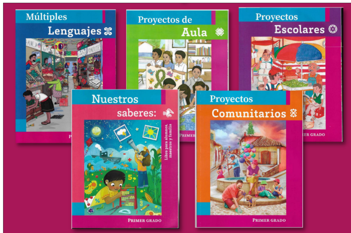
▲ La asociación de padres de familia reprochó que varias escuelas morelenses ya hayan recibido libros de texto gratuitos a pesar de los recursos legales que se han interpuesto en su contra.