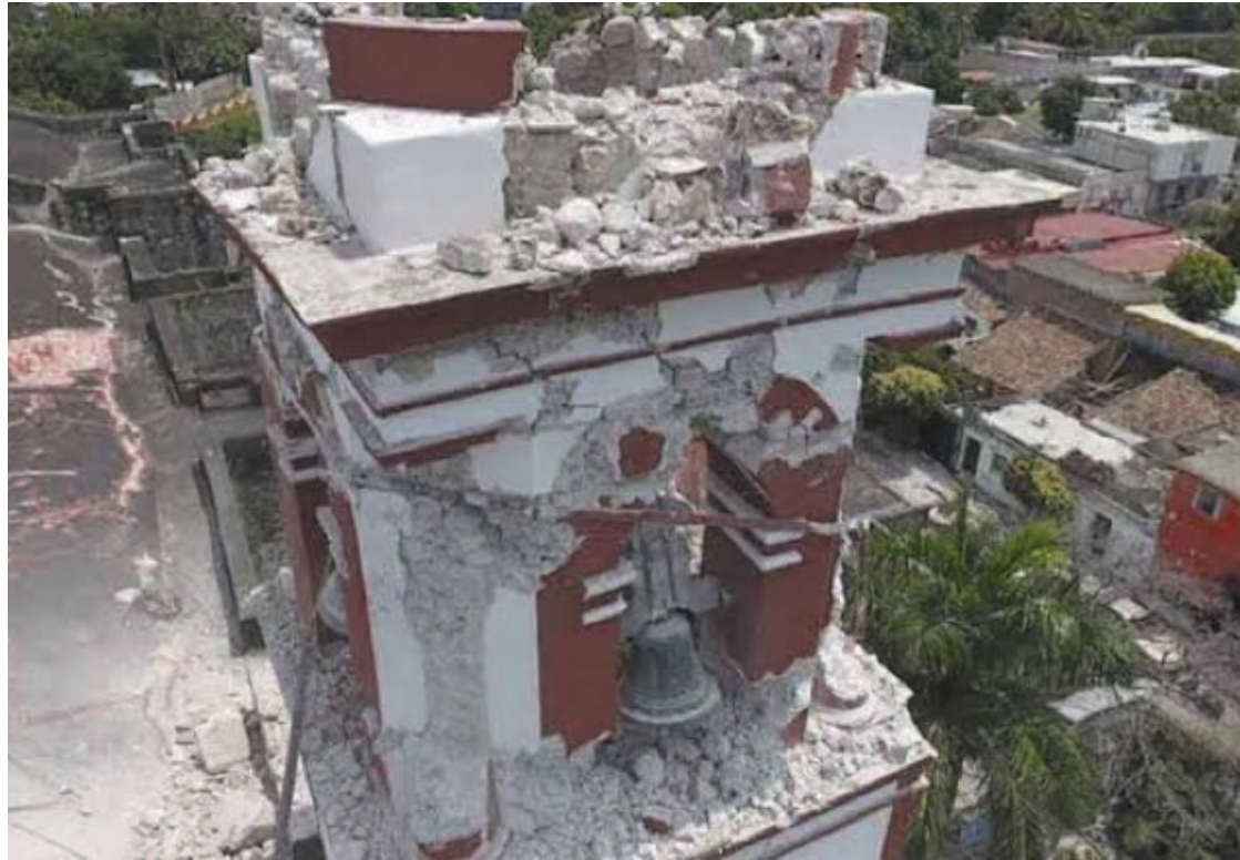
▲ El terremoto del 2017 dejó varios monumentos históricos en muy mal estado, pero el INAH asegura que el rescate de la totalidad se concluirá este mismo año.

La mayoría de los inmuebles que resultaron afectados por el terremoto son de carácter religioso, y el Obispo de Cuernavaca, Ramón Castro Castro, ha observado que algunos de los más antiguos como la Catedral de Cuernavaca se han mantenido sin intervención, sin embargo, el INAH asegura que todos serán sometidos a una intervención completa en un futuro cercano.