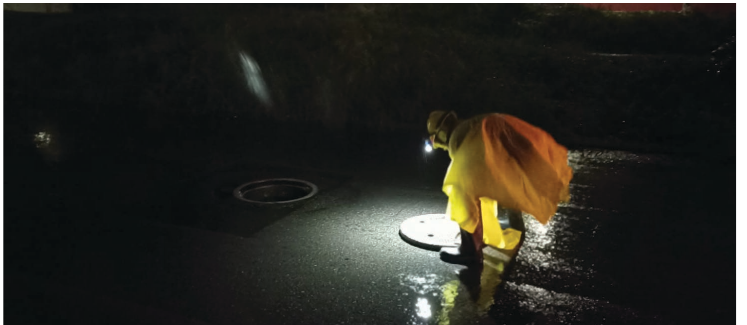
▲ De acuerdo con el pronóstico meteorológico, se espera potencial de chubascos puntuales acompañados de tormenta eléctrica.

Finalmente, la CEPCM informó que mantiene un trabajo coordinado con autoridades de los tres niveles de gobierno, para monitorear y atender cualquier incidente durante el transcurso de esta temporada, para la salvaguarda de la población morelense.