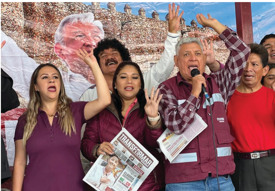
▲ Las brigadas a favor de Claudia Sheinbaum fueron presentadas por Héctor Ulises Lara, antiguo líder del Morena en la Ciudad de México, y en el estado serán coordinadas por la diputada Ariadna Barrera.

Las encuestas se llevarán a cabo del 28 de agosto al 3 de septiembre, y el contendiente ganador será presentado el 6 de septiembre de 2023.