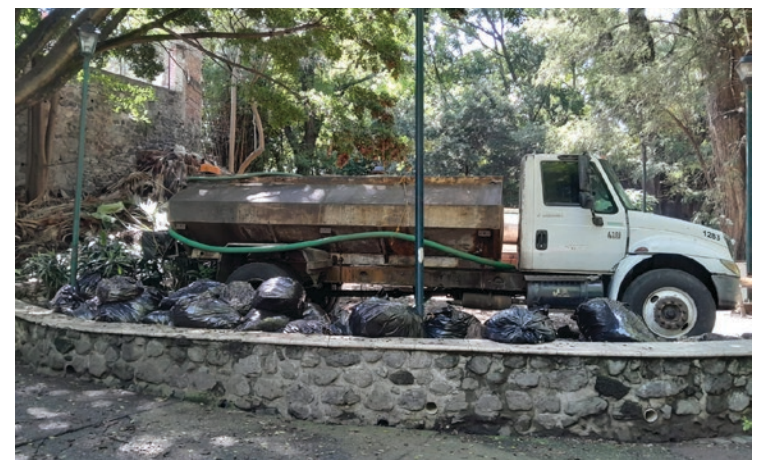
▲ El parque Melchor Ocampo en Cuernavaca se usa para todo, excepto para el disfrute de la comunidad, dicen ambientalistas.

Para tal efecto, desde este nueve de agosto, y hasta el nueve de septiembre, se habrán de realizar diversas actividades culturales, entre ellas, los viejos y tradicionales rituales de los antiguos tlahuicas, como la danza de los cuatro puntos cardinales, con el sonar de los huehues, el teponaxtle. La caracola y el intenso olor del copal, clásicas formas de pedir la llegada de las lluvias para tener mejores cosechas, y para que los dioses sean benévolos con su pueblo, en este caso, con el pueblo morelense.