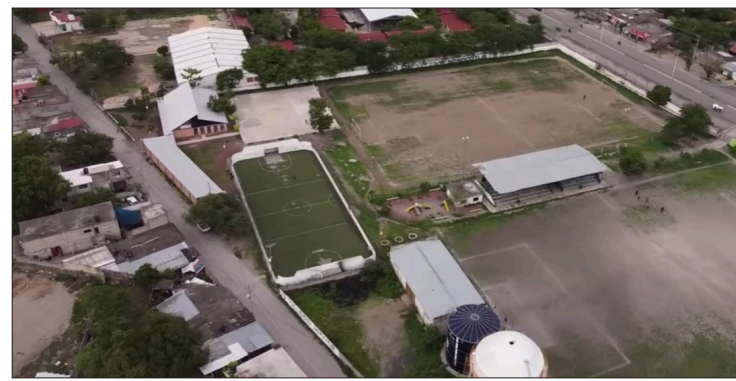
▲ La Unidad Deportiva de Xoxocotla ya será propiedad, y estará bajo la administración del ayuntamiento sureño.