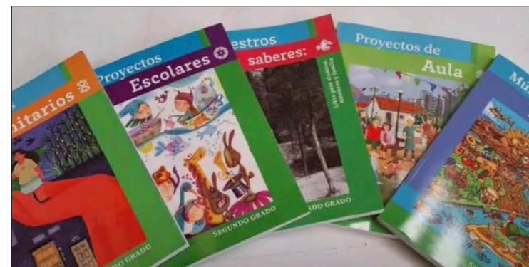
▲ Las autoridades educativas aseguran que no hay amparos en el estado que les impidan distribuir los libros de texto.

Finalmente, comentó que el próximo 10 de agosto, en el estado de Hidalgo, se reunirán todos los secretarios de educación del país, para recibir las últimas instrucciones por parte de la Secretaría de Educación Federal en preparación para el regreso a clases el 28 de agosto próximo.