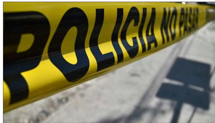
◀ No se reportaron ni heridos ni detenciones en Ocoteppec.

Hasta el momento, no se reportan heridos ni detenciones, por lo que tanto las autoridades municipales como estatales están llevando a cabo un operativo para la localización de los ladrones.