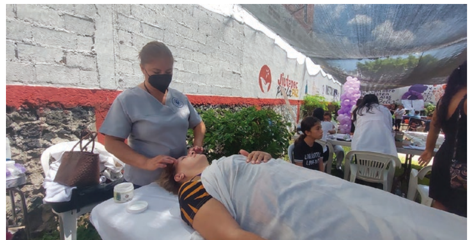
▲ La Instancia de la Mujer de Jiutepec ofrece cursos para el autoempleo de las mujeres.