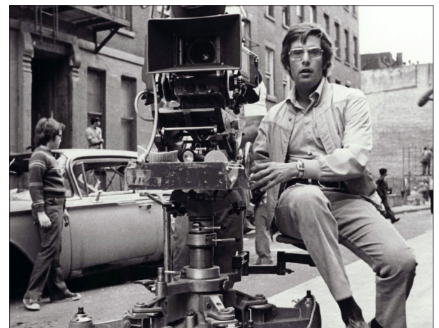
▲ William Friedkin en el set de El Exorcista, 1973.

El rodaje hoy sería impensable e imposible de realizar. Sólo basta revisar la icónica secuencia de la persecución en la que Gene Hackman, al volante, trata de alcanzar el tren en el que huye uno de los sospechosos. Sobra decir que no se utilizaron efectos especiales y que se puso en riesgo a transeúntes, miembros de la producción y a los mismos actores. Aunque el ritmo de la persecución estaba cuidadosamente planificado de antemano (se cuenta que Friedkin usó la canción “Black Magic Woman” de Santana