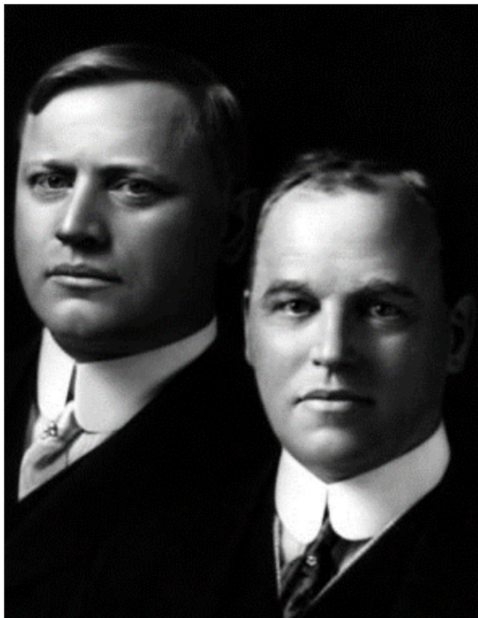
▲ John y Horace Dodge.