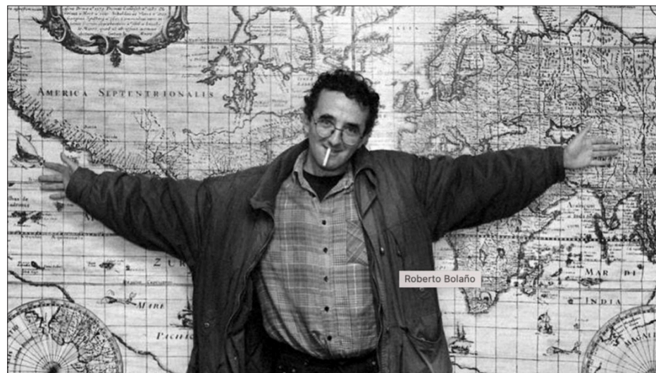
▲ Roberto Bolaño.