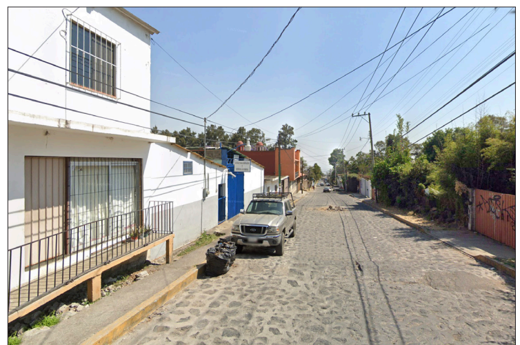
▲ Ahuacatitlan, asediada por el robo de casas.

Ante esta preocupante situación, los residentes han hecho un llamado a las autoridades de la Ayudantía Municipal y al Ayuntamiento de Cuernavaca, instándolos a tomar medidas concretas para abordar este problema.