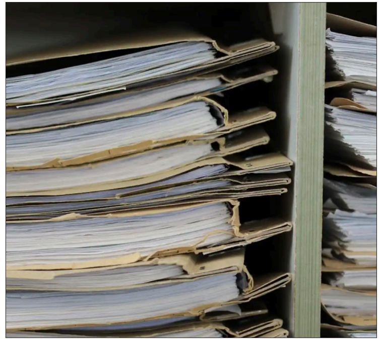
▲ Dicen que las carpetas contra exfuncionarios no muestran avances.

En lo que va del año, señaló, se han realizado 17 mil 996 pruebas de tamizaje rápido y se ha iniciado tratamiento para 171 pacientes que han dado positivo en ETS. Además del tratamiento médico, también se les ofrece apoyo psicológico.