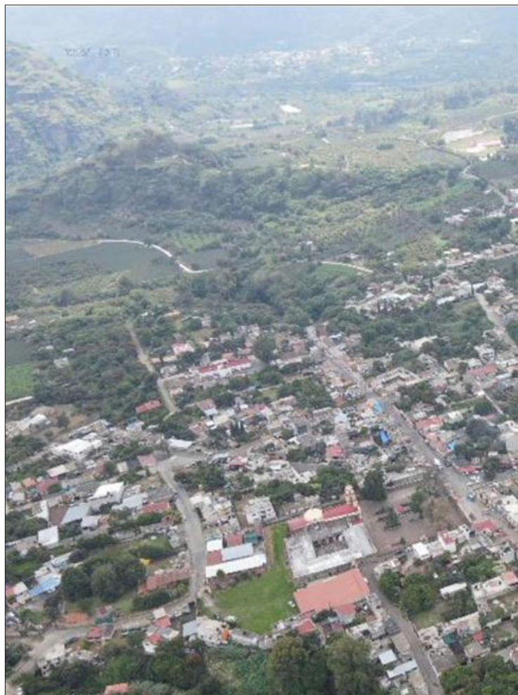
▲ Las fuerzas federales constataron tala excesiva, transformación de cultivos y daños por quema controlada en Tlalnepantla.

"Estos incidentes se han registrado desde julio de 2022 y nuestro objetivo es hacer que estos casos sean visibles, fomentar las denuncias y por eso también colaboramos con los operadores de las rutas", comentó Castillo.