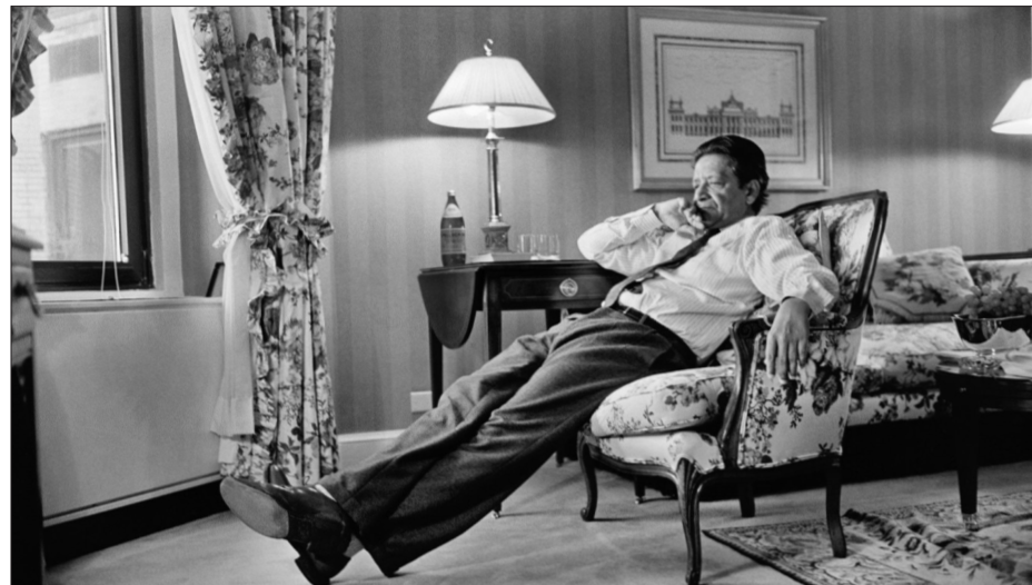
▲ V.S. Naipaul