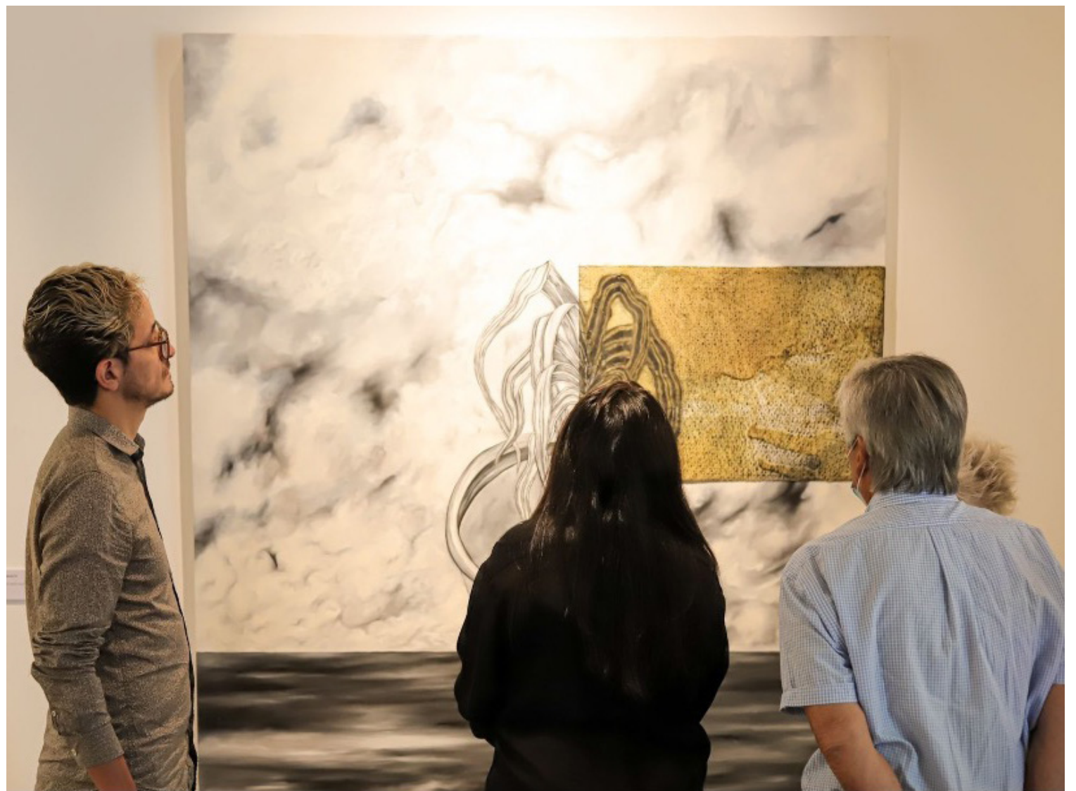
▲ En su obra, la artista retrata la fuerte conexión entre su vida, las abejas y el trabajo de los apicultores / Foto: Secretaría de Turismo y Cultura/Gobierno del estado