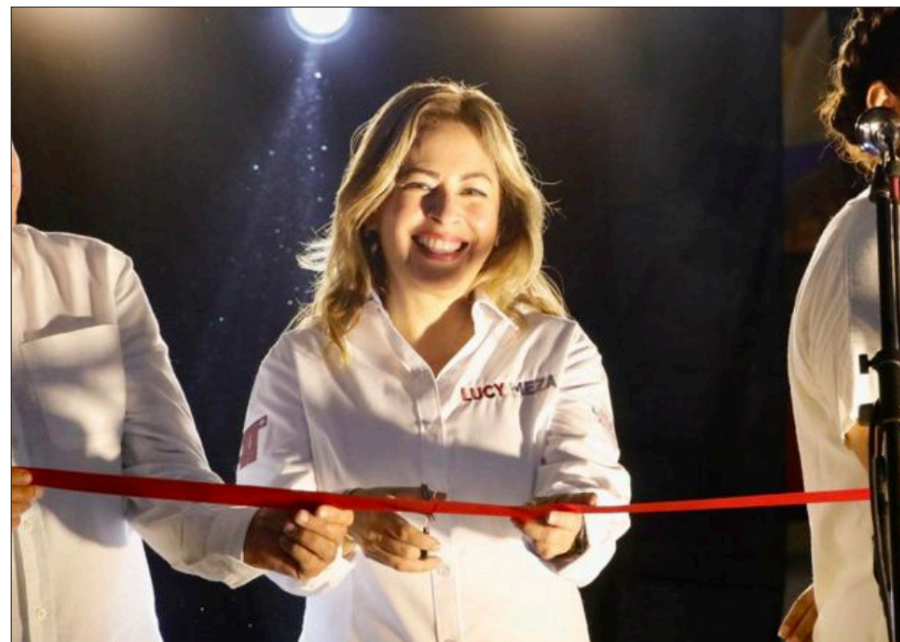
◀ La senadora fue invitada por líderes sociales y representantes de Tehuixtla a inaugurar la Feria del Queso, Pan y Rompopo.