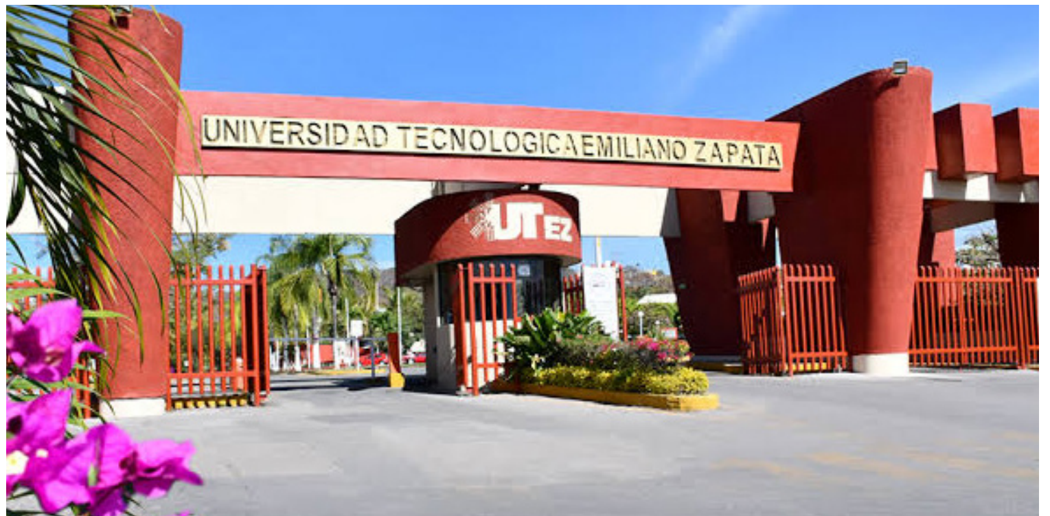
▲ Ingresarán mil 200 nuevos estudiantes en la Universidad Tecnológica Emiliano Zapata (UTEZ)