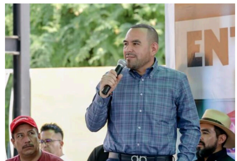
▲ El diputado Alonso Gutiérrez anunció que buscará la candidatura a la gubernatura de Morelos con su partido, Nueva Alianza, aunque también podría postularse vía independiente.

Agregó: "nunca he sido un político malintencionado ni he olvidado las necesidades de la gente".