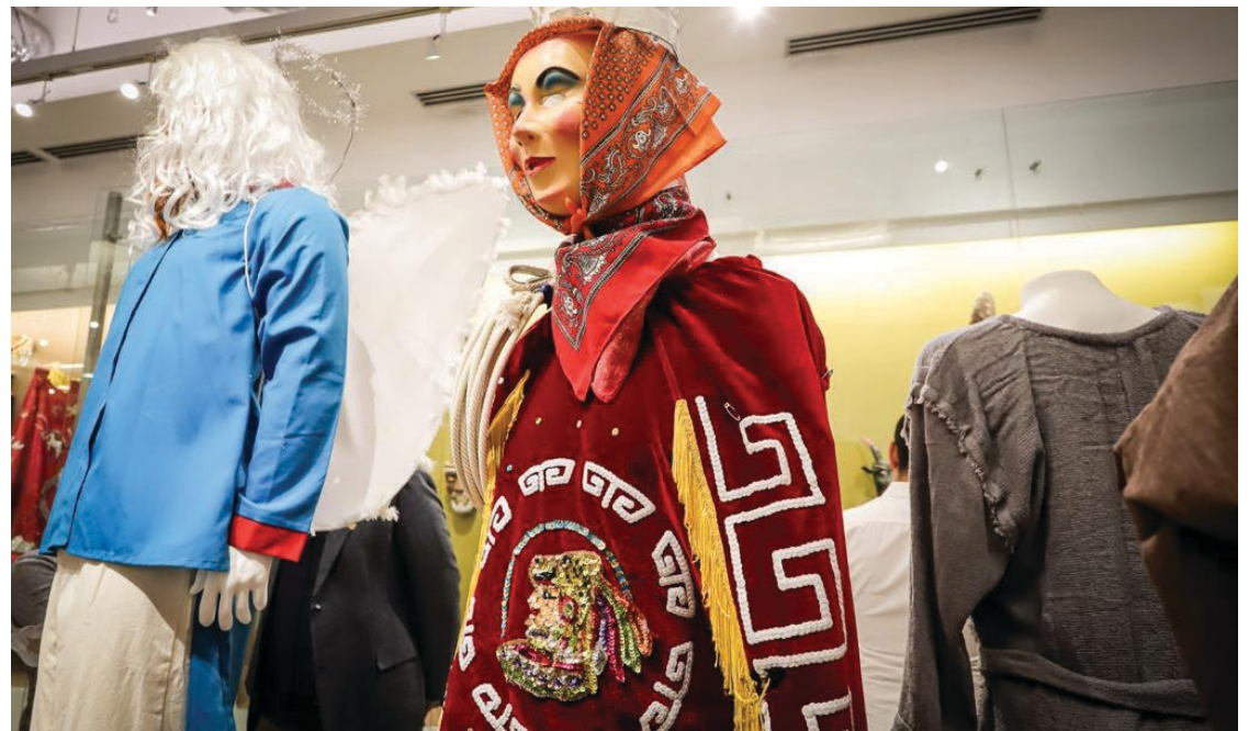
▲ La exposición integra más de 40 piezas entre las que se incluyen trajes, libretos originales y máscaras.

exposición no solo resalta la riqueza cultural del Teatro Campesino Morelense, sino que también celebra el compromiso de las comunidades por mantener viva esta tradición centenaria. Demuestra cómo el arte y la cultura continúan siendo una parte vital del tejido social y la identidad regional en México.