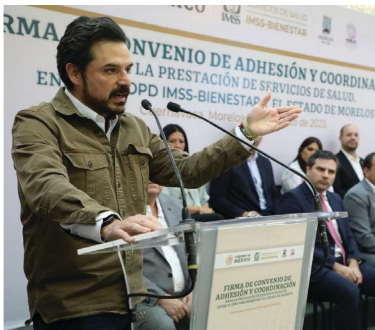
▲ El director general del IMSS, Zoé Robledo, indicó que se podrá terminar el Hospital de Jiutepec, invertir en equipamiento de Centros de Salud, Unidades de Primer Nivel y dar una base laboral a unas mil 400 personas en Morelos.