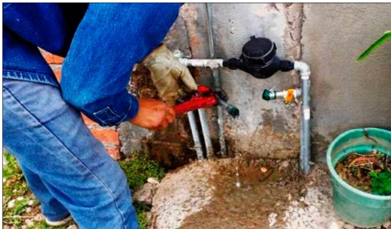
◀ En lo que va del año el Sistema de Agua Potable y Alcantarillado de Cuernavaca ha detectado que entre un 15 y 20 por ciento de los usuarios de la zona norte del municipio obtienen el servicio de manera ilegal.

Figueroa agregó que cuadrillas del Sapac realizan inspecciones casa por casa para evaluar el estado de cada toma domiciliaria y detectar fugas, ya que muchas viviendas en Cuernavaca no cuentan con medidores, lo que dificulta el control del servicio.