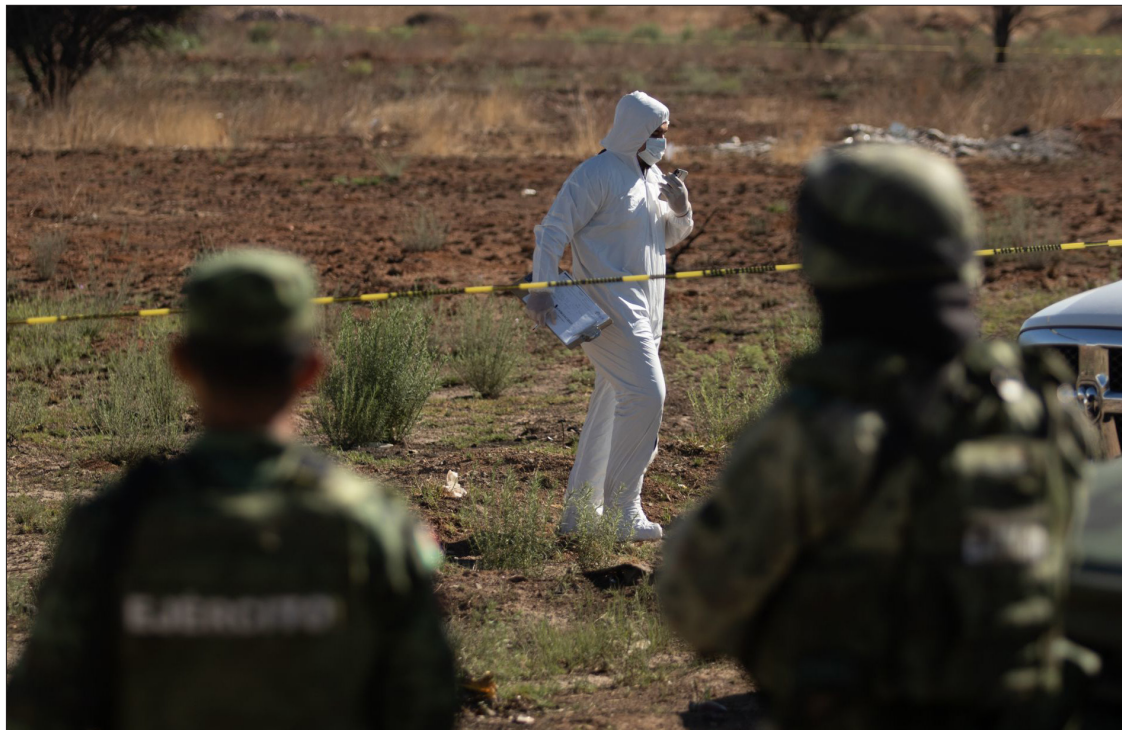
▲ El Secretariado Ejecutivo del Sistema Nacional de Seguridad Pública (SESNSP) coloca a Morelos en el primer lugar a nivel nacional en cuanto a feminicidios.

"Trabajamos intensamente en fortalecer la comunicación asertiva entre las familias, padres y madres de familia, quienes deben brindar el primer apoyo", enfatizó.