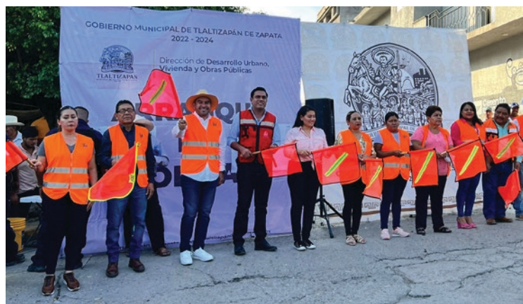
▲ La obra gestionada por Anrubio Kempis, y aprobada por 14 legisladores locales del Congreso de Morelos, consiste en la rehabilitación de dos kilómetros de este tramo carretero de Pueblo Nuevo a Temimilcingo.