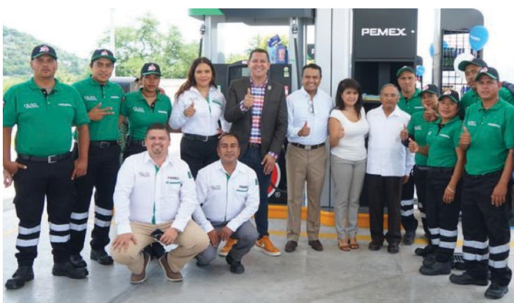
▲ "No se trata simplemente de hacer acuerdos y promesas al aire, sino de traducir esos compromisos en hechos tangibles que benefician a la comunidad", dijo el presidente municipal de Jojutla, Juan Ángel Flores Bustamante.