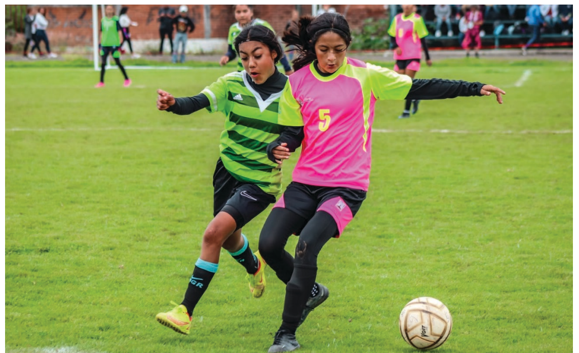
▲ No hubo quien parara a las y los jugadores morelenses en Michoacán; de manera histórica, el estado se lleva los dos metales dorados en la categoría 2009-11.