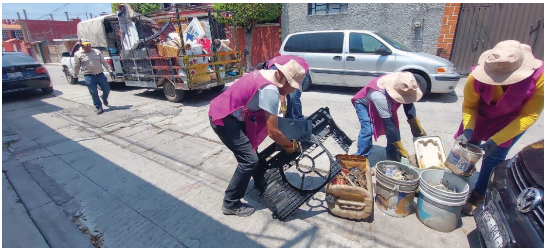
▲ Los trabajos de recolección de recipientes continuarán el miércoles 23 en la colonia Otilio Montaña; el jueves 24 en El Porvenir, para culminar el viernes 25 en calles del pueblo de Tejalpa.