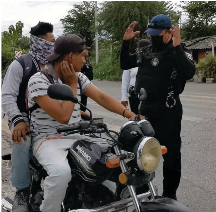
▲ La policía de Xoxocotla también está pendiente de recomendaciones viales, como el uso obligatorio del casco cuando se viaja en motocicleta.

Por ejemplo, mencionó el caso de robos constantes en el Centro de Atención Múltiple (CAM) del municipio, que se han reducido gracias a la vigilancia de la policía y el equipo de Protección Civil, así como del Escuadrón de Rescate y Urgencias Médicas, con la misma proximidad que con los directivos de las escuelas, "se les están proporcionando tanto a negocios, como a instituciones educativas los números de auxilio del municipio", aunado a que hay personal implementado en cada una de las colonias, "una célula pie a tierra que se encarga de repartir los números de emergencia y si ven una acción contra la ciudadanía se tiene que reportar y nuestro tiempo de respuesta no rebasa los cuatro minutos".