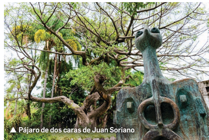
▲ Pájaro de dos caras de Juan Soriano