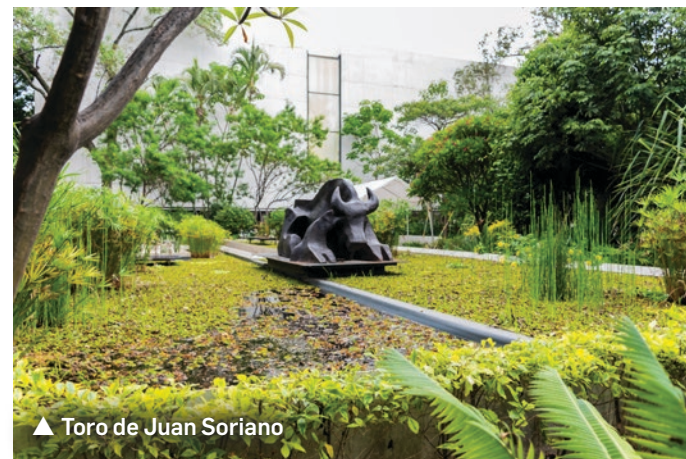
▲ Toro de Juan Soriano