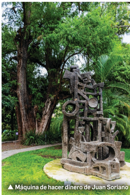
▲ Máquina de hacer dinero de Juan Soriano

◀ Jardín Escultórico del Museo Morelense de Arte Contemporáneo Juan Soriano fotos.