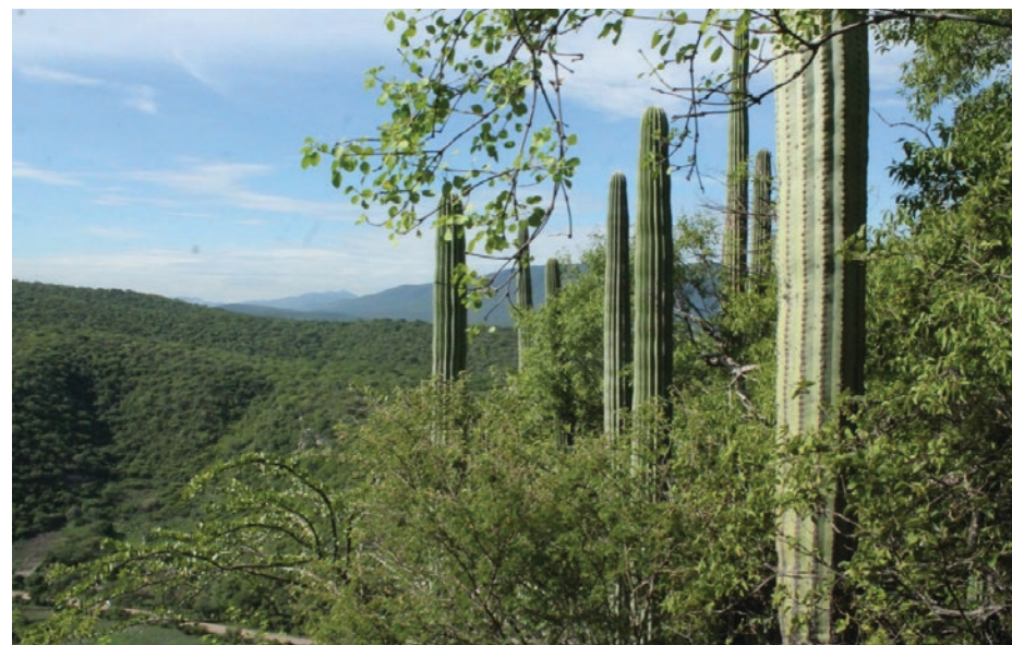
▲ Parque estatal El Texcal.

Solo de esta manera se podrá preservar El Texcal para el beneficio de toda la población morelense que se abastece del agua captada en esta región que es vital para cerca de la mitad de todos los habitantes del Estado de Morelos.