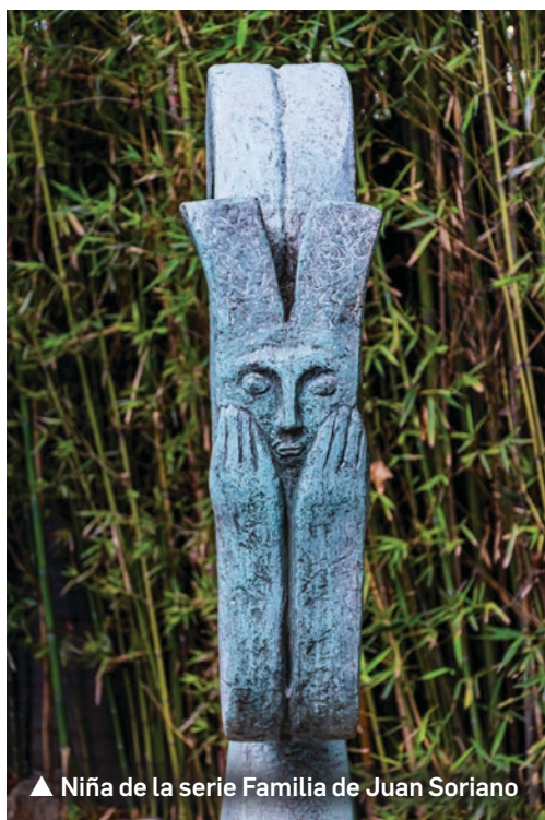
▲ Niña de la serie Familia de Juan Soriano

Esperamos la fotografía que más te guste, de tu entorno familiar, escolar; la foto de todos los días, por donde camines, lo que veas, lo que quieras denunciar y también de tu trabajo, del campo, del taller, de la calle. Esperamos tu foto.