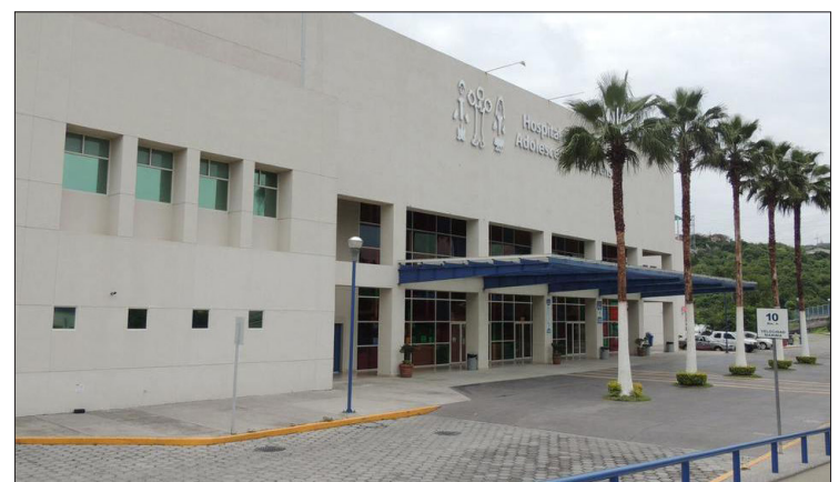
▲ En el Hospital del Niño ya tienen dos meses de desabasto de medicinas, acusan.