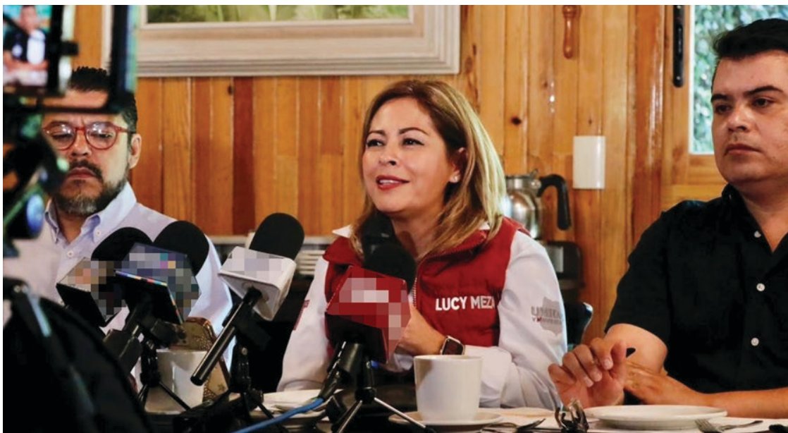
▲ Habrá más adultos mayores beneficiados con la pensión y apoyaremos las reformas al Poder Judicial Federal, anunció la senadora Lucía Meza.

La Senadora reconoció que la seguridad pública sigue siendo una de las principales preocupaciones y anunció que votará a favor de la reforma que amplía el período de la Guardia Nacional y establece su coordinación por parte de la Secretaría de la Defensa Nacional.