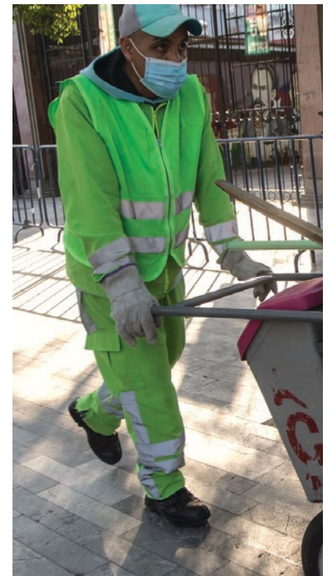
▲ En México, la gente tuvo que seguir saliendo a trabajar, condenada a morir de hambre o por contagio.