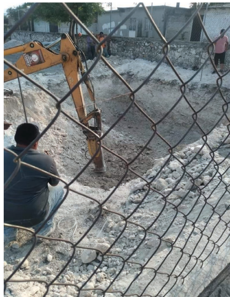
▲ Las obras se iniciaron sin consultar a los padres de familia, señalan.

blo Añorve Ortiz" en la comunidad de Tlatenchi, municipio de Jojutla, Morelos, lograron detener temporalmente los trabajos de instalación de una antena de la Comisión Federal de Electricidad (CFE).