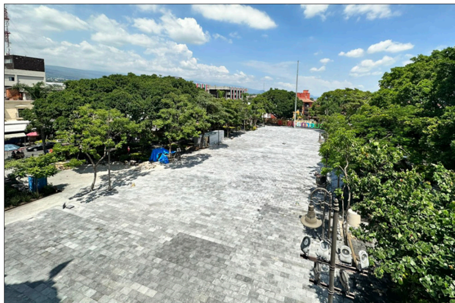
◀ El próximo domingo se comenzará a retirar la tapia perimetral.

Se enfatiza que no existe riesgo alguno de un nuevo desprendimiento o hundimiento en el área, como se temía en un principio.