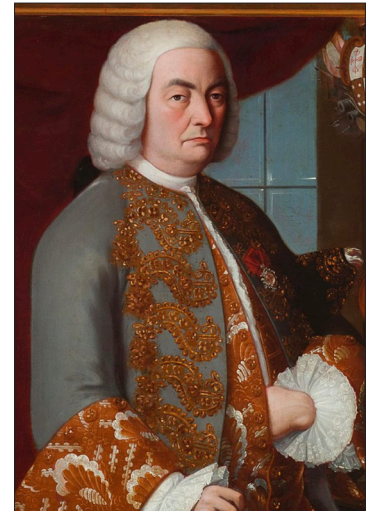
▲ Marqués de las Amarillas.

Entre los virreyes destacados, no se puede pasar por alto al cuadragésimo segundo, el Teniente General Agustín Ahumada y Villalón, Segundo Marqués de las Amarillas, quien nació el 18 de septiembre de 1700 en Ronda, Málaga. El Marqués de las Amarillas tuvo una destacada carrera militar en la cual por riguroso escalafón y méritos en campaña alcanzó el generalato llegando a ser Gobernador y Comandante Militar de Barcelona. Hombre cercano y apreciado por la Corona fue designado Virrey de la Nueva España el 17 de mayo de 1755. Una vez establecido en la Ciudad de México, actuó con energía en la administración virreinal donde puso freno a la corrupción en instancias de gobierno, en hospitales, en la administración de la Nao de China