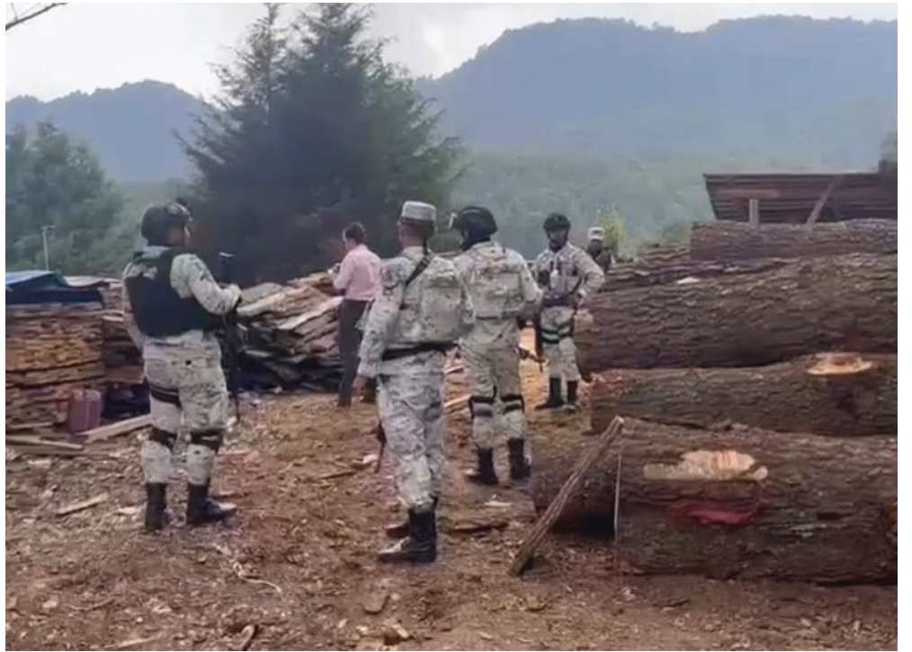
▲ Los operativos contra los aserraderos clandestinos continúan en Huitzilac.

Es relevante destacar que desde el mes de agosto hasta la fecha, las autoridades federales han logrado desmantelar 17 aserraderos clandestinos en el municipio de Huitzilac, ubicado al norte de la capital del estado de Morelos.