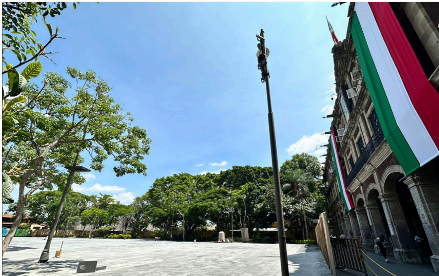
▲ La Plaza de Armas se abrirá al público el próximo 13 de septiembre, a tiempo para el tradicional Grito de Independencia. Las obras tuvieron un costo de 12 millones 837 mil 600 pesos y mantuvieron cerrado el espacio alrededor de cuatro meses. Foto: gobierno del Estado / ANGÉLICA ESTRADA / P 9

Confirman reapertura de la Plaza de Armas para los festejos patrios