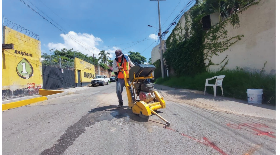
▲ Entre los trabajos previstos están el trazo y la nivelación de 460 metros lineales, excavación, suministro y la colocación de 460 metros lineales de tubería de 76 cm de diámetro y la construcción de pozo de visita común.