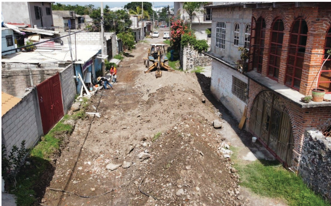
▲ Importantes obras para el beneficio de la población se siguen realizando en Jiutepec.