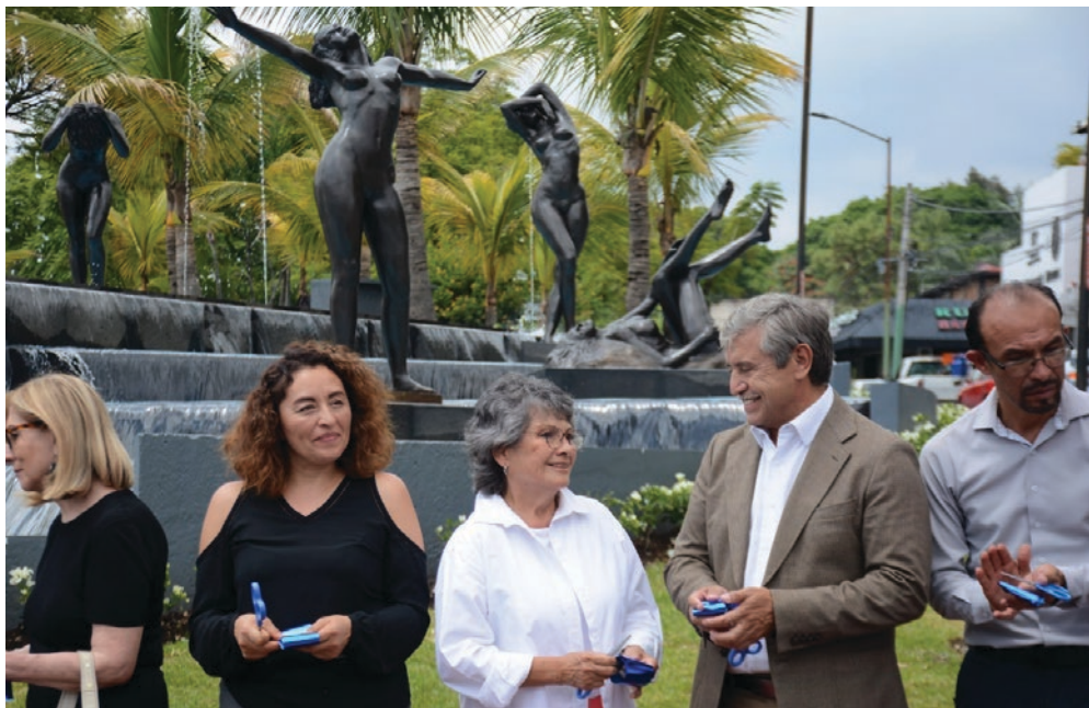
▲ A través de un trabajo coordinado entre la Secretaría de Desarrollo Sustentable y Servicios Públicos, de la iniciativa privada y sociedad civil se llevaron a cabo trabajos de restauración de este importante grupo escultórico.