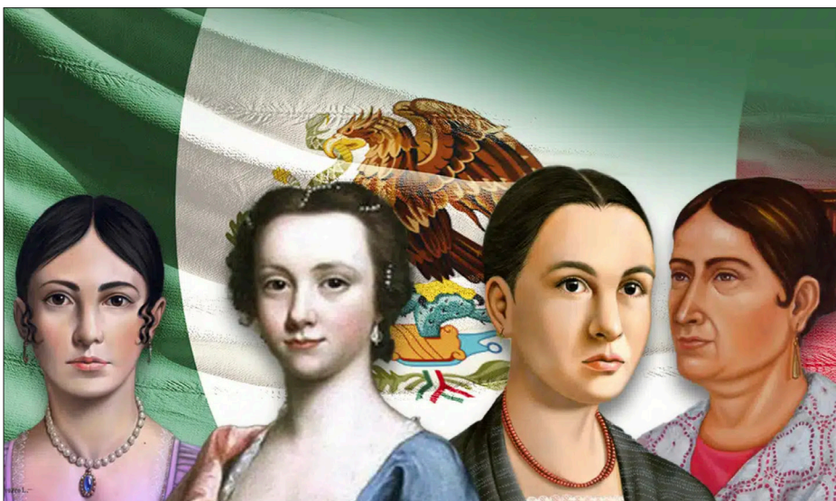
▲ Mujeres de la Independencia de México.

**Comunicadora Independiente de Ciencia y miembro de la Red Mexicana de Periodistas de Ciencia.