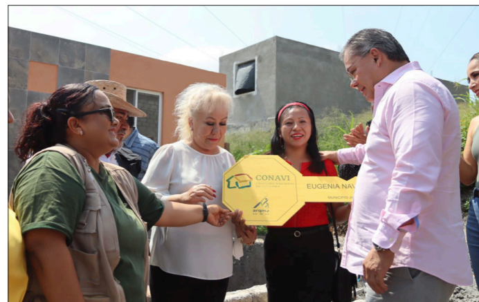
◀ 35 familias más se encuentran a la espera de que CONAVI Y SEDATU, a través de diferentes constructoras, concluyan los trabajos.