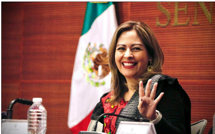
► Habrá mayor facilidad en los vuelos de conexión y servicios aéreos de mejor calidad en beneficio de usuarios, asegura la senadora Lucy Meza.