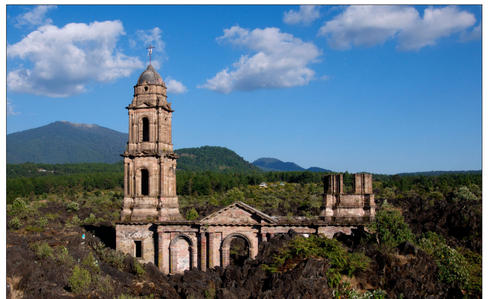
▲ San Juan Parangaricutiro.

Excepcional la construcción del proyecto de desarrollo asumido y emprendido por los comuneros de Nuevo San Juan para resurgir literalmente desde las cenizas, desafortunadamente en los últimos años, estando en Michoacán, han padecido el acoso de la delincuencia organizada y también el fantasma de la corrupción se asoma desde otros órdenes de gobierno.