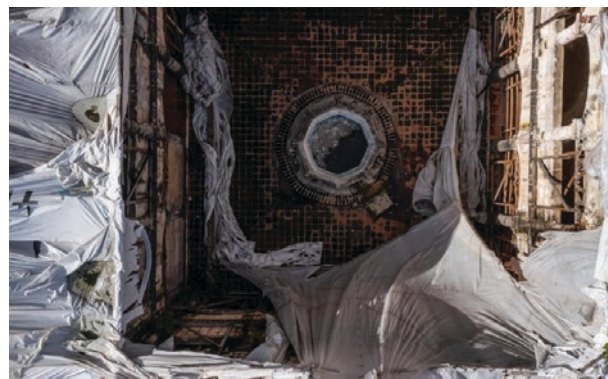
▲ Templo y ex Convento de la Asunción de Nuestra Señora en Tochimilco, Puebla.

Lo que no se sabe es cuándo y de dónde saldrán los 13 millones de pesos que hacen falta para su restauración, cifra que para estos días ya habrá quedado corta después de casi seis años de erosión.