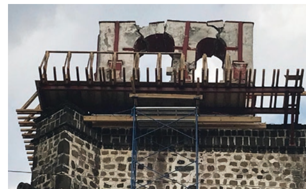
▲ Templo y ex Convento de la Asunción de Nuestra Señora en Tochimilco, Puebla.

En el Templo de la Asunción de Nuestra Señora, en Tochimilco, tuvieron que hacer un estudio de resistencia del subsuelo antes de desplegar, de piso a techo, una inmensa telaraña metálica que cubre toda la nave interior de la iglesia.