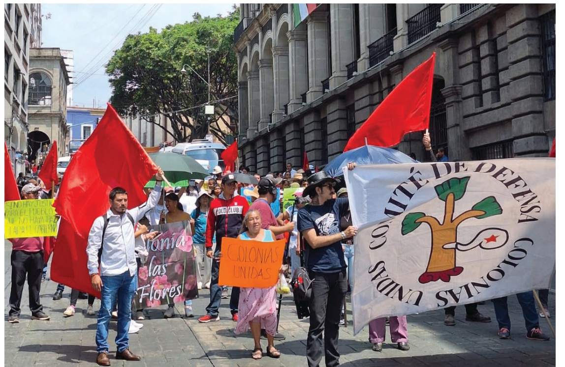
▲ Los manifestantes solicitaron de mesas de diálogo para acelerar la respuesta a sus peticiones.

rantizar que las autoridades actuales y futuras atiendan las demandas y necesidades del pueblo. Además, esto permite que participen en la discusión democrática del presupuesto para el año 2024”, agregó Torres.