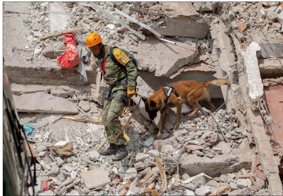
▲ 19 de septiembre, 2017.

En la misma línea de reflexión sobre la fragilidad de la vida misma, no debida a posibles y probables accidentes ocurridos en nuestra cotidianidad, sino a accidentes