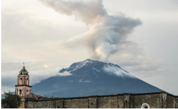
▲ Templo y ex Convento de la Asunción de Nuestra Señora en Tochimilco, Puebla.

Piezas arquitectónicas únicas, los 15 conventos construidos entre 1533 y 1570 a las faldas del volcán Popocatepetl fueron declarados por la Unesco como Patrimonio de la Humanidad en reconocimiento a su aportación única al conocimiento de una época de la historia.