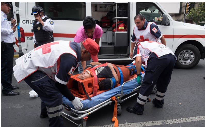
◀ Por la inseguridad, la Cruz Roja debe esperar que llegue la policía para atender algunas emergencias.