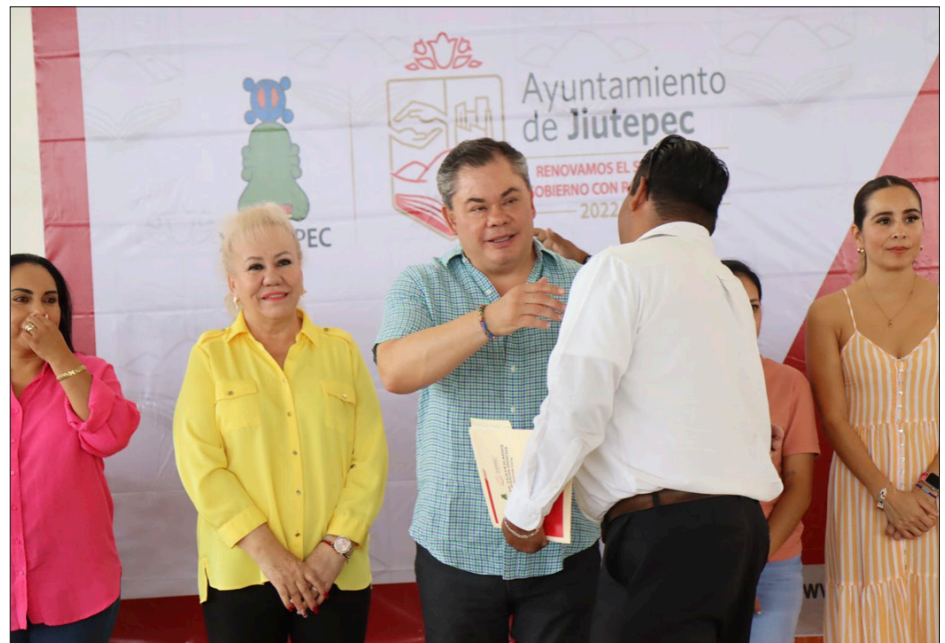
▲ El presidente municipal reconoció la labor que desempeñan diariamente los operadores de vehículos destinados a los servicios de transporte público.