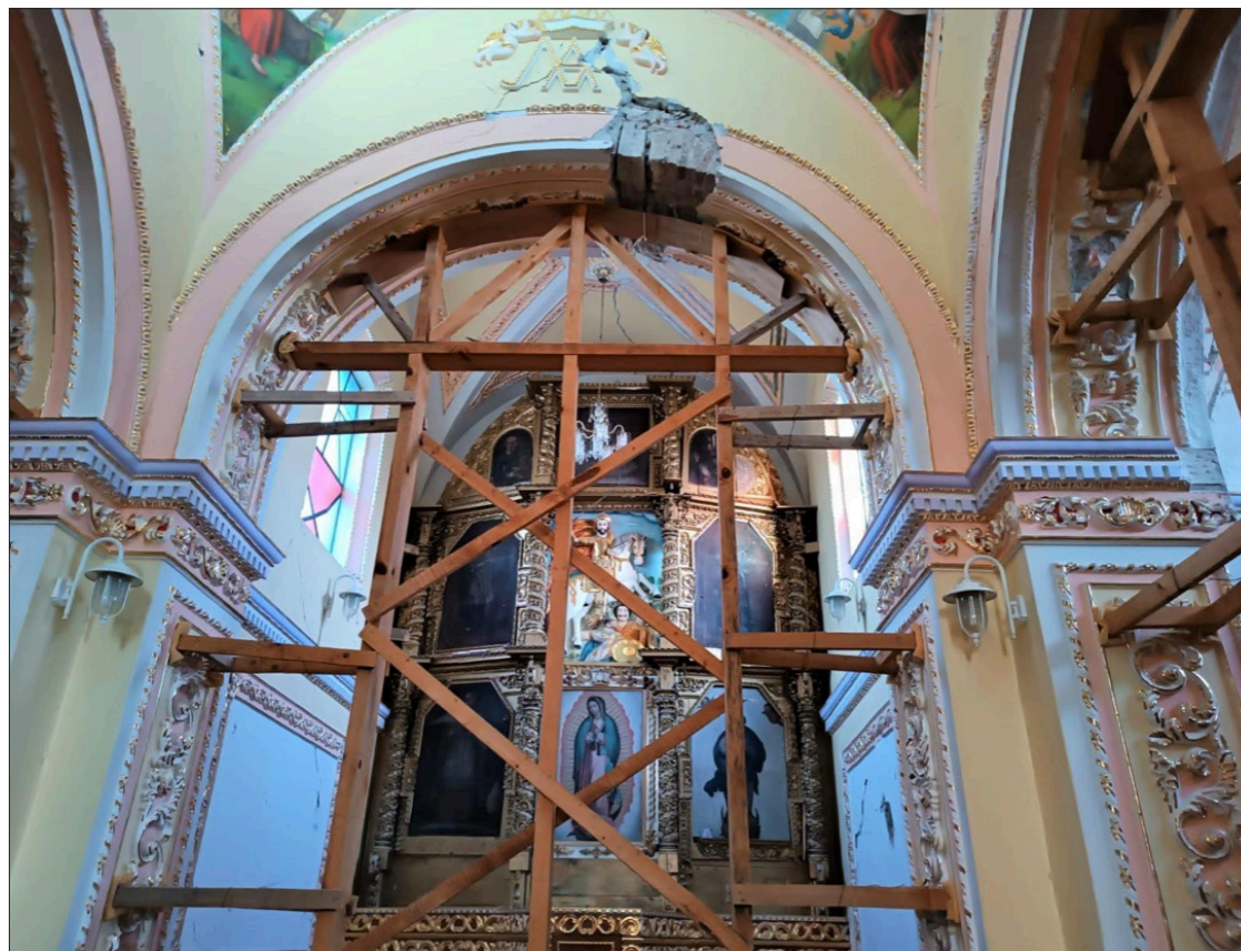
▲ Templo Parroquial de Santiago Apóstol, Atzitzihuacán, Puebla.

mán también se quejó de los arquitectos peritos que trabajaban en la sección de monumentos históricos. Ellos no cooperaban, escribió, “por miedo a que se afecten sus intereses personales”.