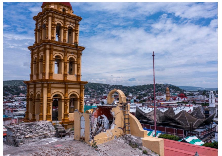
► Templo y ex convento de Santo Domingo de Guzmán, Izúcar de Matamoros, Puebla.

ra decirles que su objetivo era hacer cumplir las normas y salvaguardar el patrimonio del estado de Puebla. Su misión la resumió con una frase: “combatir lo que está mal”.