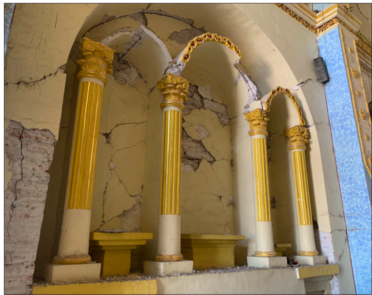
▲ Templo de Santa María Cohetzala, Puebla

no es cosa menor. “El proyecto recopila toda la información necesaria para la toma de decisiones; los estudios, levantamientos arquitectónicos, las causas y mecanismos del colapso”, reconoció Valeria Valero, coordinadora nacional de Monumentos Históricos del INAH, durante su participación en la mesa “Sismos y Patrimonio Cultural: Balance de su Restauración”, realizada en septiembre de 2019.