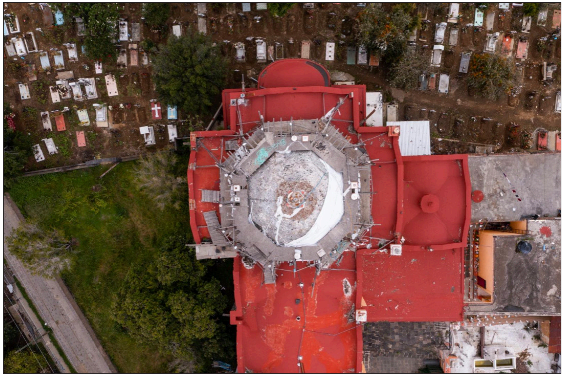
▲ Templo de Santiago Apóstol en Atzala, Puebla.