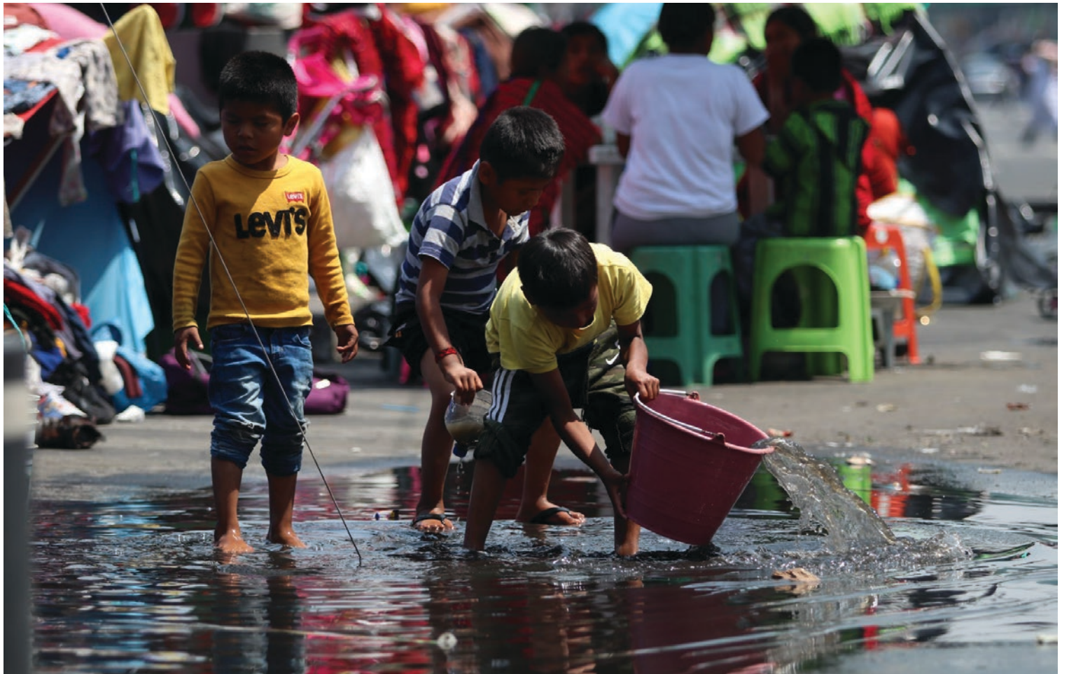
▲ Galo Cañas / cuartoscuro.com

Hernández Cruz informó que el Ayuntamiento de Cuernavaca está lanzando un programa de becas que se discutirá este jueves para aprobar la convocatoria. El objetivo es que los estudiantes interesados puedan participar y no abandonen sus estudios, especialmente en el nivel básico. El monto autorizado por el cabildo para este programa asciende a tres millones de pesos.