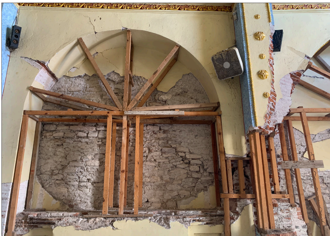
▲ Templo de Santa María Coetzala, Puebla

Quinto Elemento Lab es una organización periodística independiente, sin fines de lucro, que alienta y realiza reportajes de investigación en México. Para ver la serie completa de “Patrimonio en ruinas” puedes visitar https://quintoelab.org/patrimonio-en-ruinas