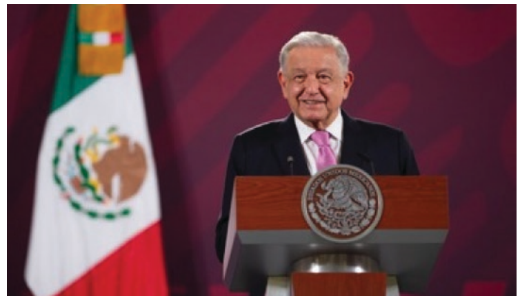
▲ El Presidente de la República aseguró que se debe combatir la corrupción en el Poder Judicial.

estoy diciendo, pero no me puedo quedar callado. También, no se deberían de quedar calladas las organizaciones de abogados, los colegios de abogados, las barras. Entonces, ¿dónde está el derecho?"