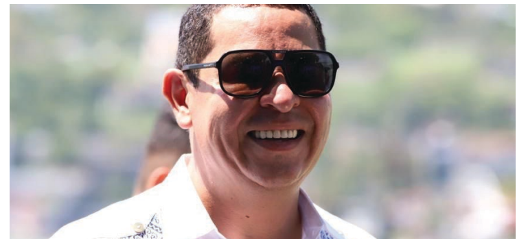
▲ Sostiene alcalde de Jojutla encuentro con directoras de Institutos de la Mujer en Morelos.

El edil también compartió orgulloosamente que Jojutla es uno de los pocos municipios, sobre todo poblacionalmente hablando, que no tiene alerta de género, lo que lo ubica como una zona segura para todas las mujeres. Además, destacó que no se tienen feminicidios