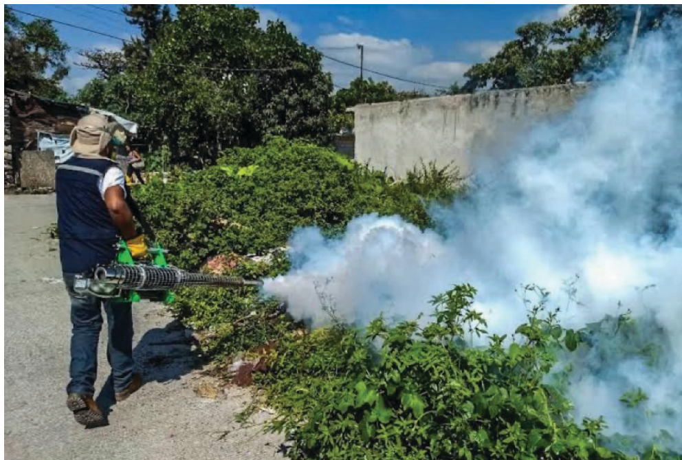
▲ Por inseguridad, vecinos desconfían de los operativos contra el dengue.

Cantú Cuevas señaló que en Morelos circulan los cuatro serotipos del dengue, lo que resalta la importancia de no bajar la guardia y tomar medidas preventivas contra las enfermedades transmitidas por vectores, que incluyen también el zika y la chikungunya.