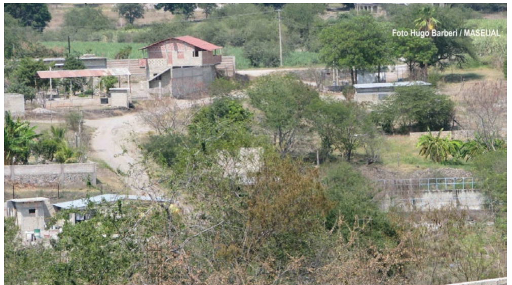
▲ La zona de barrancas invadida en la Unidad Morelos de Jojutla.

En las reuniones que han tenido con autoridades locales y estatales en más de 20 años, se desprende que nunca podrán tener un título de propiedad en dichos terrenos que fraccionaron ellos mismos con el respaldo de su sindicato azucarero, porque lo hicieron en barrancas y tendrían que hacer un cambio de uso de suelo y éste nunca podría darse por lo mismo que son barrancas, no aptas para construir.