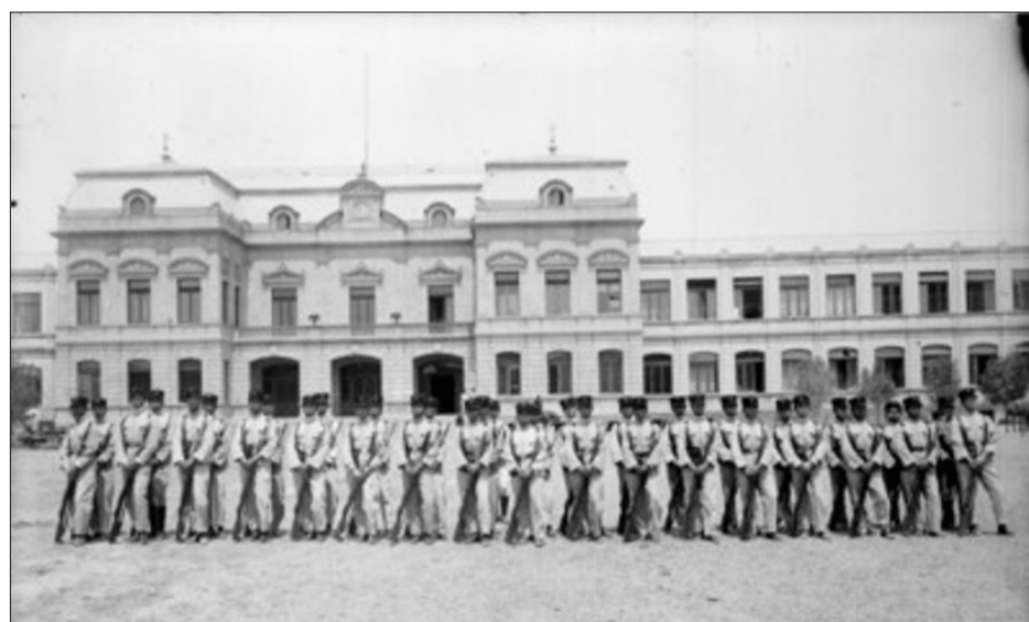
▲ Colegio Militar de Popotla.

El caso de Irán, entre otros, nos muestra el gravísimo error de darles más y más poder a los militares, confianza, y excesivos salarios. Su "espíritu de cuerpo", definitorio, no les da para hacer de él un "espíritu de patria, patria, fraternal".