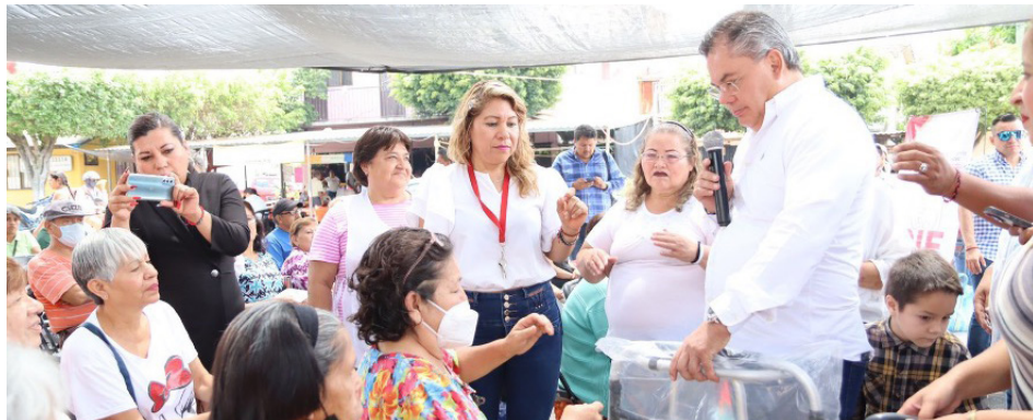
▲ Durante la entrega de víveres alimentarios, así como bastones y andaderas, el presidente municipal resaltó que en todo momento se buscan los mecanismos necesarios para apoyar a los habitantes de los diferentes centros de población.