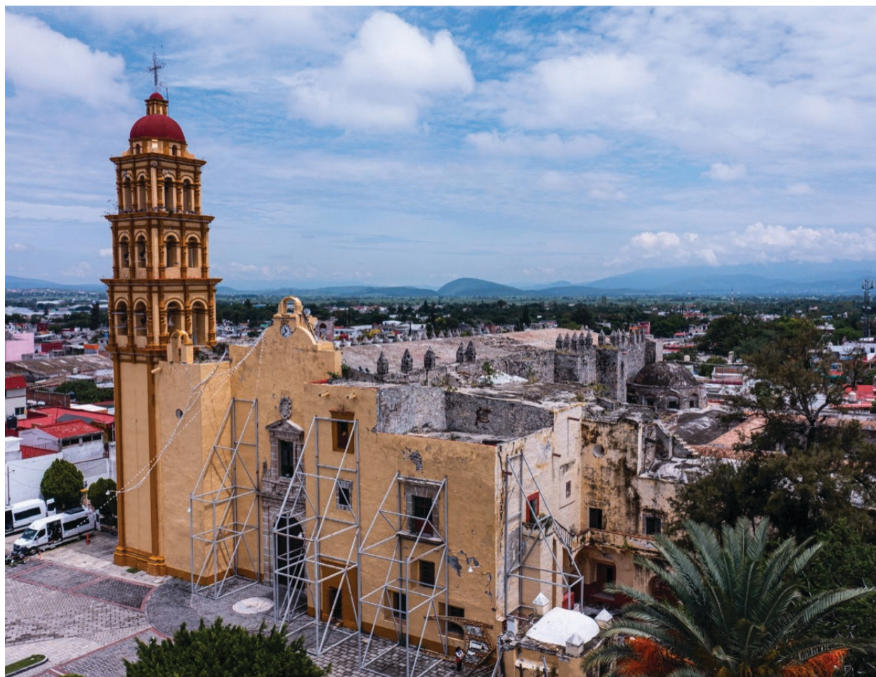
▲ Templo y Ex Convento de Santo Domingo de Guzmán en Izúcar de la Matamoros, Puebla. Foto: Christian Palma Montaño. Foto: Christian Palma Montaño.

“Tal fue la gloriosa acción de Izúcar que Morelos aumentó su fama y multiplicó el terror de sus enemigos”, relató Bustamante en su Cuadro histórico de la revolución de la América mexicana .