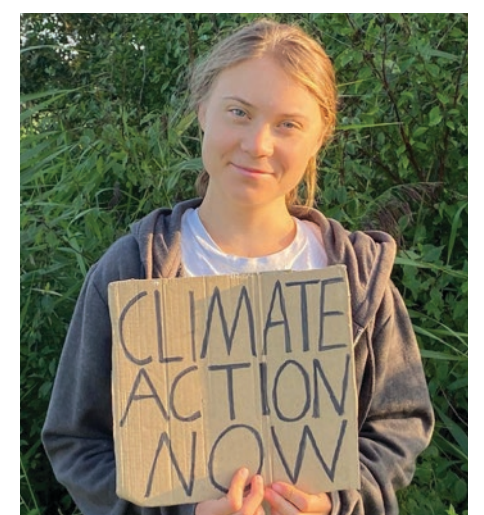
▲ Greta Thunberg, 2023.

Septiembre se ha convertido en el mes de las movilizaciones mundiales contra el cambio climático. Este año, del 15 al 17 de septiembre se ha convocado a la sociedad en general a participar en la lucha global para poner fin al consumo de combustibles fósiles, carbón, gas y petróleo. El 17 de septiembre se convocó en Nueva York a