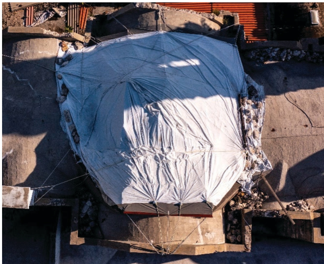
▲ Izúcar de la Matamoros, Puebla.

“El mundo conoció Atzala por un hecho trágico: (con la caída de la bóveda) falleció la niña, toda la familia y algunos invitados. En total 12. Se salvaron el párroco de la iglesia, el papá de la niña y el sacristán. Llegaron medios de comunicación de todo el planeta. Ahora estamos en el total abandono”, apunta René Reyes, cronista de la entidad.