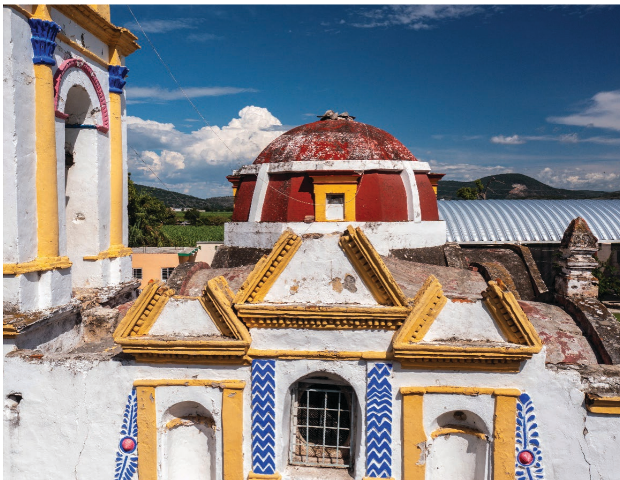
▲ Izúcar de la Matamoros, Puebla.

El terremoto fracturó su torre y abrió grietas en su bóveda y muros. “Hace cinco años el daño era moderado,