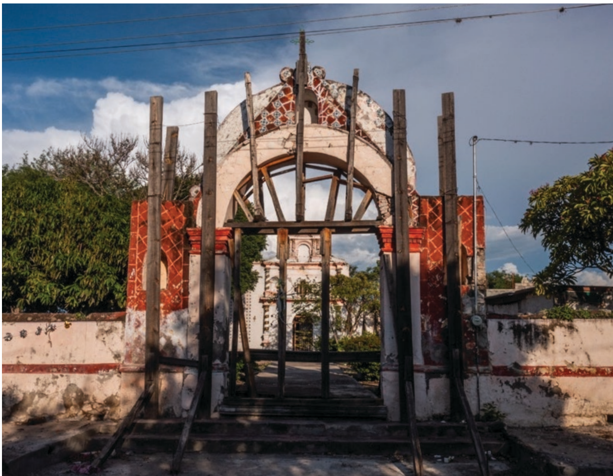
▲ Templo de Santiago Apóstol en Mazatla, Izúcar de Matamoros.