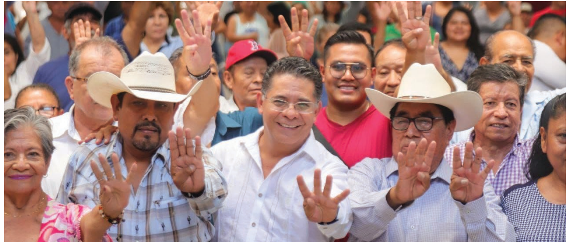
▲ El Coordinador General de Política y Gobierno de la Presidencia de la República se reunió con representantes de sectores productivos a quienes habló de las bondades de su estrategia.