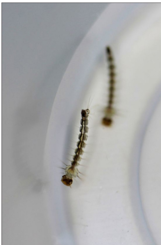
▲ Larva del Aedes aegypti .

"Creo que, dentro de lo que cabe, estamos avanzando bien, pero lamentablemente ya ha habido fallecimientos en Cuernavaca y en otros municipios más afectados que se encuentran en la zona sur, donde hay más agua y vegetación", concluyó.