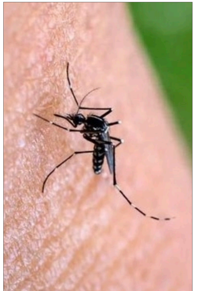
▲ Para comprender la dinámica de transmisión de vectores, como el mosquito ' aedes aegypti ', que transmite el dengue, zika y chikungunya, es viable el uso de drones.