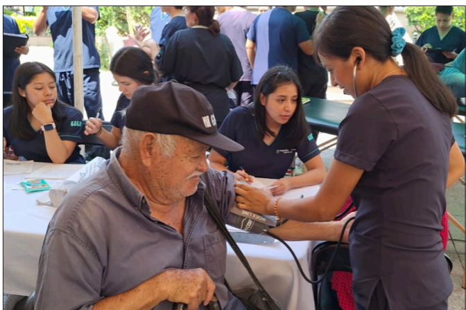
◀ En la Feria de la Salud de Jiutepec se ofrecen estudios de laboratorio gratuitos, exámenes de la vista, asesorías nutricionales, tomas de glucosa, revisiones dentales y consultas de terapia holística.