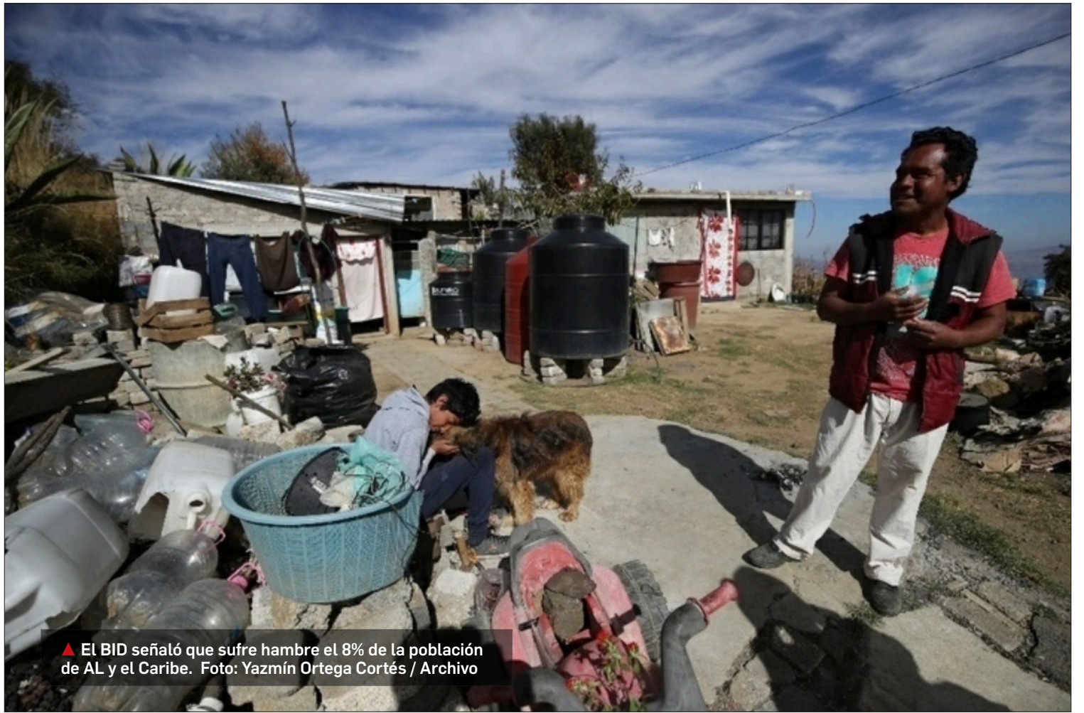
▲ El BID señaló que sufre hambre el 8% de la población de AL y el Caribe.