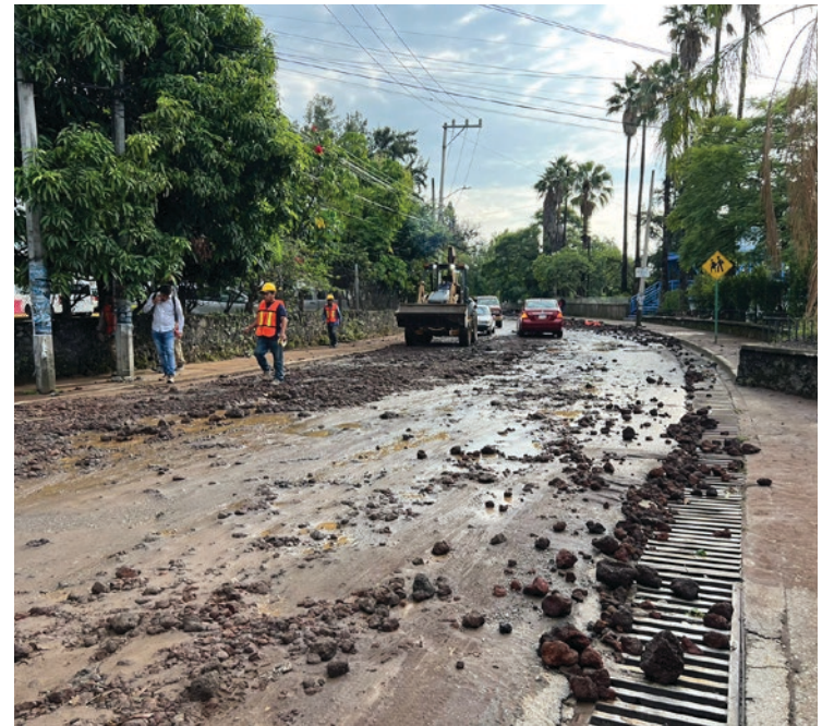
▲ Las lluvias han retrasado las obras en Av. Universidad. Foto: Ayuntamiento de Cuernavaca. Foto: Ayuntamiento de Cuernavaca.

El pasado 12 de septiembre, la Secretaría de Desarrollo Urbano y Obras Públicas de Cuernavaca inició los trabajos de reparación y sustitución del drenaje en la Avenida Universidad, en la zona norte de la capital.