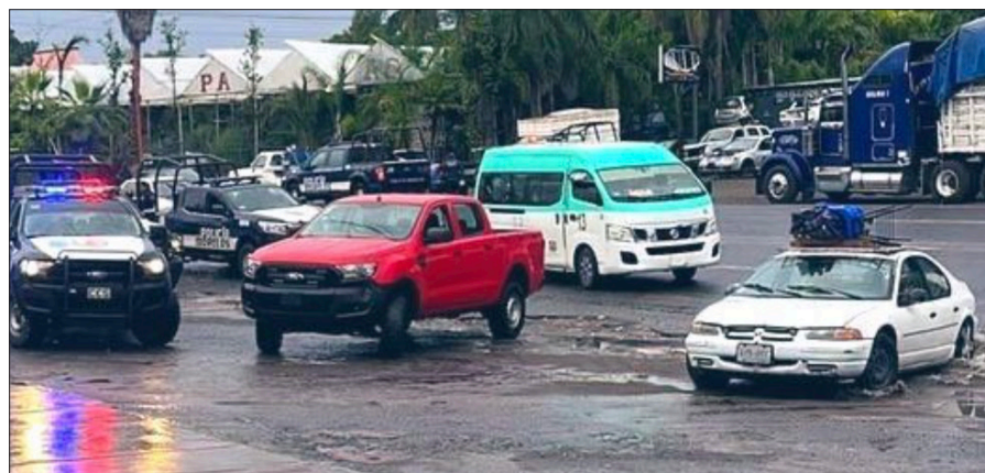
◀ Los agentes fueron interceptados por individuos que viajaban en una motocicleta, quienes abrieron fuego en su contra.

Al lugar acudió personal de la Fiscalía del Estado, así como de la Policía Morelos, quienes se desplegaron en la zona para la localización de los responsables de estos actos de violencia.