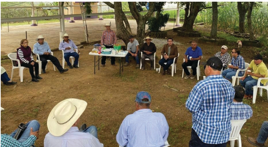
▲ El alcalde con licencia enfatizó que se invertirá en la reparación y construcción de estas vías como parte de su proyecto de transformación segura para el pueblo morelense.