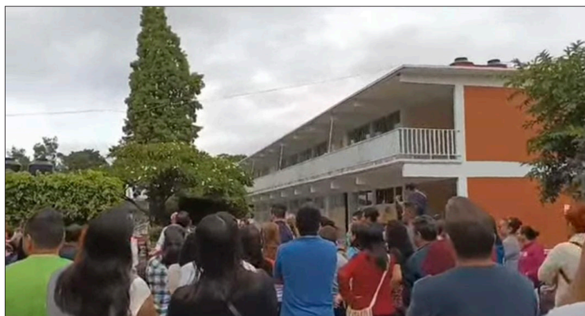
◀ Madres y padres de familia de la Escuela Secundaria Técnica No. 18 se reunieron con las autoridades del plantel para evaluar la seguridad.