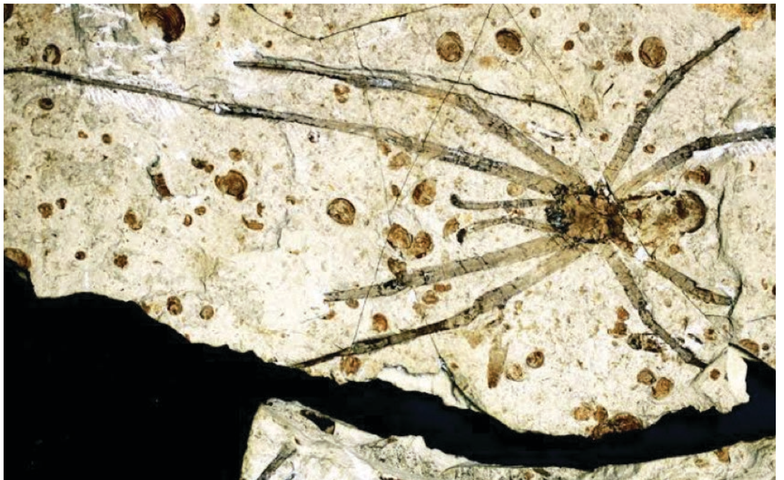
▲ Hasta ahora se han descrito más de 20 nuevas especies fósiles de arácnidos e insectos que se extinguieron hace millones de años.

Riquelme Alcántar también trabaja en el estudio de la macroevolución, es decir, el análisis de artrópodos a gran escala, incluyendo su descripción, clasificación, ordenación, comportamiento, distribución y procesos evolutivos en períodos y lugares geológicos específicos.