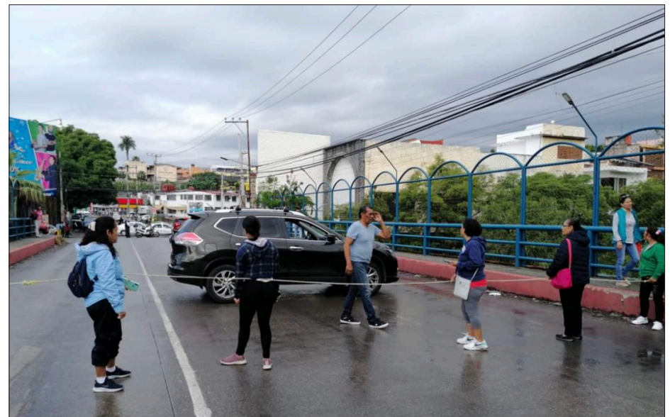
▲ El tráfico se vio afectado en diversos puntos de la ciudad. Los vecinos se quejan de que ya tienen casi una semana sin agua.

Debido a estas protestas, el tráfico se vio afectado tanto en el centro de Cuernavaca como en la parte norte de la capital estatal. Los vecinos de estas cuatro colonias continúan sin acceso al líquido.