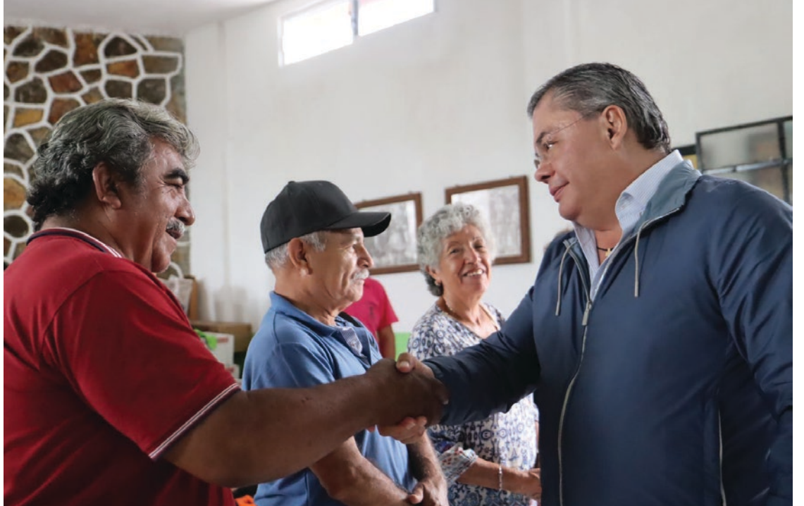
▲ Para la adquisición de estas herramientas, se utilizaron cien mil pesos del Fondo de Aportaciones Estatales para el Desarrollo Económico (FAEDE) del ejercicio fiscal.