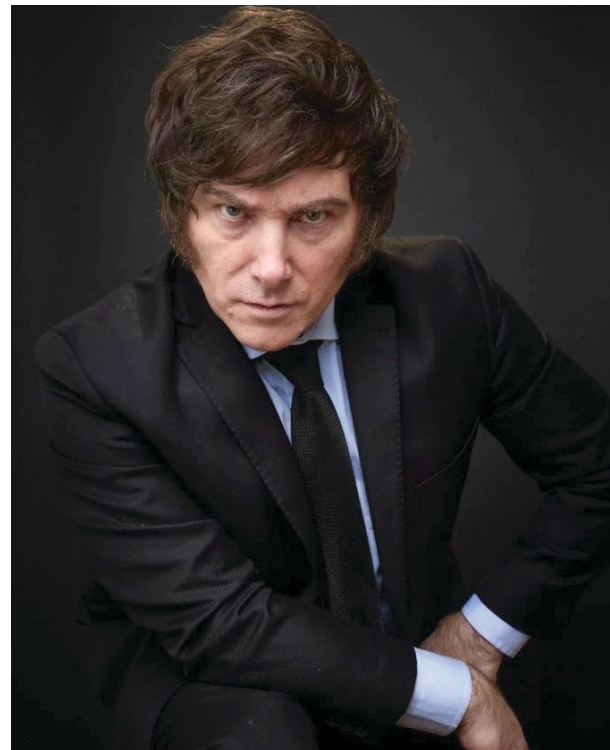
▲ Javier Milei, político argentino.

Milei ha abrevado del ciberespacio y las redes sociales. Sus discursos se transmiten en vivo por las redes sociales, en donde sus fervorosos seguidores escuchan sus invectivas. Contradictorio y provocador, sus discursos son un cóctel explosivo de populismo, de liberalismo extremo y de posturas antisistema, que le sirven de coraza para prometer acabar con la corrupción, la inflación, el Estado intervencionista y las llamadas políticas progresistas.