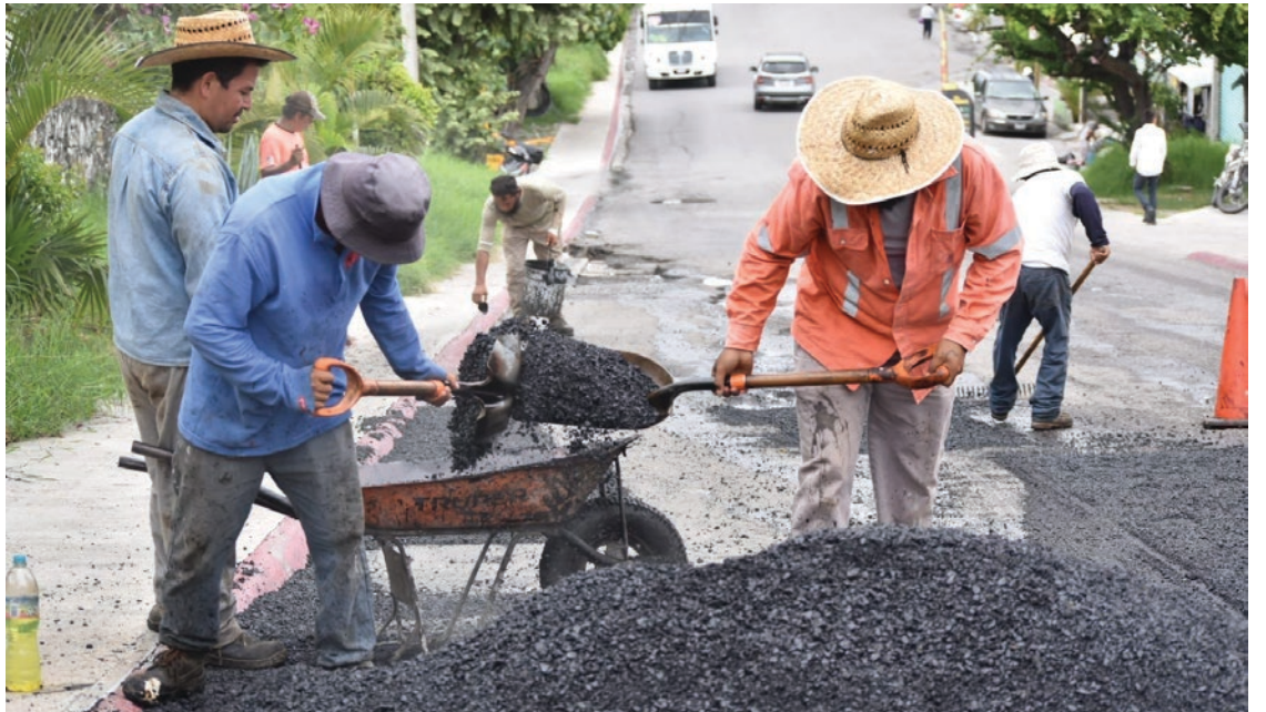
▲ Los trabajos de bacheo se realizan de forma continua de lunes a viernes, en un horario de 9:00 a 15:30 horas.

De acuerdo con la Encuesta Nacional de Seguridad Pública Urbana del INEGI, con fecha 19 de julio de 2023, uno de los problemas más significativos en las ciudades del país son los baches en calles y avenidas. Por lo tanto, el Gobierno de Jiutepec trabaja arduamente para abordar esta situación.