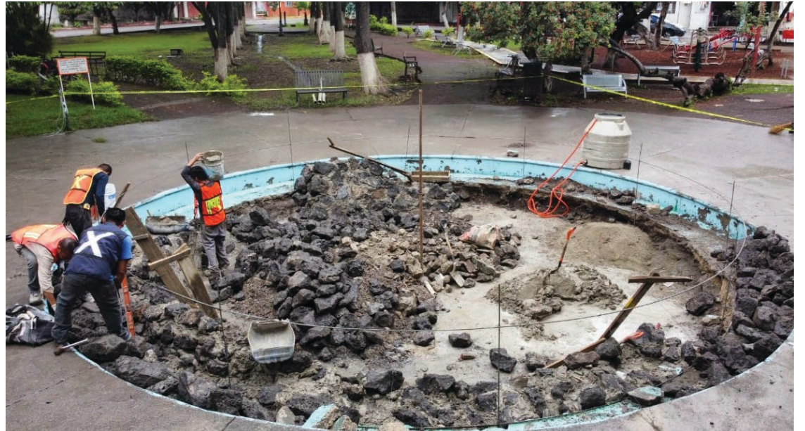
▲ En lo que va del año, la administración municipal ha llevado a cabo 26 obras con una inversión de 56 millones 829 mil pesos.