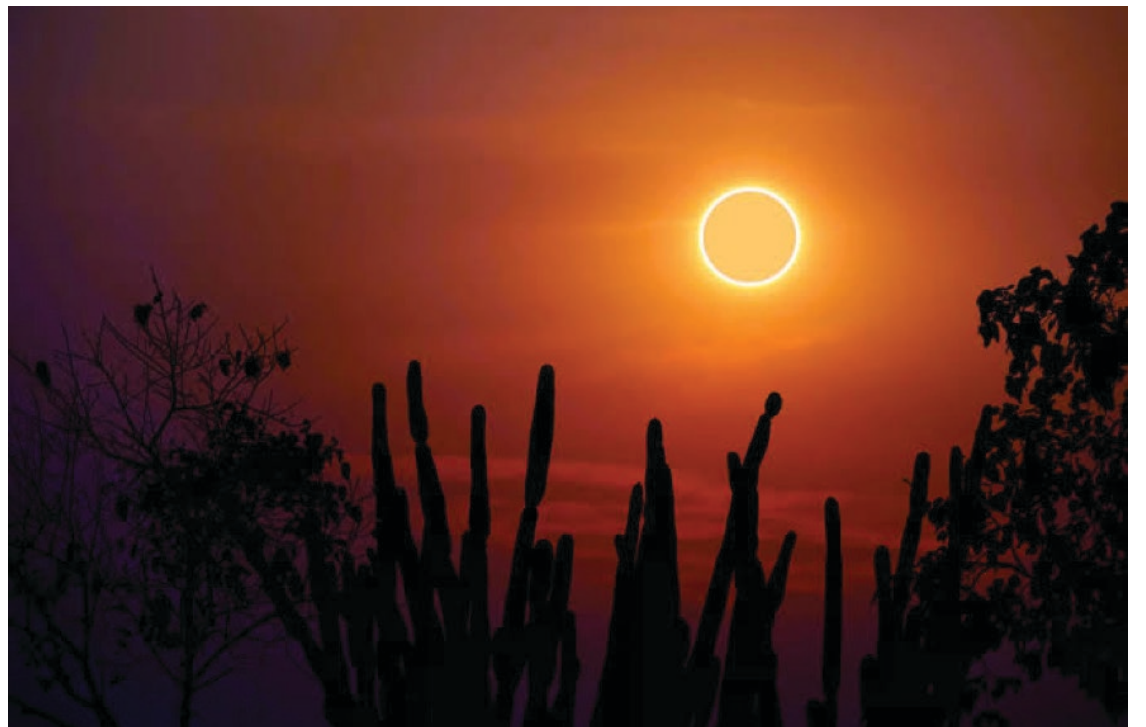
▲ En Morelos veremos un eclipse parcial de sol el próximo 14 de octubre.

Centro de Investigación en Ingeniería y Ciencias Aplicadas CIICAp, UAEM: El CIICAp de la Universidad Autónoma del Estado de Morelos llevará a cabo el evento "Observación del Eclipse Lunar de Sol" a partir de las 8:30 a 13:00 horas. En el evento se llevará a cabo la observación con telescopio, música, juegos, manualidades, actividades científicas y venta de alimentos. La entrada es gratuita.