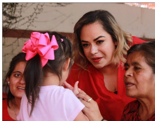
▲ La legisladora del Partido del Trabajo señaló muchas niñas todavía enfrentan obstáculos significativos relacionados con la educación, la salud, la igualdad de oportunidades.

Finalmente, compartió su compromiso de continuar impulsando cursos de empoderamiento para mujeres, donde algunas de ellas son acom-