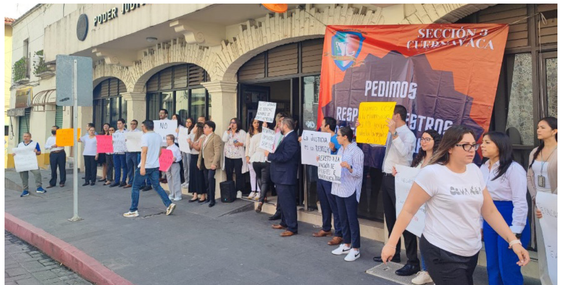
▲ En contra de la cancelación de fideicomisos y del recorte presupuestal, se manifestaron en Cuernavaca trabajadores del Poder Judicial en Morelos.

Finalmente, añadió que, en caso de no recibir atención ni ser escuchados por las autoridades, se plantearía la posibilidad de llevar a cabo un paro a nivel nacional para evitar la reducción del presupuesto.