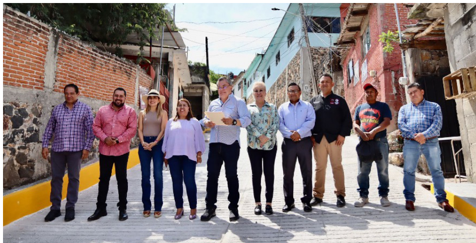
▲ Como parte del programa anual de obra pública 2023, en Jiutepec se realizan obras de infraestructura social en 16 centros de población del municipio.