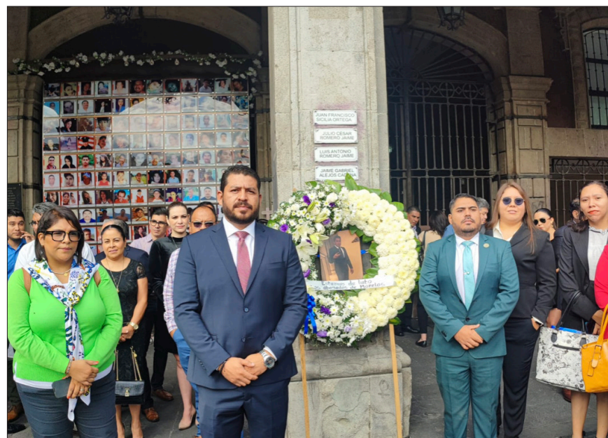
◀ Abogados integrantes de diversas barras y agrupaciones solicitaron al Poder Ejecutivo activar protocolos de seguridad por la violencia que afecta al gremio.

"Estoy firme con ella; hace un mes me reuní con Claudia (Sheinbaum) y le dije que estoy listo para apoyarla. Si quiere llevarme a los estados con ella o a la Ciudad de México, aquí estoy listo", concluyó.