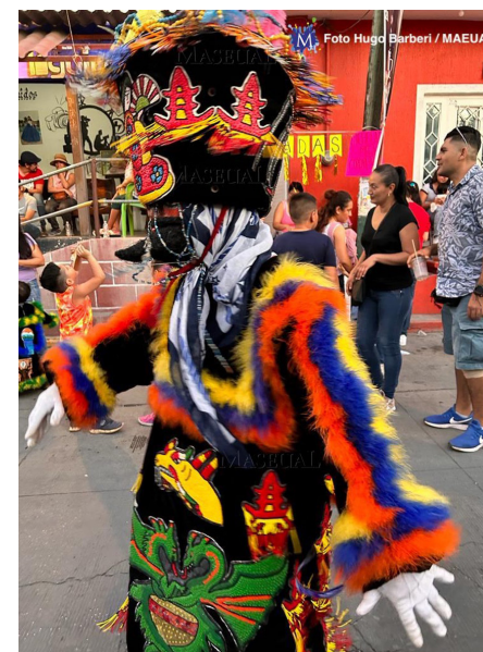
▲ Tlaltizapán tiene mucho que ofrecer al turismo y debe aprovechar su reciente nombramiento como Pueblo Mágico.

El concejal expresó su alegría por la noticia de haber sido reconocidos como "Pueblo Mágico", no obstante, también destacó que este nombramiento conlleva responsabilidades adicionales. Las autoridades están programando una reunión de cabildo para abordar el tema con el criterio de que no pueden ser un "pueblo mágico" si no se acompañan de servicios municipales, infraestructura vial y otros elementos complementarios esenciales.