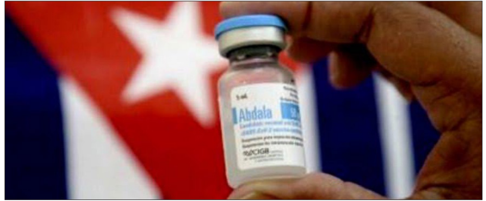
▲ La mayoría de las personas han expresado desconfianza en la vacuna Abdala debido a la falta de difusión e información por parte de las autoridades.