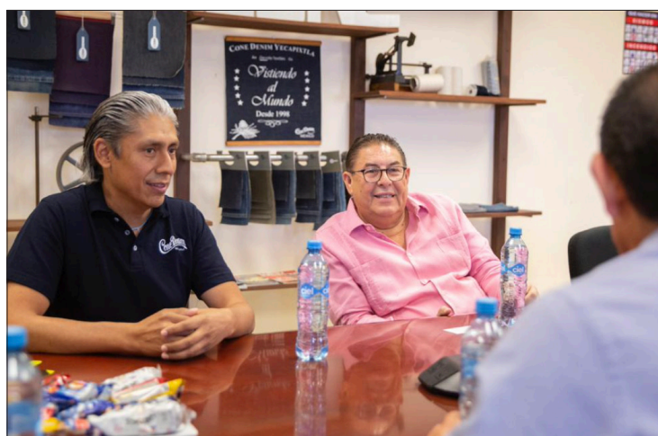
▲ El empresario subrayó la importancia del sector empresarial en el desarrollo económico del estado.

El empresario subrayó la importancia del sector empresarial en el desarrollo económico del estado y destacó la relevancia de contar con morelenses comprometidos en su impulso. Además, resaltó que estas empresas son de las más destacadas en Morelos en términos de exportación de productos agrícolas, textiles y alimentos.