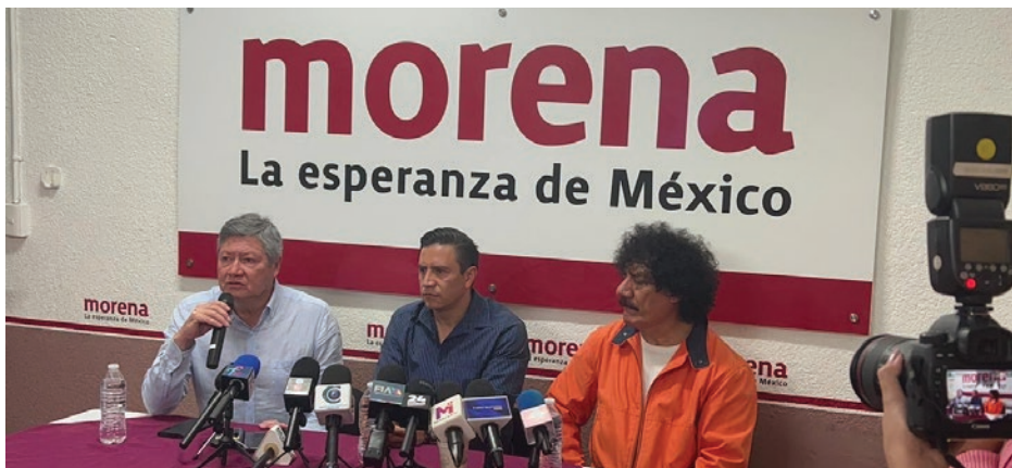
▲ Aseguraron que la gira de Claudia Sheinbaum no es un acto de campaña, sino actividades del propio partido para acercarse a la militancia.

Finalmente, se adelantó que en la visita de la exjefa de gobierno de la Ciudad de México a Morelos, se anunciarán adhesiones de figuras políticas al partido, sin precisar de quiénes se trata.