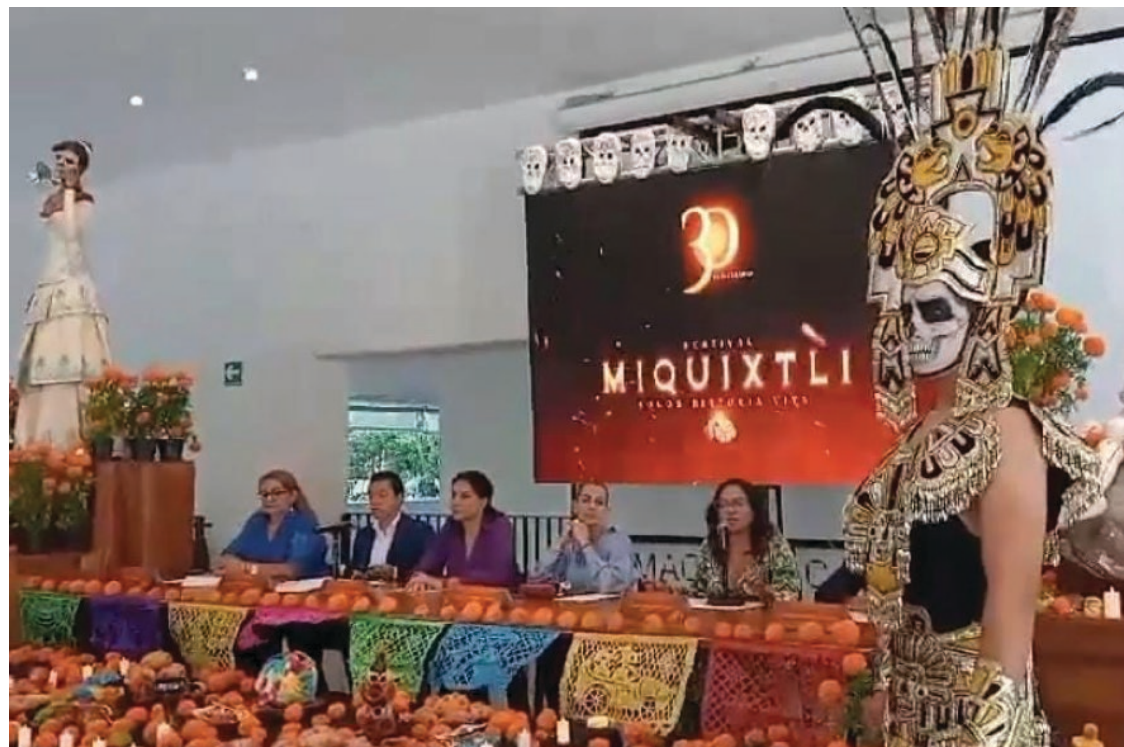
▲ El festival Miquixtli es significativo tanto por su importancia cultural como por su impacto turístico y económico, informaron

Además, habrá un amplio circuito de altares y ofrendas en todo el centro histórico de la capital, presentaciones artísticas en diversos escenarios distribuidos en varios puntos del centro, actividades infantiles en el Miquixtli infantil, ubicado en el Centro Cultural Infantil La Vecindad, y una variada oferta de actividades para público de todas las edades, que se podrá consultar a través de las páginas oficiales del festival.