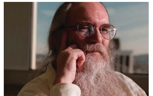
► Jonathan Bruce Postel.