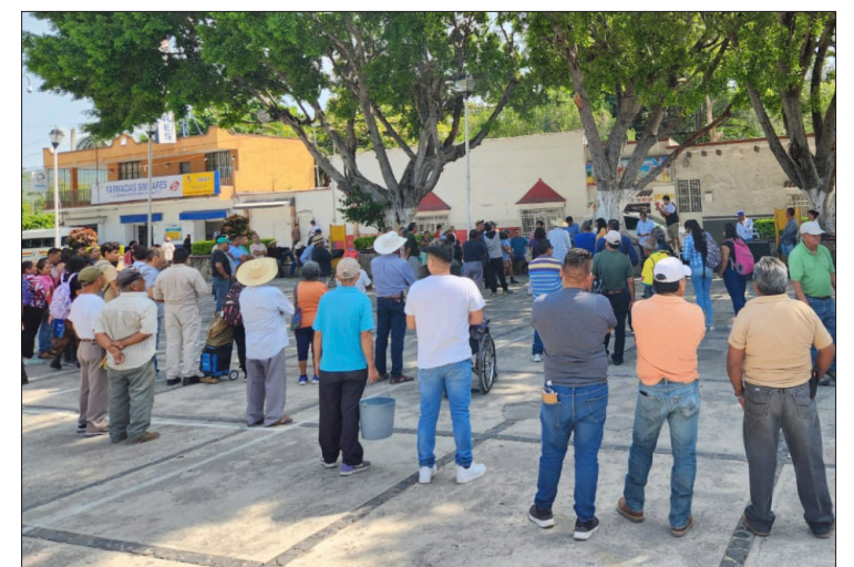
▲ La protesta busca que las autoridades escuchen y atiendan las iniciativas ciudadanas sin imponer proyectos que no han sido evaluados por la población, aseguraron los vecinos de Tlaltizapán.