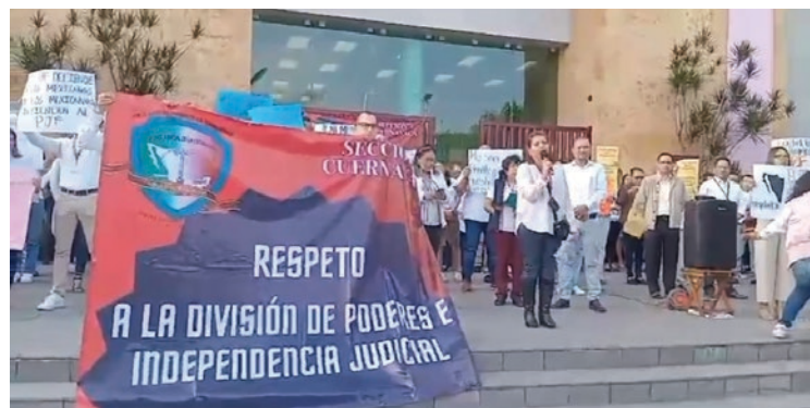
▲ Los trabajadores hicieron un llamado al Gobierno de la República a respetar sus derechos humanos y laborales.

El Gobierno Federal está considerando recortes presupuestales que podrían afectar a 14 fideicomisos, incluyendo apoyos relacionados con lentes, becas, transporte y otros aspectos.