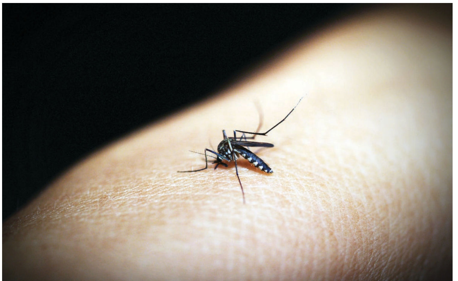
▲ Los mosquitos transmisores de dengue pueden proliferar en la vegetación y macetas, como las hay en los cementerios.

Según datos de la Dirección General de Epidemiología (DGE), se ha registrado el fallecimiento de 19 personas a causa de picaduras de mosquitos transmisores del dengue, y se han confirmado 1,392 casos de la enfermedad.