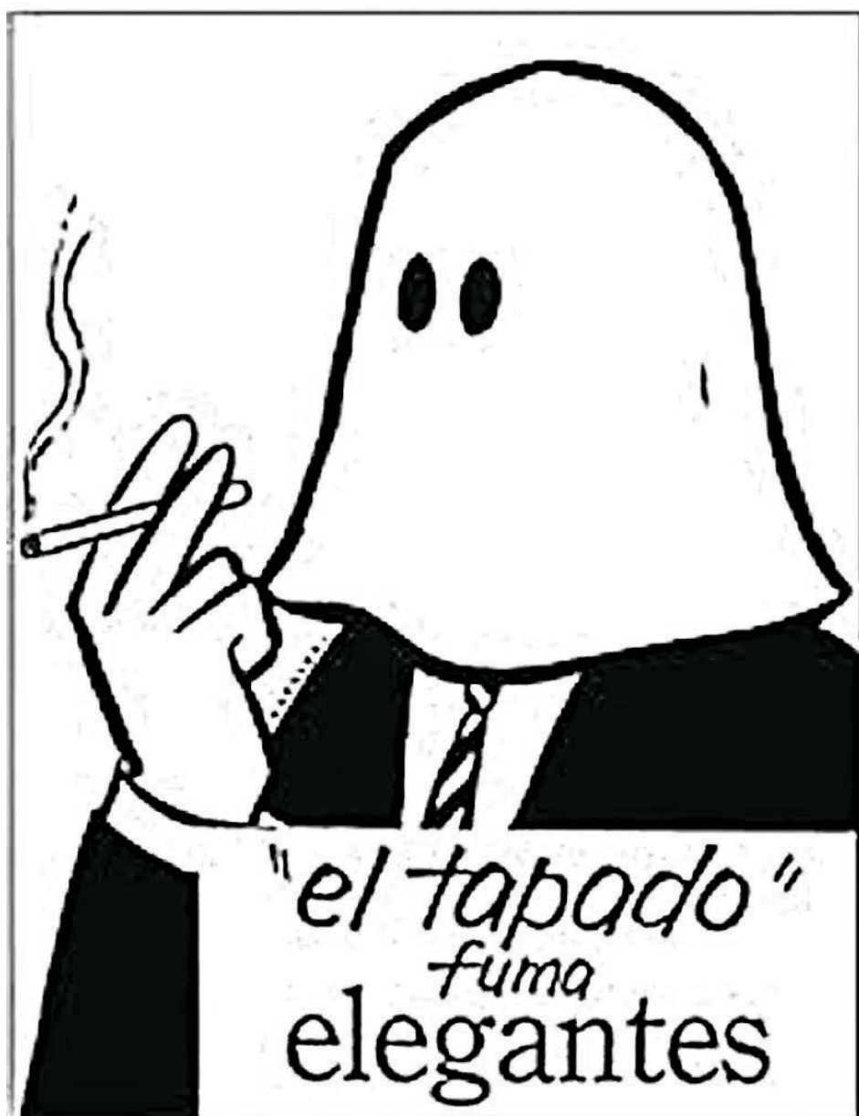
▲ El Tapado, Abel Quezada 1957.

Doce de las reglas expuestas por Luis Javier Garrido se han replicado en este proceso de definición de la candidatura presidencial. Sobre las tres últimas existen dudas de que puedan cumplirse. Es el caso de que, derivado de la inexperiencia de la candidata y de la personalidad del presidente, no exista disposición a compartir el poder durante estos meses venideros. Cuando las condiciones económicas o políticas no permitan dar continuidad puntual a la estrategia lópezobradorista, el presidente tal vez justifique las acciones gubernamentales. La naturaleza del hiperpresidencialismo mexicano, que se apoya en un líder carismático o caudillo, pudiera impulsar el deseo de López Obrador, ya siendo presidente, de incidir en la candidatura de su partido para el año 2030.