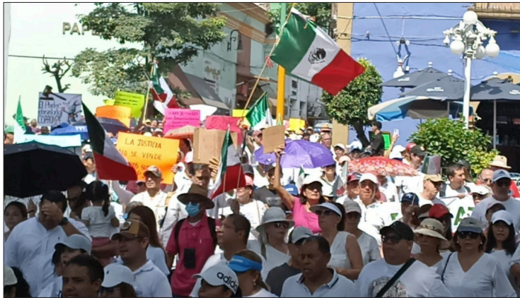
▲ Los manifestantes subrayaron que el recorte presupuestal y la extinción de fideicomisos no solo pone en riesgo los empleos de los trabajadores, sino que también afecta a la justicia y socava la confianza de la ciudadanía en el sistema legal.

Se subrayó que esta medida no solo pone en riesgo los empleos de los trabajadores, sino que también afec-