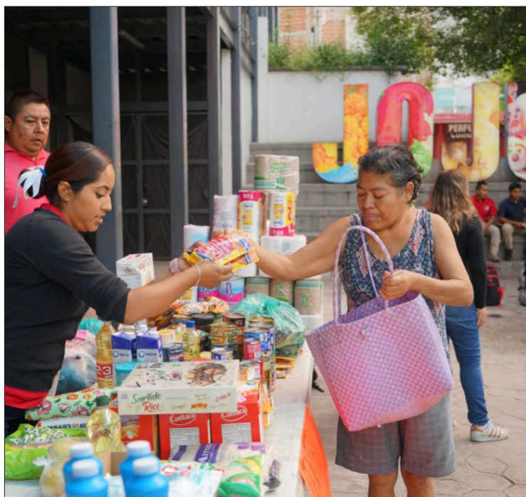
▲ Ya está en funcionamiento el centro de acopio de Jojutla.