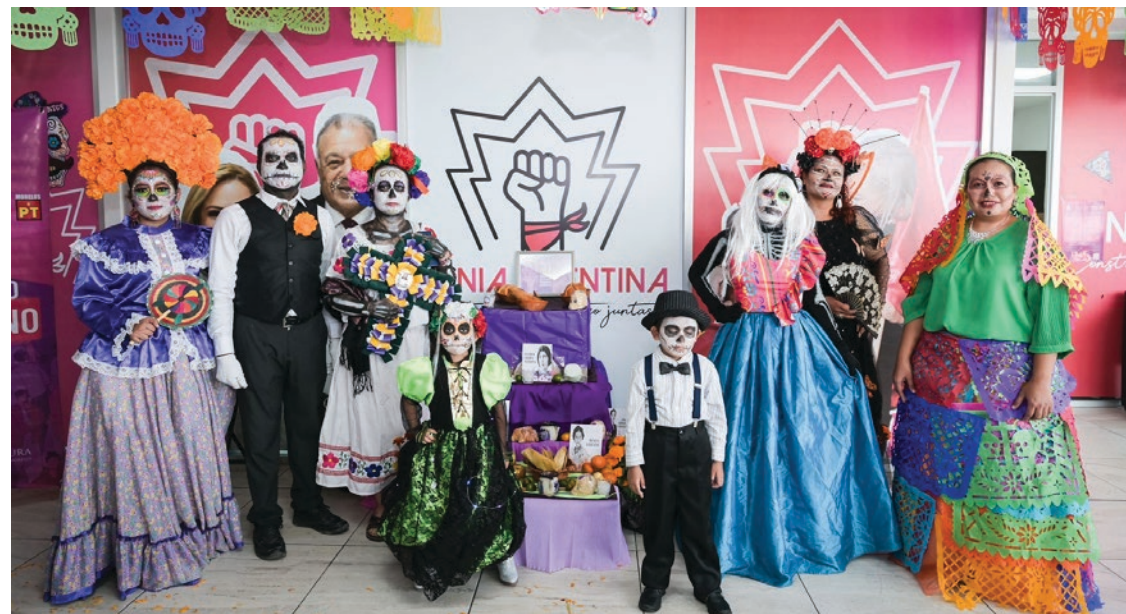
▲ La legisladora del Partido del Trabajo destacó que esta celebración rinde homenaje a las valientes mujeres que lucharon incansablemente por obtener el derecho al voto y la participación política.