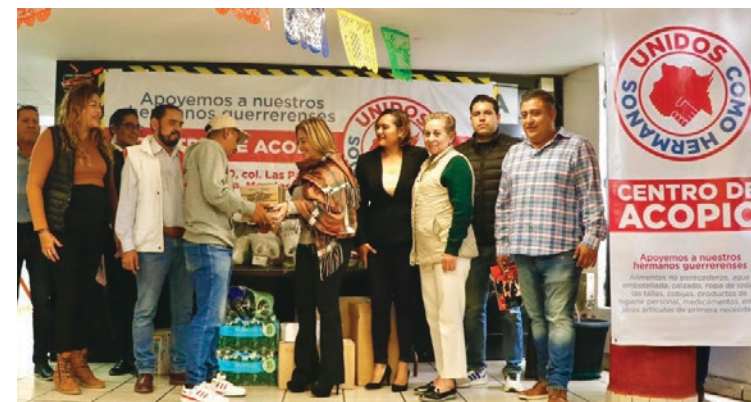
▲ La senadora Lucy Meza recibió personalmente las primeras donaciones por parte de los ciudadanos.