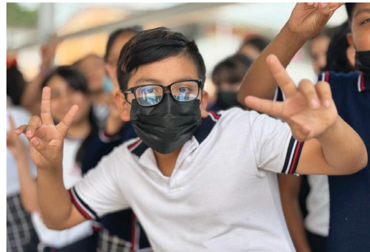
▲ Aproximadamente 360 mil estudiantes de nivel básico en Morelos suspenderán sus actividades escolares debido a la Segunda Sesión Ordinaria de Consejo Técnico Escolar.