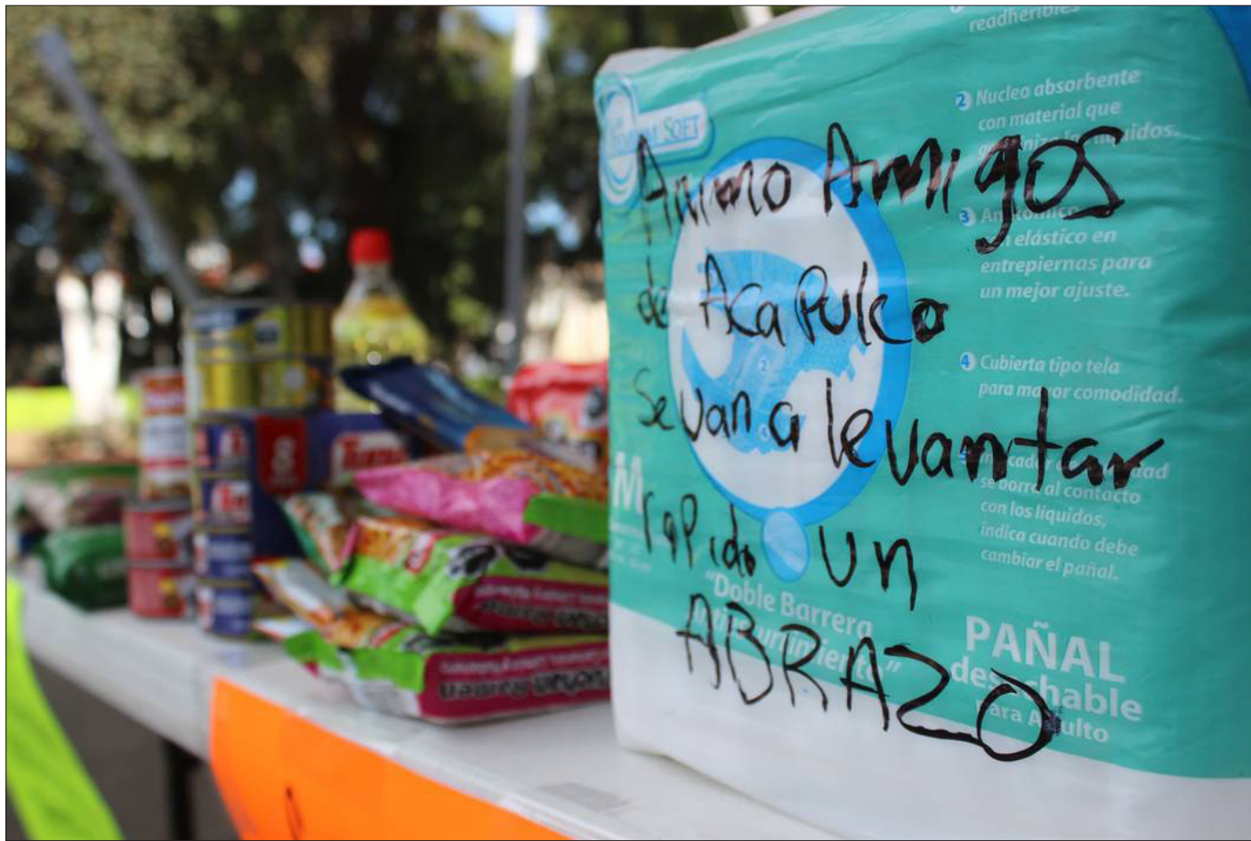
▲ Municipios y particulares han unido esfuerzos para ayudar a los afectados por el huracán Otis. / HUGO BARBERI RICO / P3 Foto: Redes Sociales