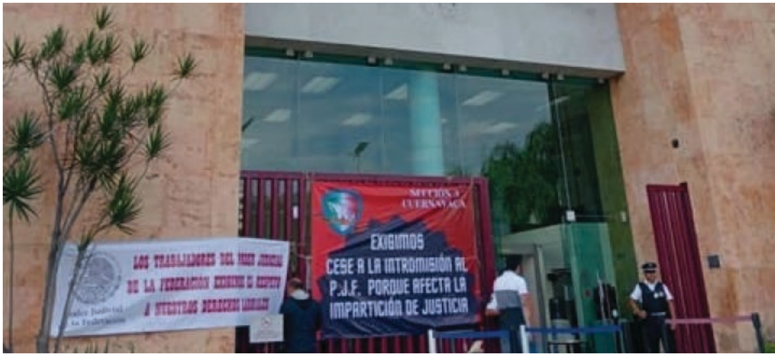
▲ Trabajadores del Poder Judicial de Morelos podrían terminar el paro de labores este domingo 29 de octubre; la manifestación trata de evitar que los fideicomisos de la SCJN y el Consejo de la Judicatura desaparezcan.

El Comité Ejecutivo Nacional de la Organización Sindical informó que después de un encuentro, los 66 secretarios generales de los Comités Ejecutivos locales firmaron una minuta para realizar un paro de labores a nivel nacional.