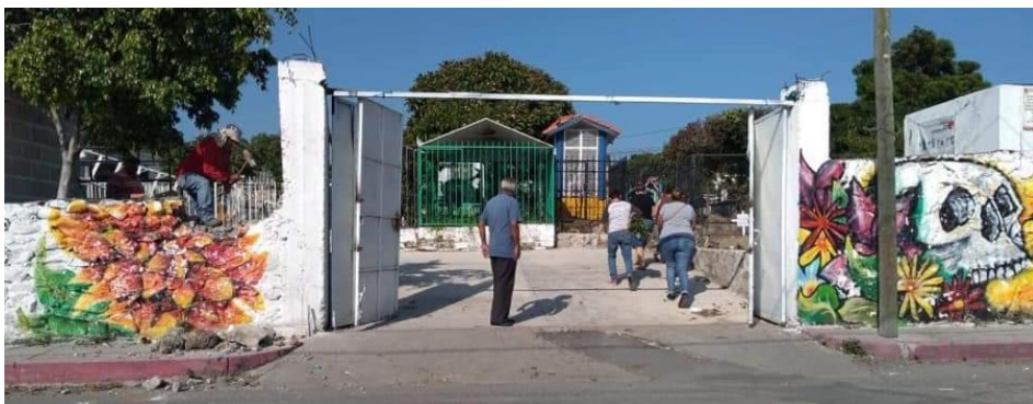
▲ Elementos de seguridad realizaron recorridos por los panteones del municipio de Temixco previo al Día de Muertos, debido a los índices de violencia que ha mostrado esta localidad recientemente.

Además, se ha informado que se llevaron a cabo jornadas de descacharrización con el objetivo de prevenir la transmisión de enfermedades transmitidas por vectores, como el dengue, zika y chikungunya. Además, se realizó una limpieza exhaustiva y se retiró la maleza de las áreas circundantes.