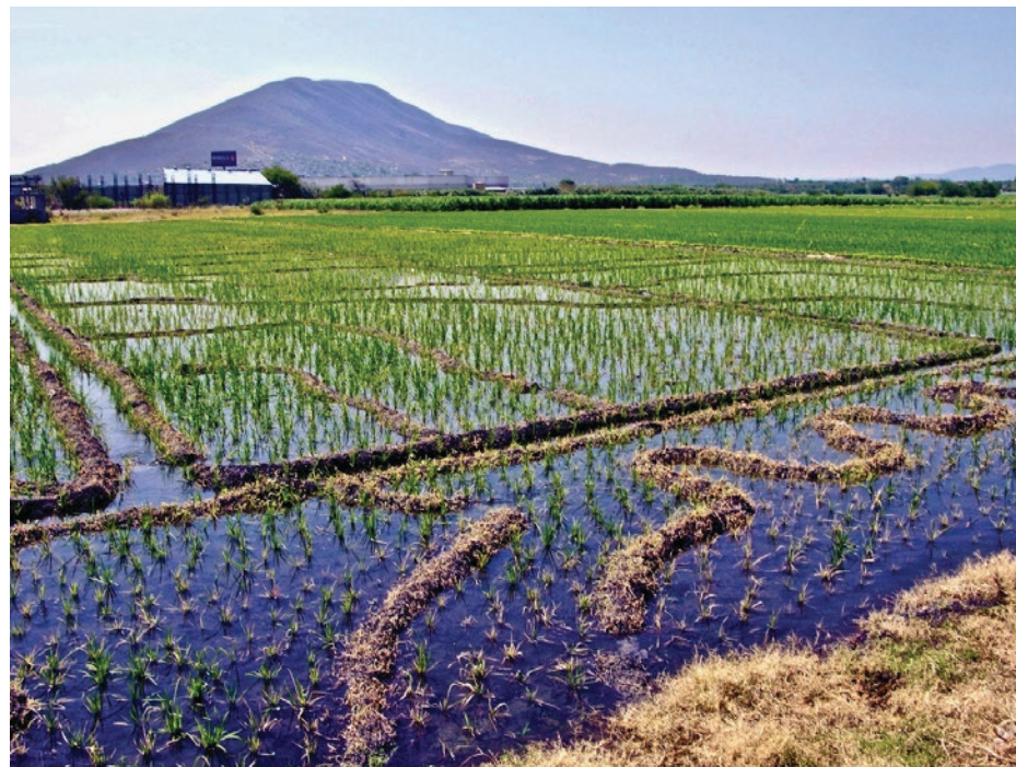
▲ Campos de arroz de Jojutla, Morelos.

Constituyen parte de los paisajes culturales, la distribución y uso de los solares domésticos en los que las hortalizas y cultivos, así como su distribución espacial, conforman una tradición en muchas de las poblaciones rurales, que desafortunadamente se han ido perdiendo por la densificación de sus solares, subdivisiones, abandono de prácticas tradicionales y la urbanización en general.