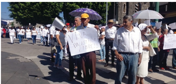
▲ Ciudadanos de Cuernavaca se manifestaron contra la violencia que se vive en la Franja de Gaza, con pancartas en mano y vestidos de blanco caminaron por las principales calles del Centro Histórico.

Los manifestantes, liderados por Gabriel Rivas Ríos y respaldados por la organización Gustavo Saldado Delgado, instan a que Palestina sea libre y deje de estar bajo constante acoso debido a la guerra y la invasión de su territorio. La situación en Palestina ha generado preocupación a nivel mundial y continúa siendo un tema de debate en la comunidad internacional, concluyó.