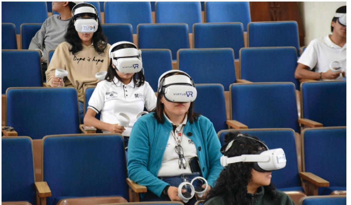
▲ El objetivo del programa es crear conciencia sobre las graves consecuencias del consumo de drogas.

El programa se centra en la prevención y busca proporcionar información valiosa para comprender y abordar el uso de sustancias nocivas entre los jóvenes en Cuernavaca.