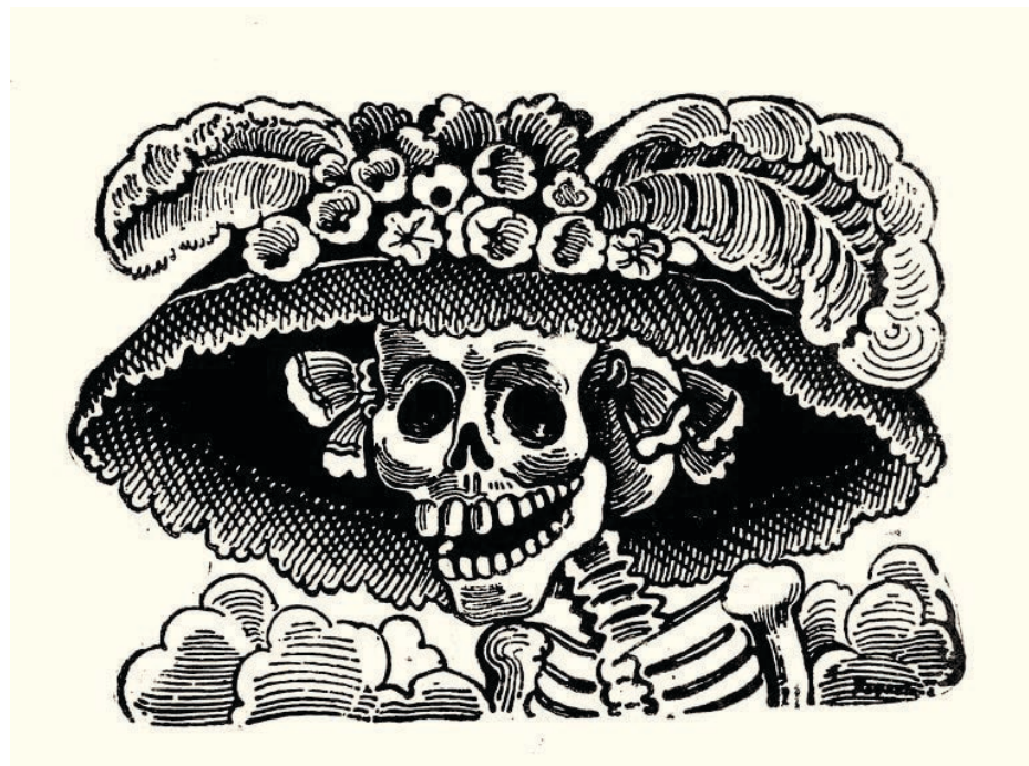
▲ Imagen: Redes sociales.

La Catrina, aunque nacida en un contexto de crítica social, se ha convertido en un ícono de la moda y la cultura mexicana. Su imagen adorna ropa, accesorios y se exhibe en todo el mundo. Pero, no perdamos de vista su origen. En su rostro sonriente y elegante, todavía hay un mensaje profundo sobre la importancia de abrazar nuestras raíces y luchar contra la desigualdad.