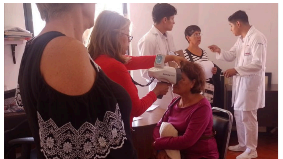
▲ Esta campaña es completamente apolítica y está abierta a cualquier persona que necesite lentes.

Esta donación es una bendición para la población de Cuernavaca, especialmente para los adultos mayores con dificultades económicas, quienes ahora tendrán acceso gratuito a lentes que mejorarán significativamente su calidad de vida.