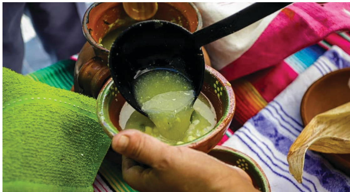
▲ Los asistentes pudieron deleitarse con un caldo verde de res con setas y guajes frescos, característico del municipio de Yauatepec.

El certamen reconoció a los mejores platillos evaluando, además del sabor el contenido histórico, ancestral y social que fue determinado por un jurado. El evento tuvo como sede la Plaza de Armas de Cuernavaca.