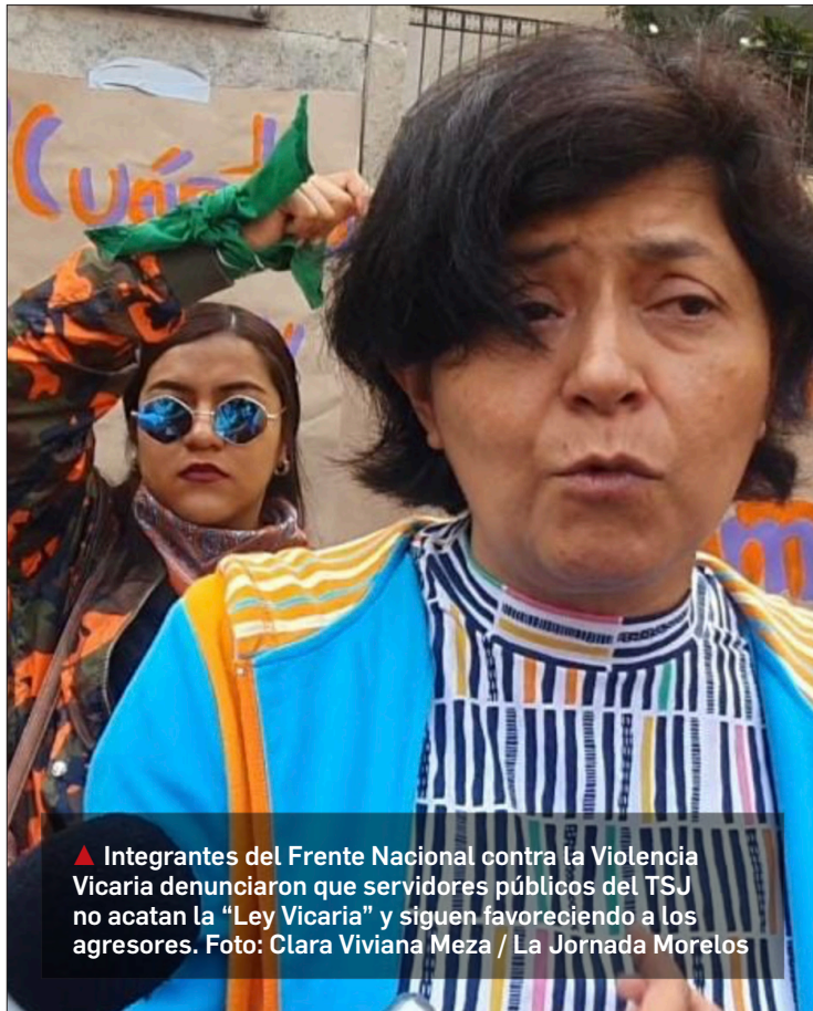
▲ Integrantes del Frente Nacional contra la Violencia Vicaria denunciaron que servidores públicos del TSJ no acatan la "Ley Vicaria" y siguen favoreciendo a los agresores.