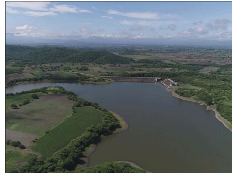
▲ Los niveles de las presas y cuerpos de agua del estado aún podrían mejorar pues la temporada de lluvias todavía no acaba.

Ante estos escenarios, autoridades de la Conagua piden a los ciudadanos extremar precauciones y estar atentos a los llamados de áreas como protección civil, a fin de tomar las medidas pertinentes para salvaguardar su integridad física.