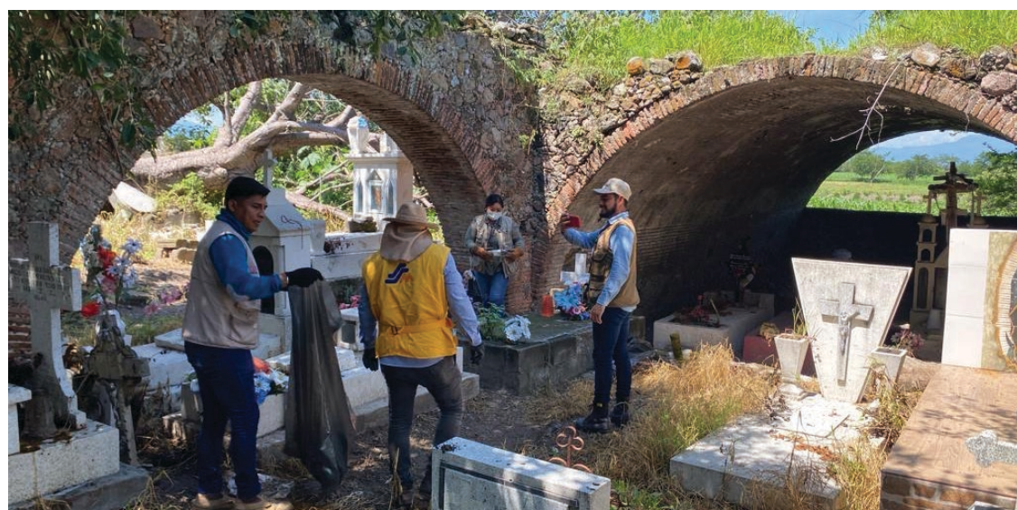
▲ En Puente de Ixtla, por el momento, están enfocados en la limpieza de los cementerios del municipio, ya que se acercan los días en que las familias visitan a sus fieles difuntos.