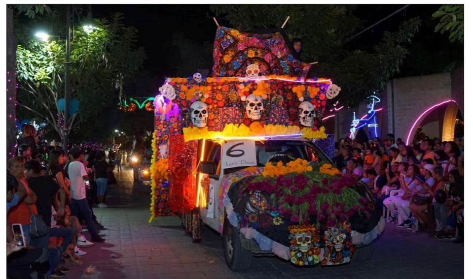
▲ El desfile incluyó más de 22 carros alegóricos con diversas temáticas.