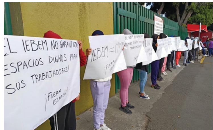
▲ Padres de familia del preescolar Federico Froebel ubicado en Tlaltenango, se sumaron a las protestas de este lunes en el IEBEM, exigieron el regreso del plantel ya que quedan muchos menores sin educación.

Al centro capitalino también llegaron docentes de los cinco planteles del Conalep en Morelos, quienes denunciaron la falta de pagos para liquidar los adeudos en los créditos de los 120 trabajadores con el ISSSTE Y FOVISTE desde el 2022, por lo que también exigieron a las autoridades educativas que respeten sus derechos laborales como institución pública.