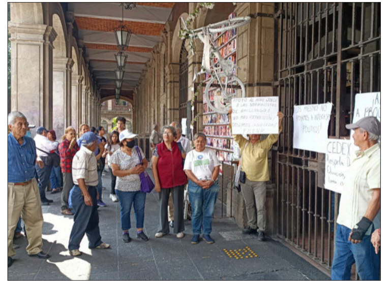
▲ Padres de familia de alumnos del Centro de Educación Extraescolar, denunciaron agresiones por parte de sus profesores que han llegado a golpearlos, piden la intervención de las autoridades.

La exigencia de madre e hija, es que autoridades educativas remuevan de sus cargos a los supuestos agresores y permitan la garantía de uno de los derechos fundamentales: el acceso a la educación.