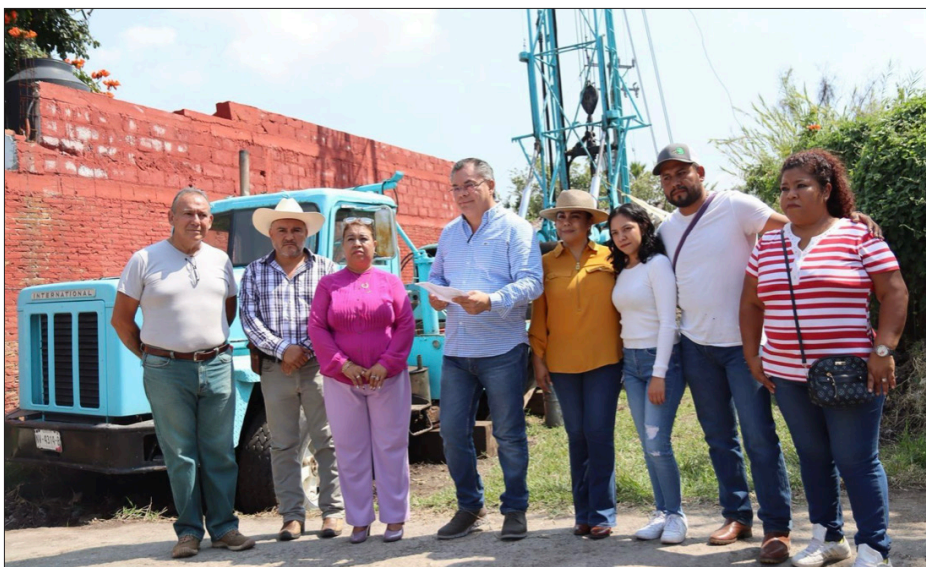
▲ La obra representa una inversión de 6.5 millones de pesos en beneficio de dos mil 260 habitantes.