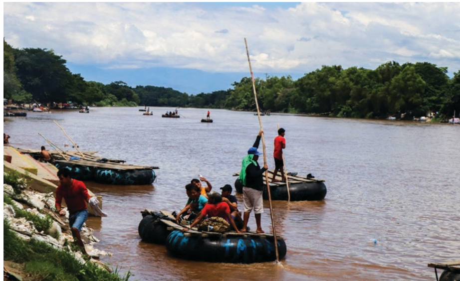
▲ Migrantes en el río Suchiate, Chiapas.

*Milpaltense, internacionalista, escritor y migratólogo.